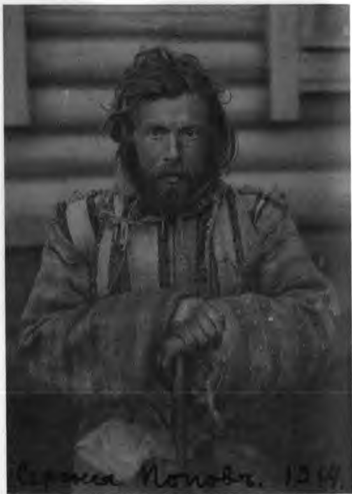
С.М. Попов. 1914 г.