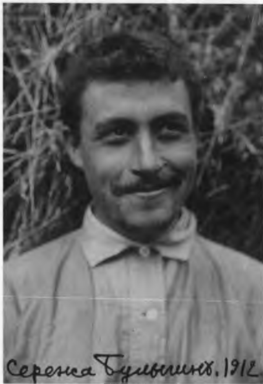
С.М. Булыгин. 1912 г.