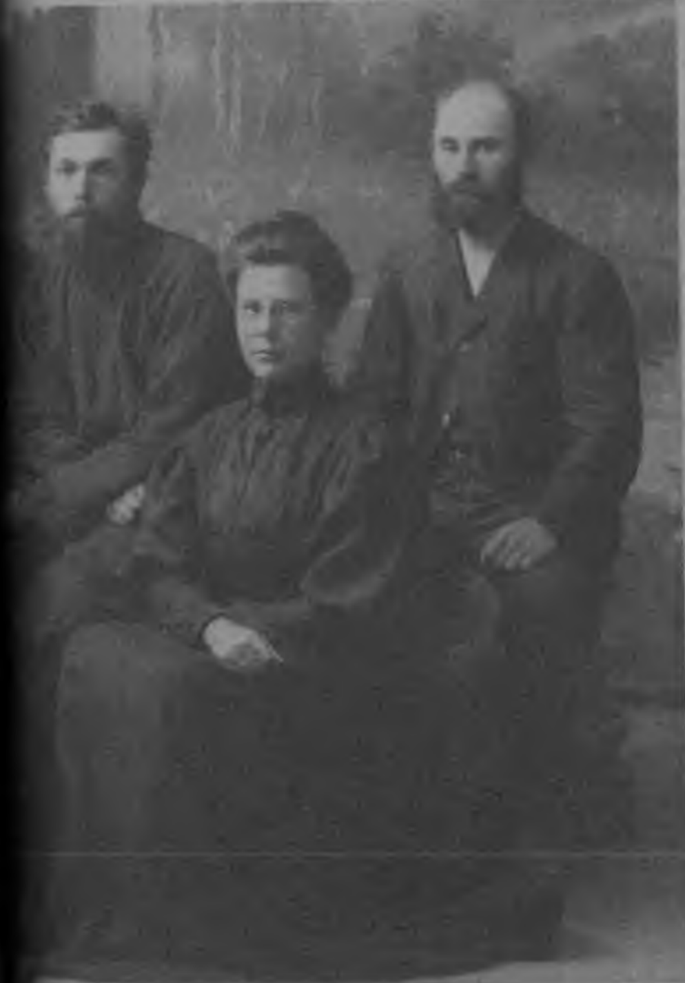
Tamm from previous A. H. Bradford