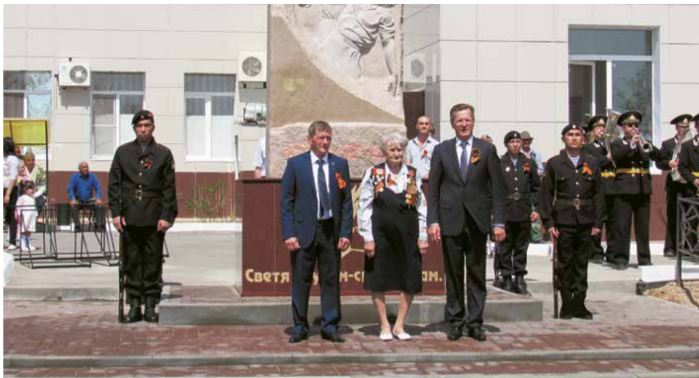
Памятник медикам Астрахани. Территория больницы им. С. М. Кирова