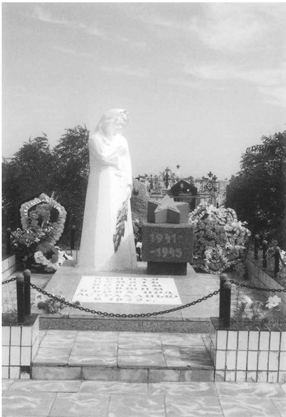
Памятник «Скорбящая мать» на братской могиле воинов, павших под Астраханью в 1942 г. Кладбище в с. Солянка Наримановского района Астраханской области