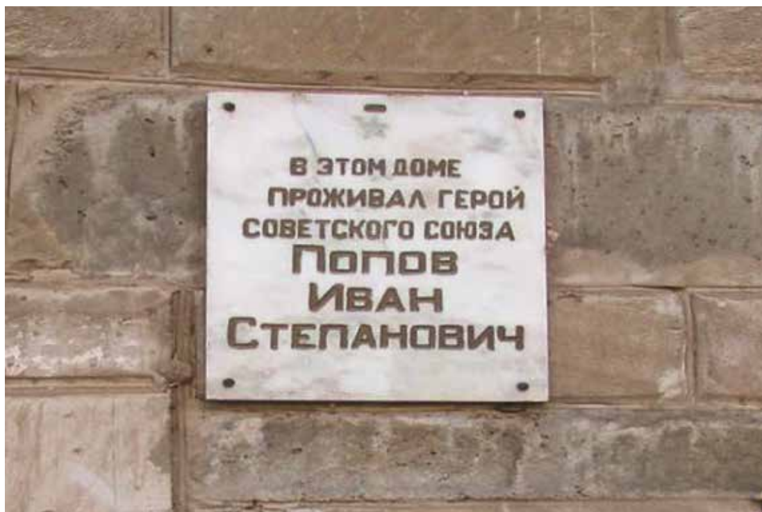
Мемориальная доска Герою Советского Союза И. С. Попову. Ул. Хибинская, 10