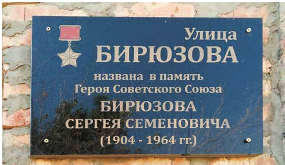
Мемориальная доска Герою Советского Союза С. С. Бирюзову. Ул. С. Бирюзова, 81