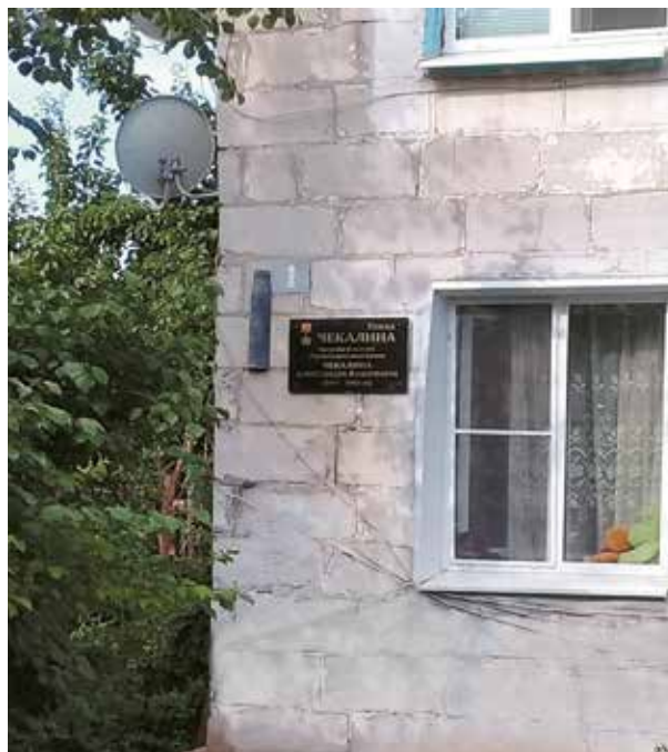
Мемориальная доска Герою Советского Союза А. П. Чекалину. Ул. А. Чекалина, 1