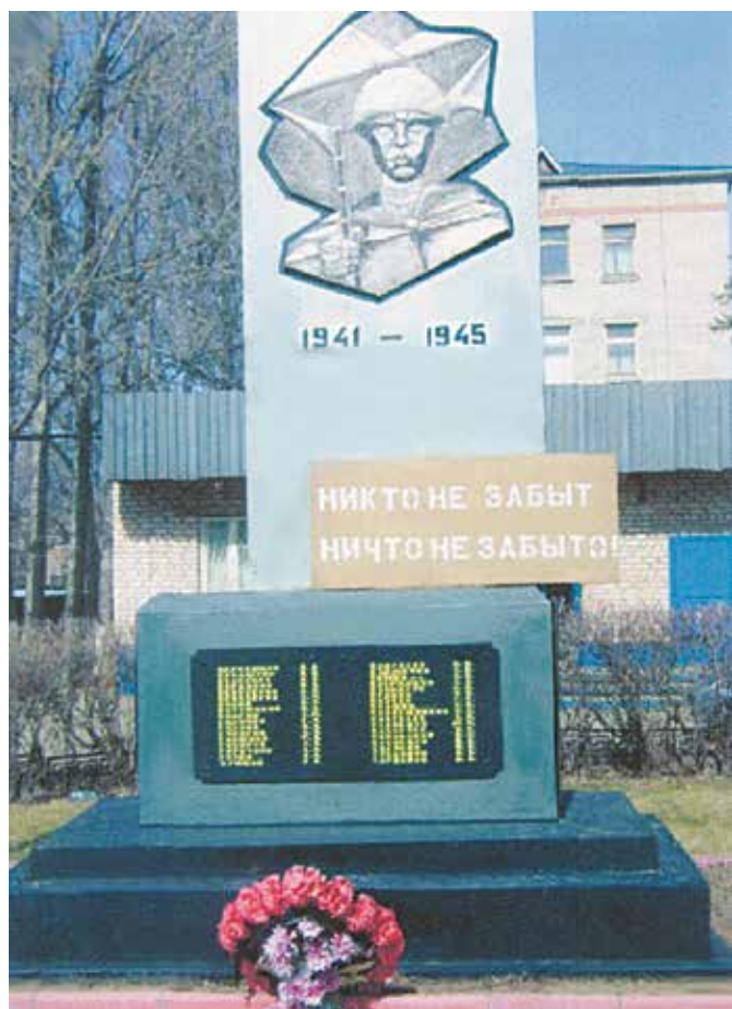
Памятник работникам завода им. В. И. Ленина, погибшим в Великой Отечественной войне 1941–1945 гг. Территория ЗАО «ССЗ им. В. И. Ленина»