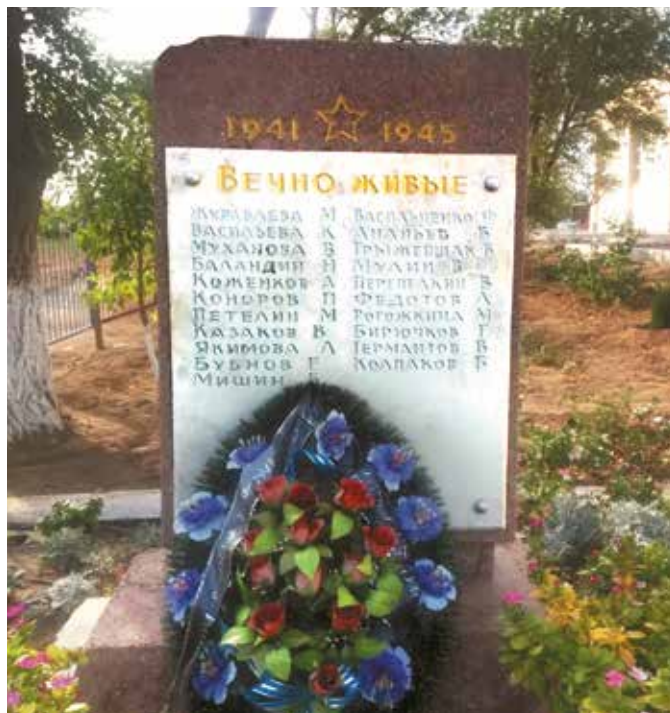
Памятник выпускникам средней школы № 58, погибшим в годы Великой Отечественной войны 1941–1945 гг.