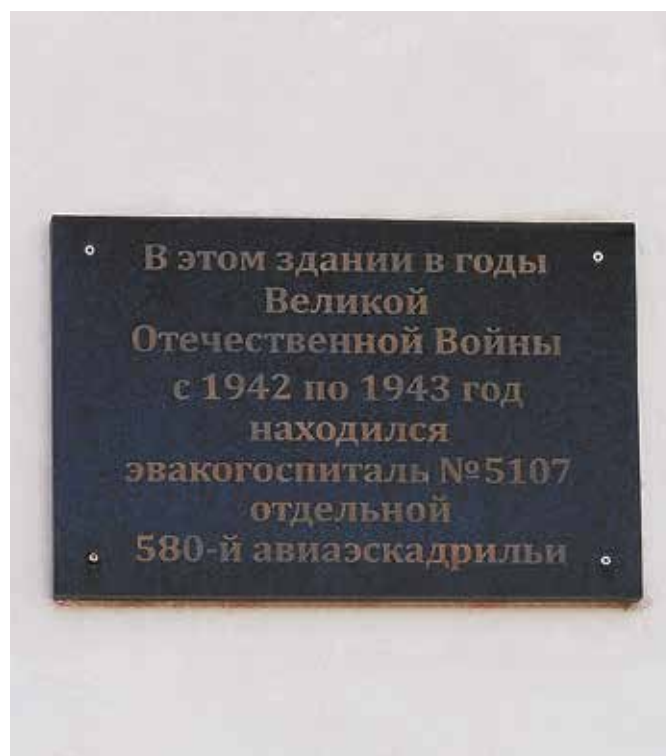
Мемориальная доска воинам, погибшим в годы Великой Отечественной войны. СКШИ № 4, АЦКК, ул. Железнякова, 36