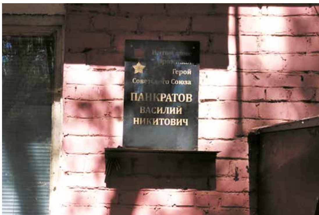
Мемориальная доска Герою Советского Союза В. Н. Панкратову. Пер. Ленинградский, 66