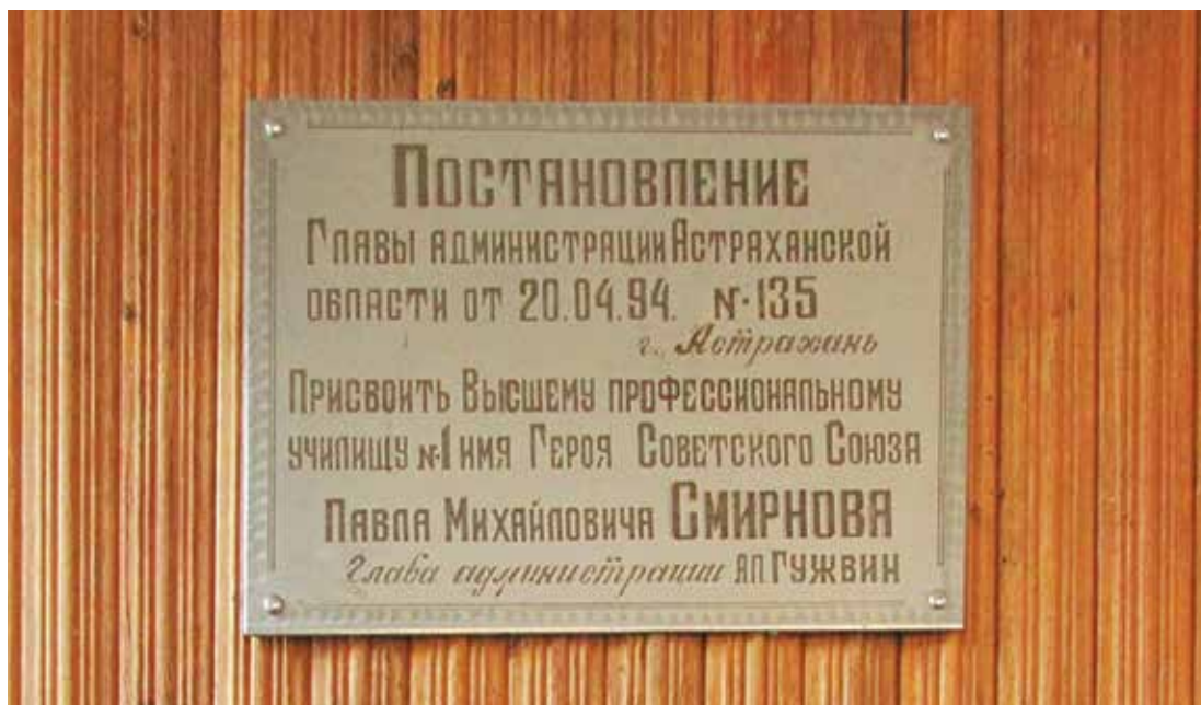
Памятная доска Герою Советского Союза П. М. Смирнову. Профессиональное училище АГАСУ. Ул. Магистральная, 1