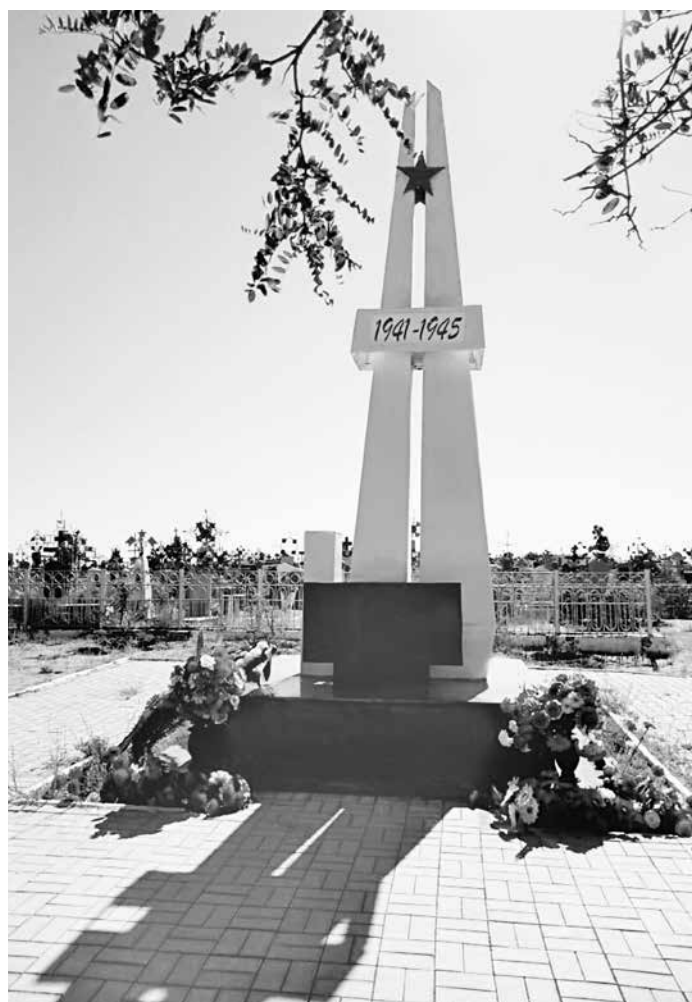
Старое Трусовское кладбище по ул. Керченской, 61