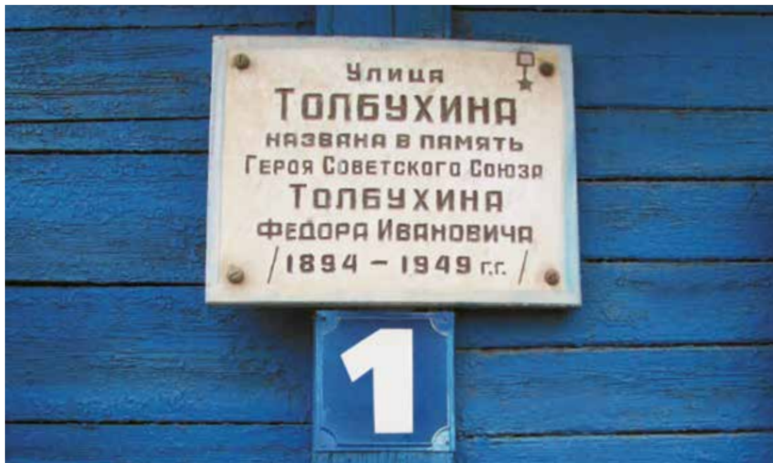
Мемориальная доска Маршалу Советского Союза Ф. И. Толбухину. Ул. Толбухина, 12