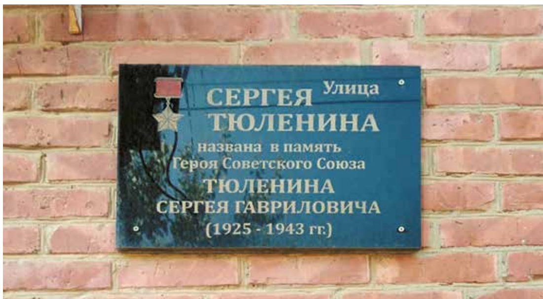
Мемориальная доска Герою Советского Союза С. Г. Тюленину. Ул. С. Тюленина, 87