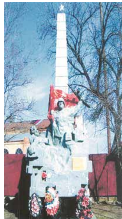
Памятник работникам бондарного завода им. Ф. Э. Дзержинского, погибшим в годы Великой Отечественной войны 1941–1945 гг. Территория завода ООО ПКФ «Астрыбтара»