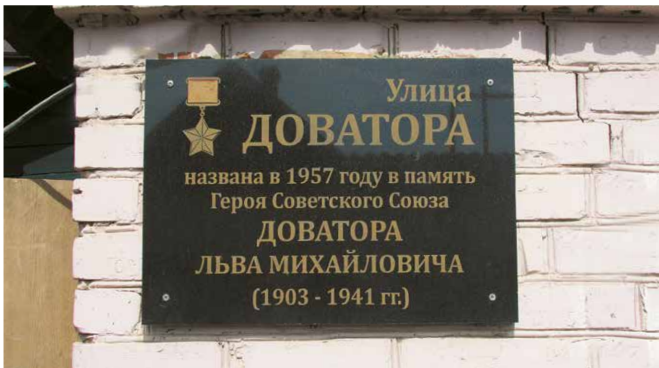
Мемориальная доска Герою Советского Союза Л. М. Доватору. Ул. Доватора, 1