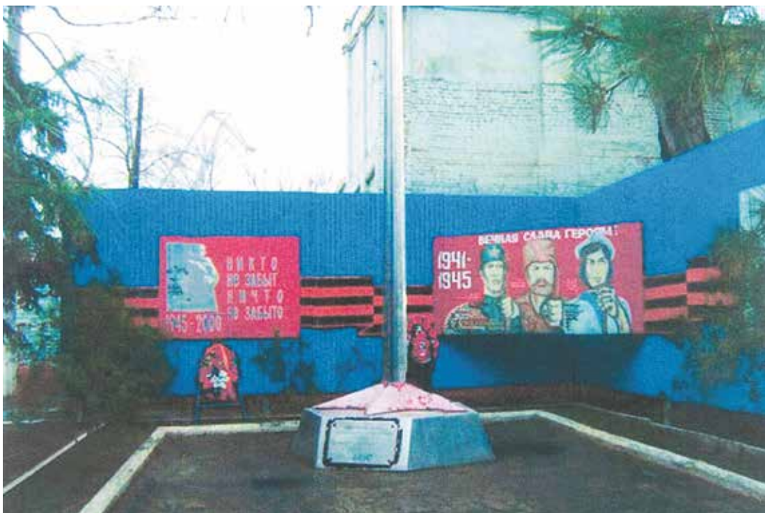
Памятник работникам завода им. X лет Октября, погибшим в годы Великой Отечественной войны 1941–1945 гг. Территория ЗАО «СРЗ им. А. П. Гужвина»