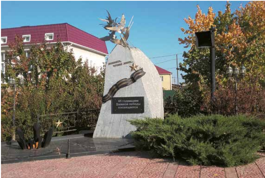
Памятник работникам газовой промышленности, погибшим в годы Великой Отечественной войны 1941–1945 гг.