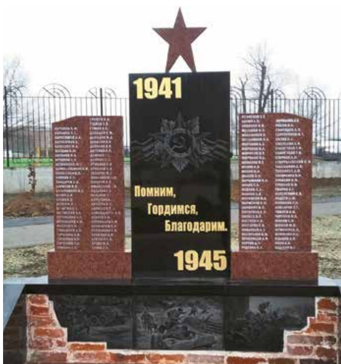
Памятник работникам завода им. III Интернационала, погибшим в годы Великой Отечественной войны 1941–1945 гг. Парк микрорайона «III Интернационал»