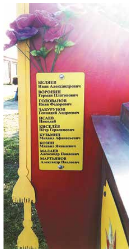
Памятник работникам деревообрабатывающего комбината, погибшим в годы Великой Отечественной войны 1941–1945 гг. Территория ДОК