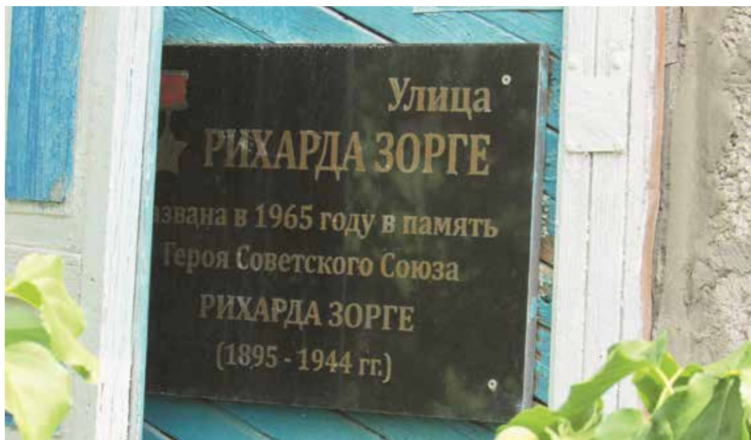
Мемориальная доска Герою Советского Союза Рихарду Зорге. Ул. Рихарда Зорге, 3