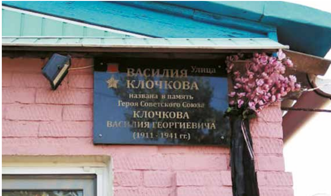
Мемориальная доска Герою Советского Союза В. Г. Ключкову. Ул. В. Ключкова, 1