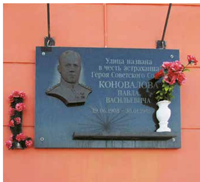
Мемориальная доска Герою Советского Союза П. В. Коновалову. Ул. Коновалова, 2/4, микрорайон АЦКК