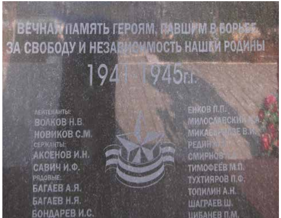
Братская могила воинов, умерших в госпиталях. Ул. Керченская, 61