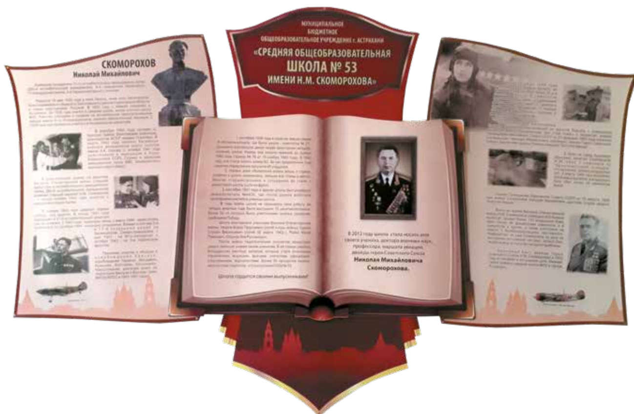
Средняя общеобразовательная школа № 53 носит имя дважды Героя Советского Союза Н. М. Скоморохова