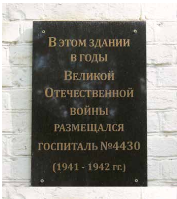
Мемориальная доска воинам, погибшим в годы Великой Отечественной войны (госпиталь). АКПТ-9, ул. Таганская, 30