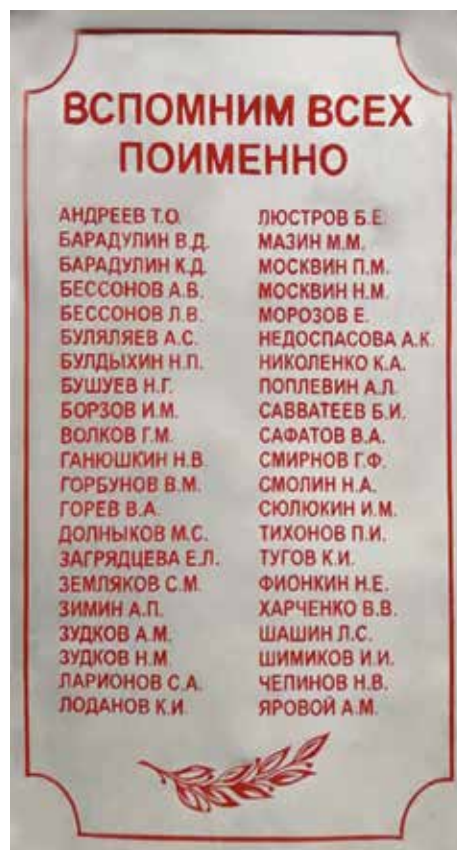
Памятник выпускникам средней школы № 55, погибшим в годы Великой Отечественной войны 1941–1945 гг. Территория средней школы № 55