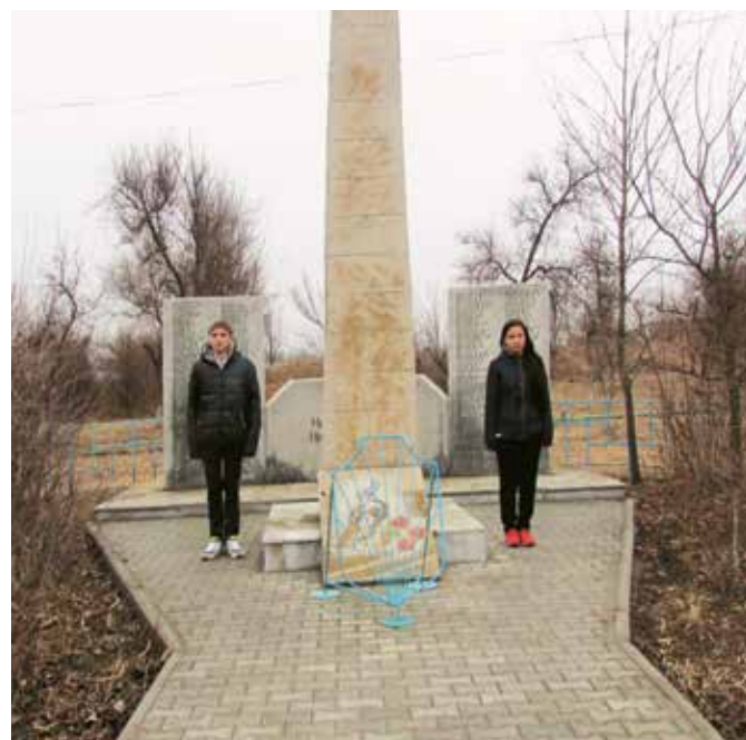
Памятник жителям поселка Приволжье, погибшим в годы Великой Отечественной войны 1941–1945 гг. Парк культуры и отдыха в микрорайоне п. Приволжье