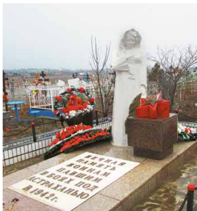
Памятник «Скорбящая мать» воинам, павшим в боях под Астраханью в 1942 г. Кладбище «Новострой», с. Солянка