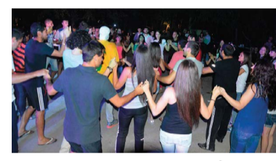
Като Хоро - многочасовой медленный круговой танец