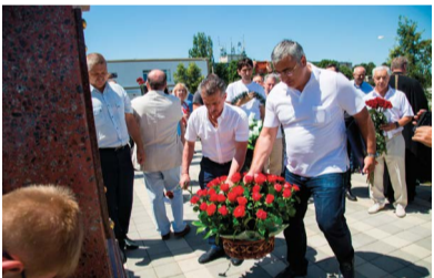
Возложение цветов к бюсту В. К. Коккинаки

«Именно 25 июня 116 лет назад в соседнем с нами Новороссийске родился Владимир Коккинаки. Для аэропорта Анапы – очень символически».