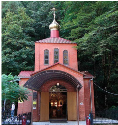
Часовня «Святая Рука», ст. Неберджаевская

Одним из значимых религиозных торжеств Греции является праздник Успения Пресвятой Богородицы, родной матери всех греков, их защитницы и покровительницы. За размахом и атмосферой радости этот праздник греки называют «Летней Пасхой». Пятнадцатого августа десятки тысяч верующих отправляются в храмы, посвященные