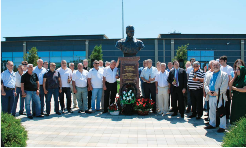
Привокзальная площадь аэропорта г. Анапа

25 июня на территории аэропорта Анапы состоялось торжественное открытие бюста дважды Герою Советского Союза Владимиру Константиновичу Коккинаки. Имя заслуженного летчика-испытателя было присвоено ближайшей от Новороссийска воздушной гавани.