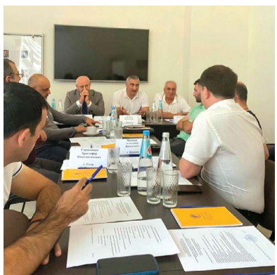
Заседание Правления ОО РНКА греков Краснодарского края, г. Новороссийск

26 сентября в офисе Новороссийского городского греческого общества состоялось первое заседание Правления ОО РНКА греков Краснодарского края в новом составе. Присутствовали члены совета старейшин и правления НГГО, гости из Геленджика, Крымска и Краснодара.