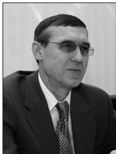
Мачехин Георгий Николаевич, глава администрации г. Кирова (февраль 2008 г. – наст. время).

Родился 4 сентября 1953 г. в г. Куйбышеве.