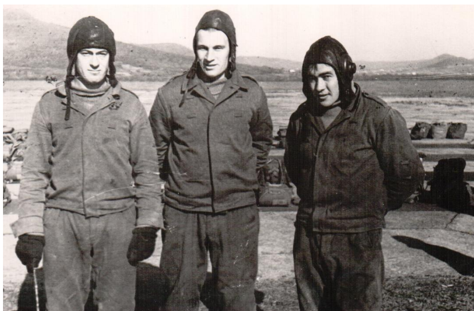
На сборах с опытными моряками, 1964 год