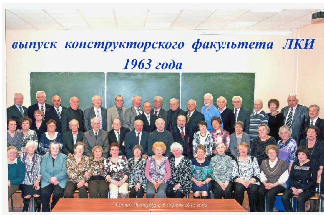
Пятьдесят лет выпуска