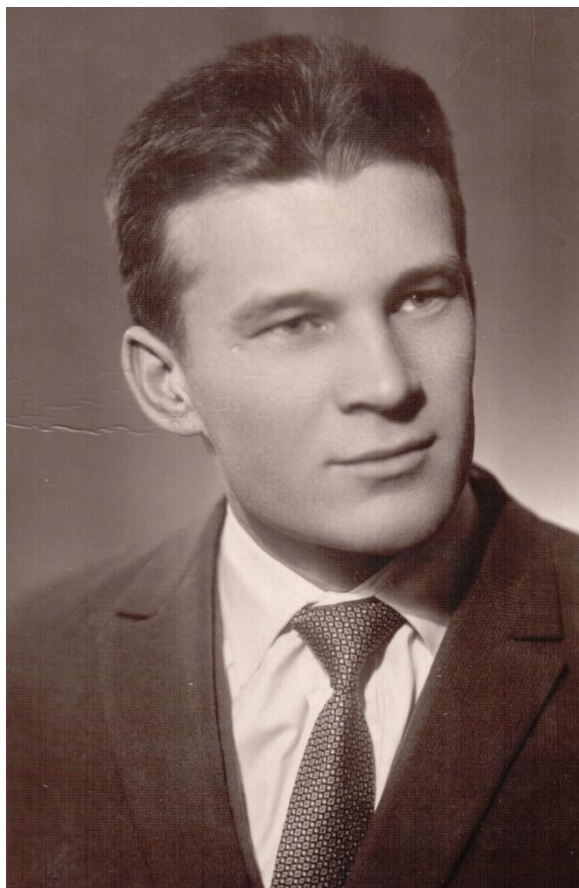
Институт окончен, диплом защищен, 1963 год