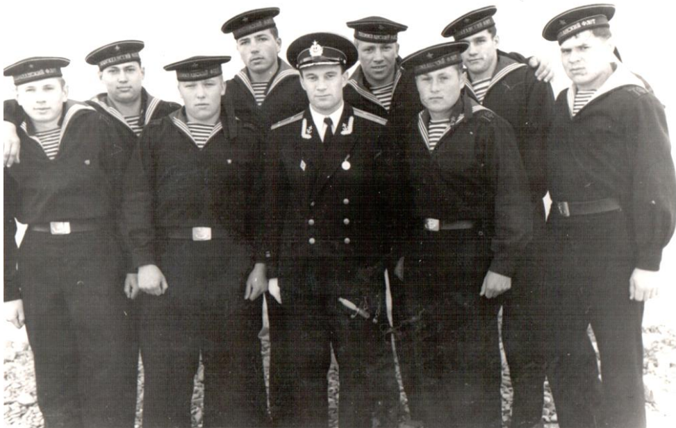
Все внимание новому отряду молодых матросов, 1966 год