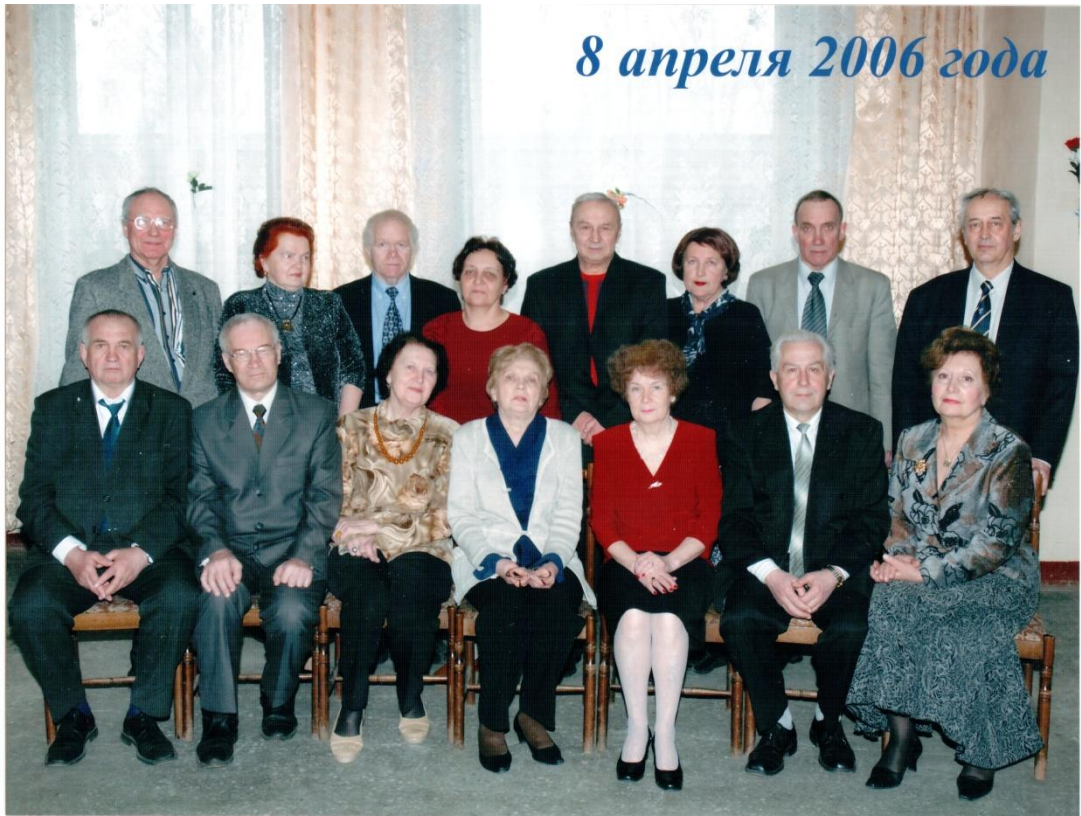
Торпедисты на встрече 2006