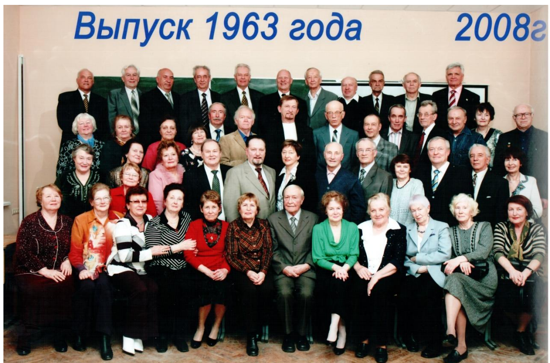
Нашему выпуску ЛКИ 45 лет