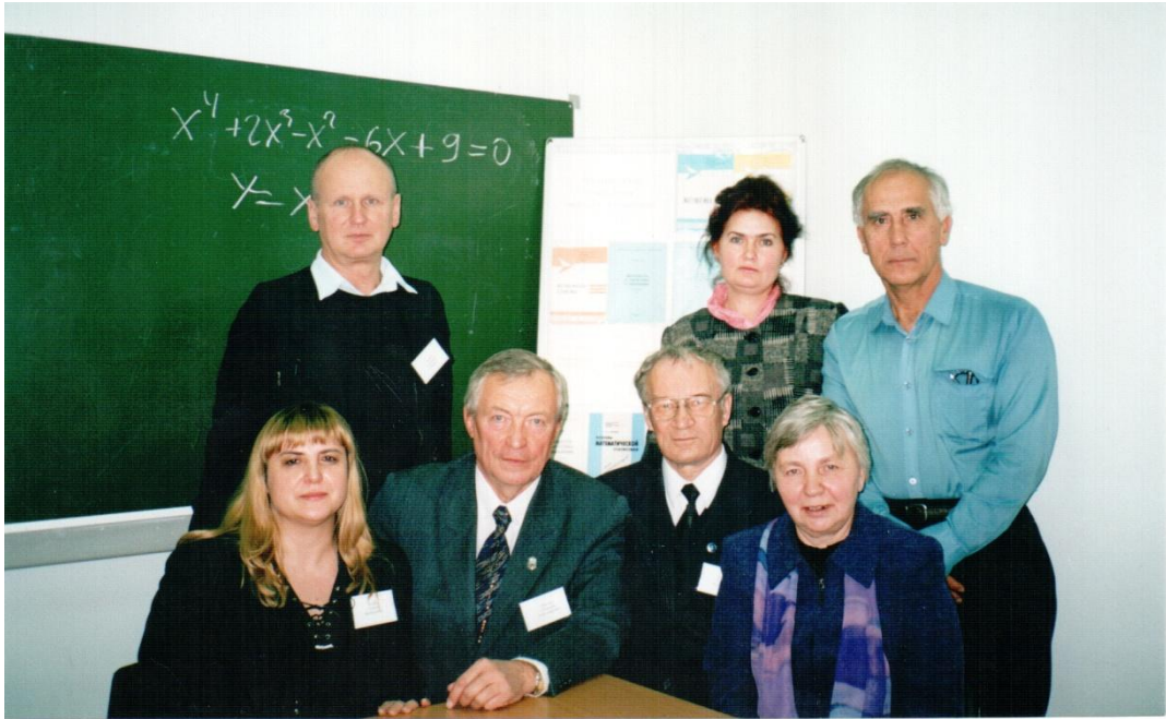
Кафедра математики провела научно-методический семинар с филиалами, 2003 год