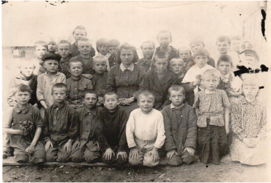
3-й класс Кряжевской начальной школы, весна 1950 года