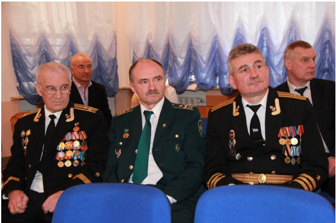
Чествование ветеранов в день Защитника Отечества, февраль 2013 г.