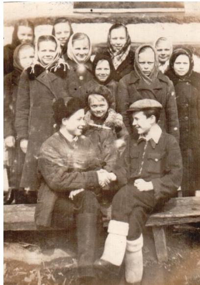
Ранняя весна 1954 года в деревне Алканка. В кругу сверстников