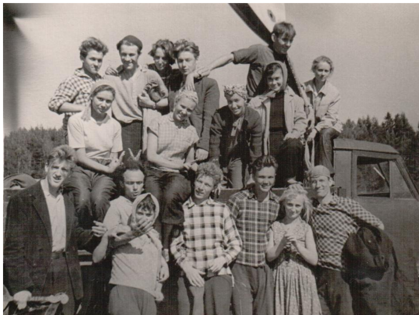
Летний культпоход по Карельскому перешейку, 1959 год