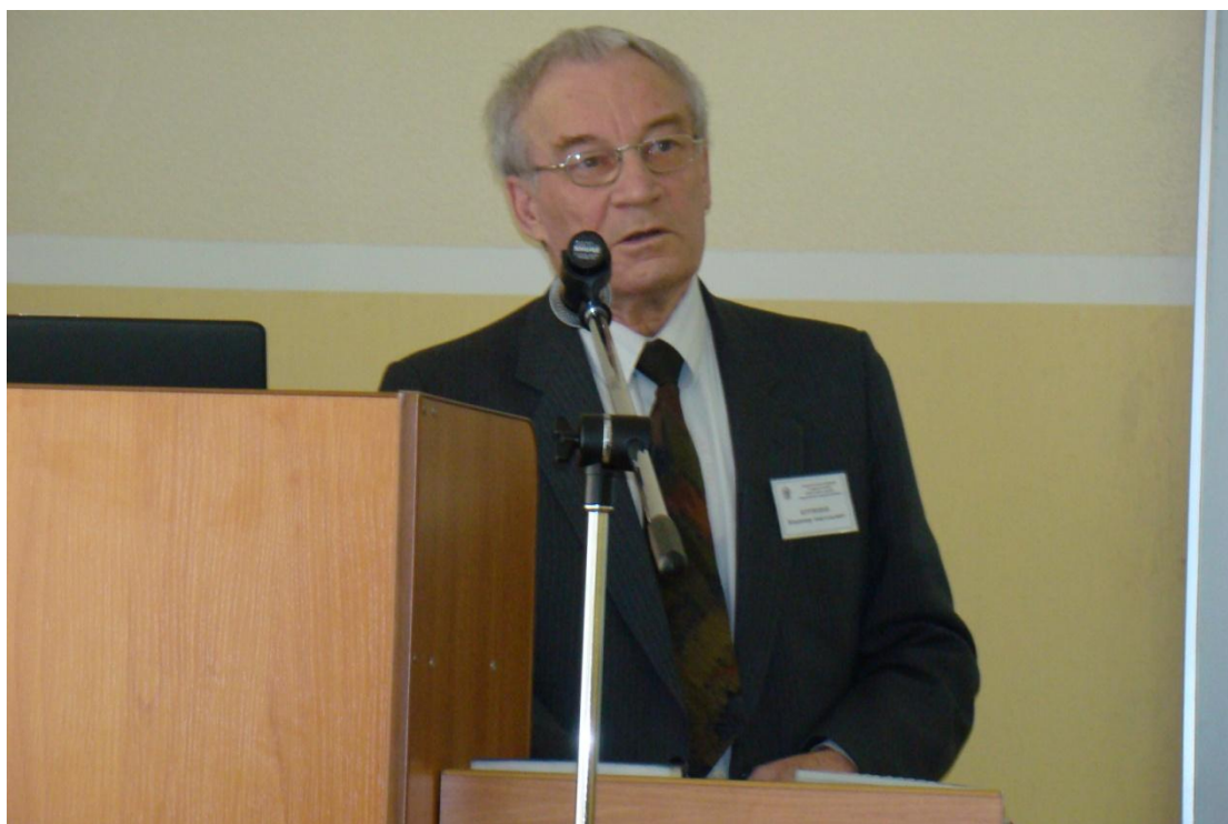
С докладом на НТК-2010