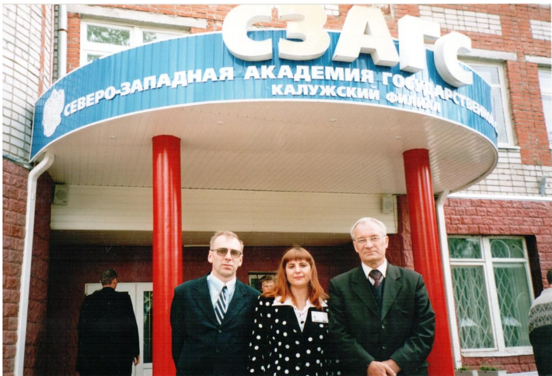
В перерыве работы научной конференции в Калуге в 2005 году