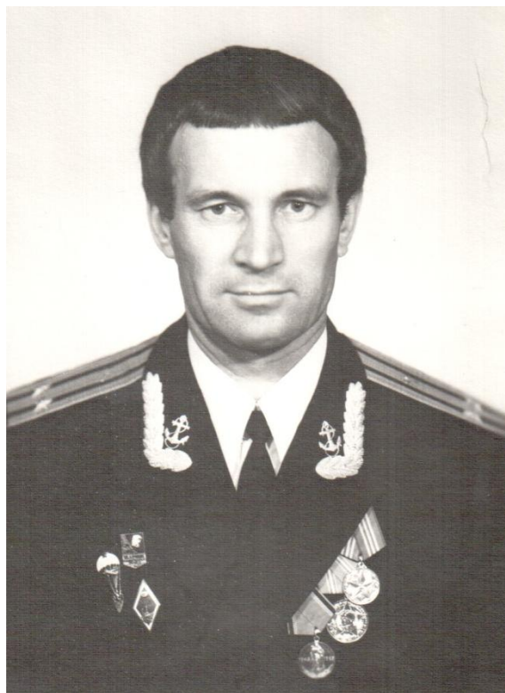
Назначен начальником отдела, 1978 год