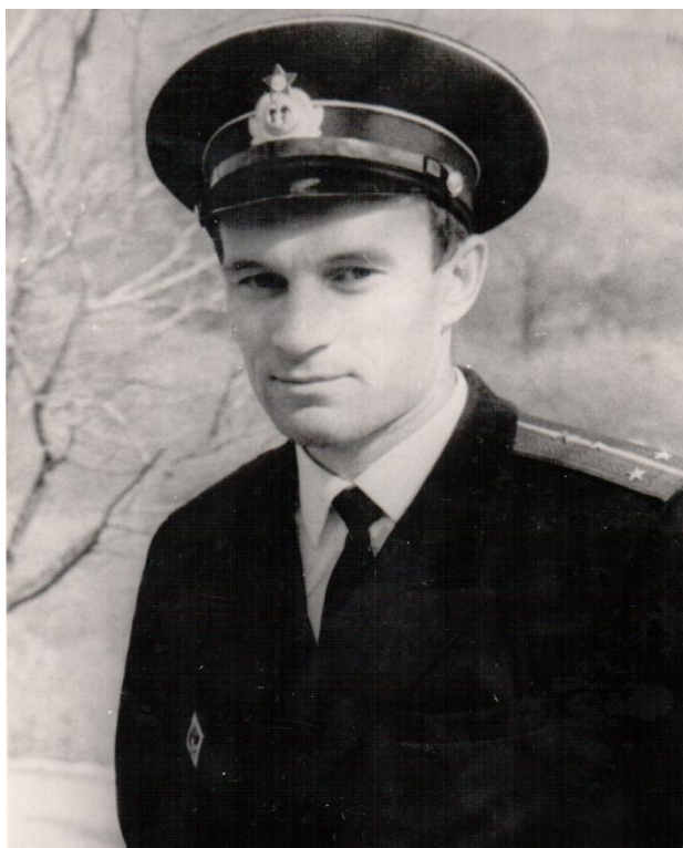
Уже не мальчик. Понял, какова служба на грани с экстримом, 1966 год