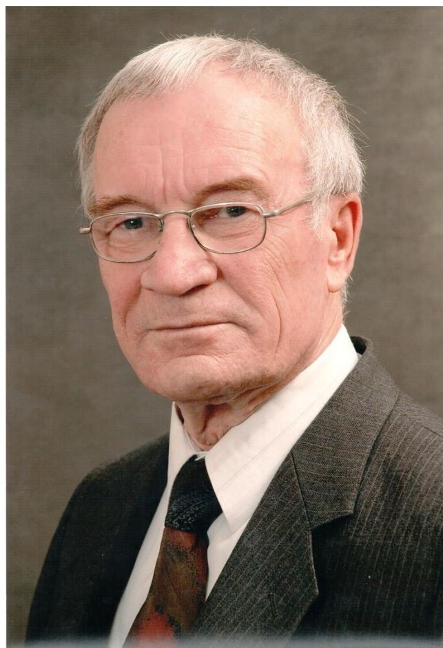
С доски почета в СЗАГС. Человек года.2009 год