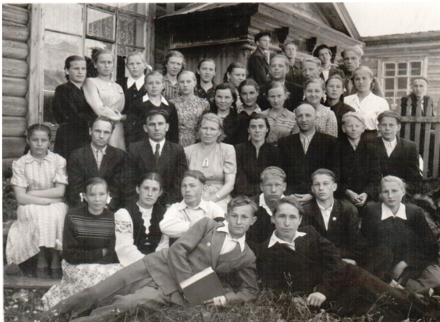
Окончен 9-й класс. Два дружных класса, «Б» и «В», июнь 1956 год, Кикнур