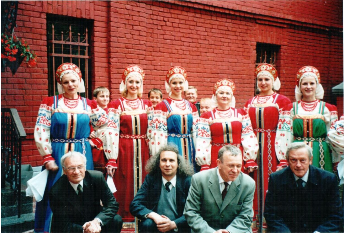
Культурная программа научной конференции в Калуге в 2006 году