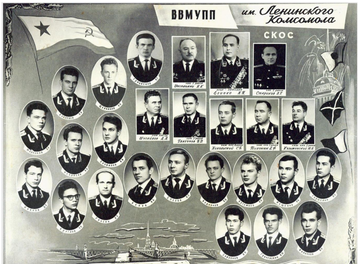
Выпуск КОС при Училище подводного плавания, 1964 год