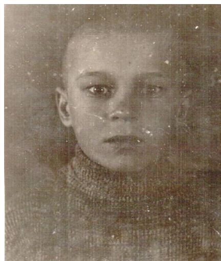
1946 год, деревня Алканка

Итак, прощай школа, прощайте друзья. Впереди новая, пока неизвестная жизнь.