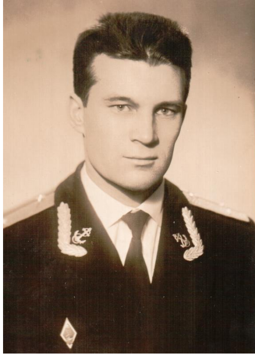
Родине нужны молодые офицеры на флоте, 1963 год

к новому месту службы» и распрощались с училищем. Для меня впереди был Тихоокеанский флот, Владивосток и полная неизвестность.