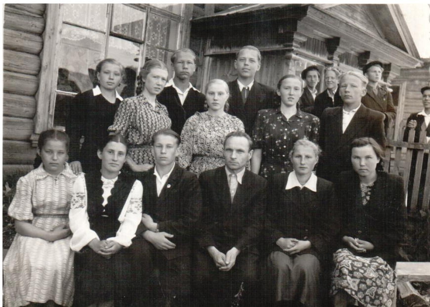
9-й «В» класс после экзаменов, 1956 год, Кикнур