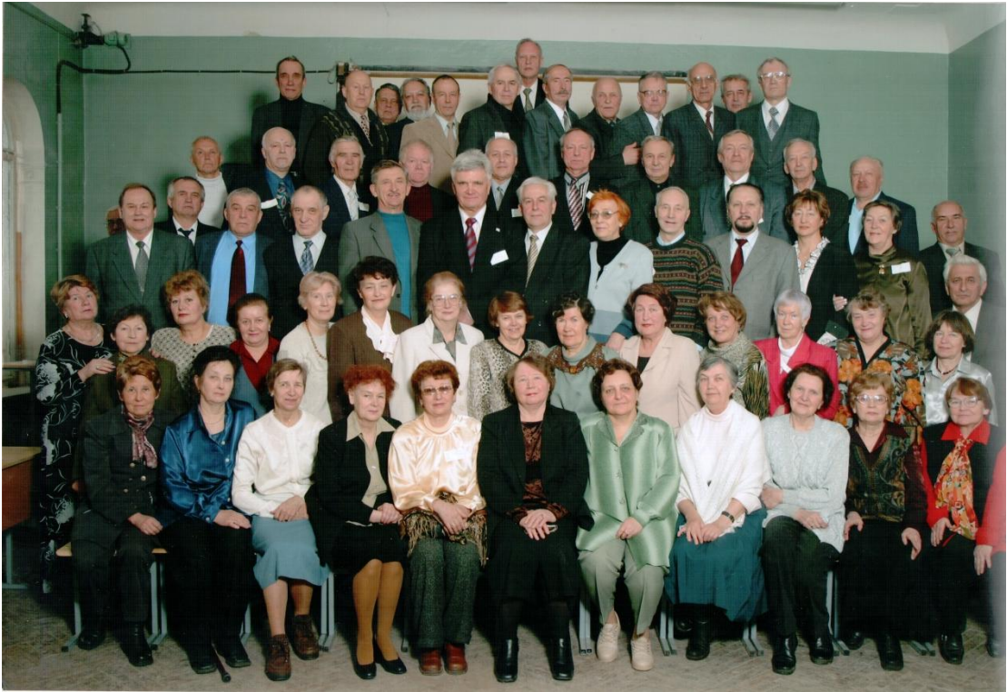
Сорокалетний юбилей выпуска приборфака ЛКИ. Большой сбор. 2003 год