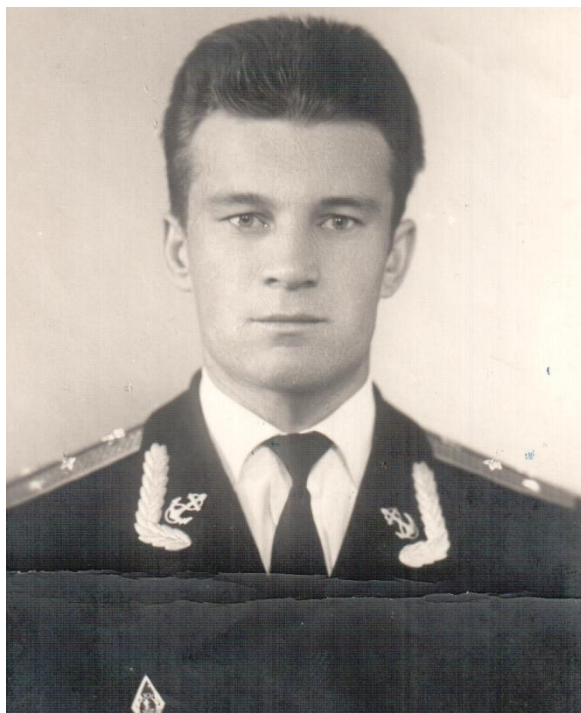
Прибыл для дальнейшего продолжения службы, 1964 год