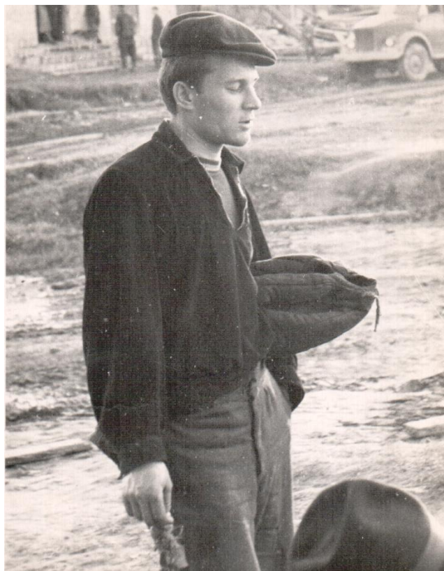
Третий колхоз за время учебы в институте. Кайболово, 5-й курс, 1961 год