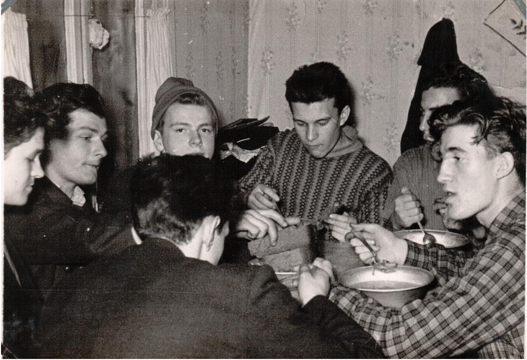
И в зимние каникулы приятно участвовать в культпоходе по Ленинградской области, 1960 год