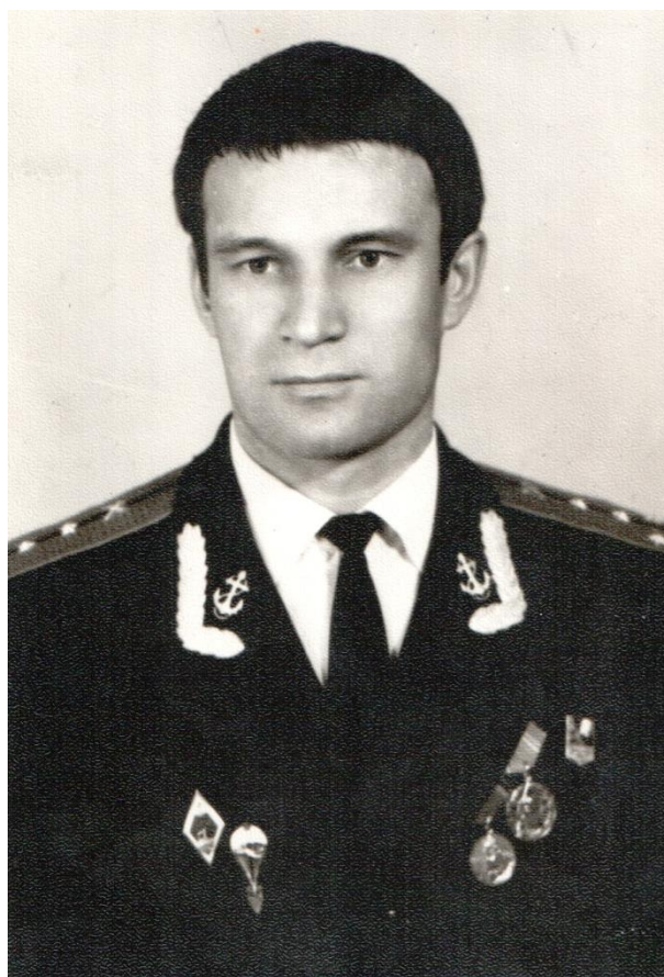
Служба в Александровском дворце г. Пушкина пошла нормально, нужно много работать, 1970 год