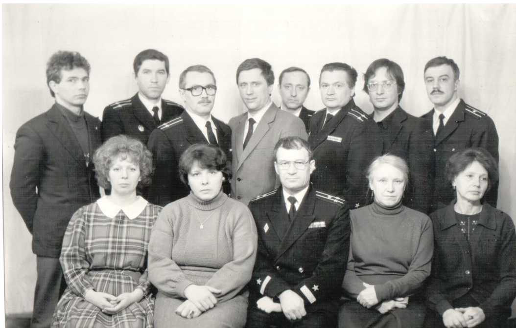
Начальник научного отдела с сотрудниками, 1988 год.