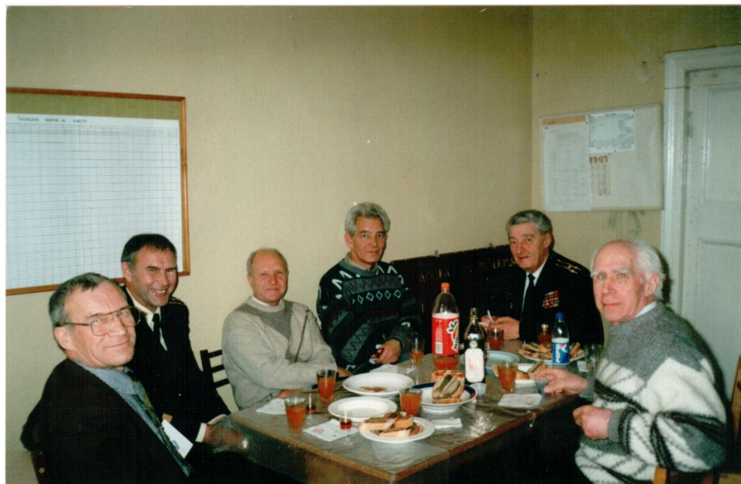
Заседание кафедры в ограниченном составе, 1997 год