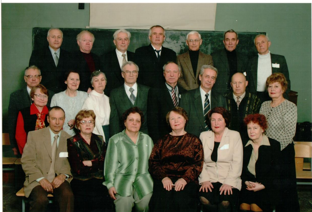
Механики-торпедисты на юбилее, 2003 год