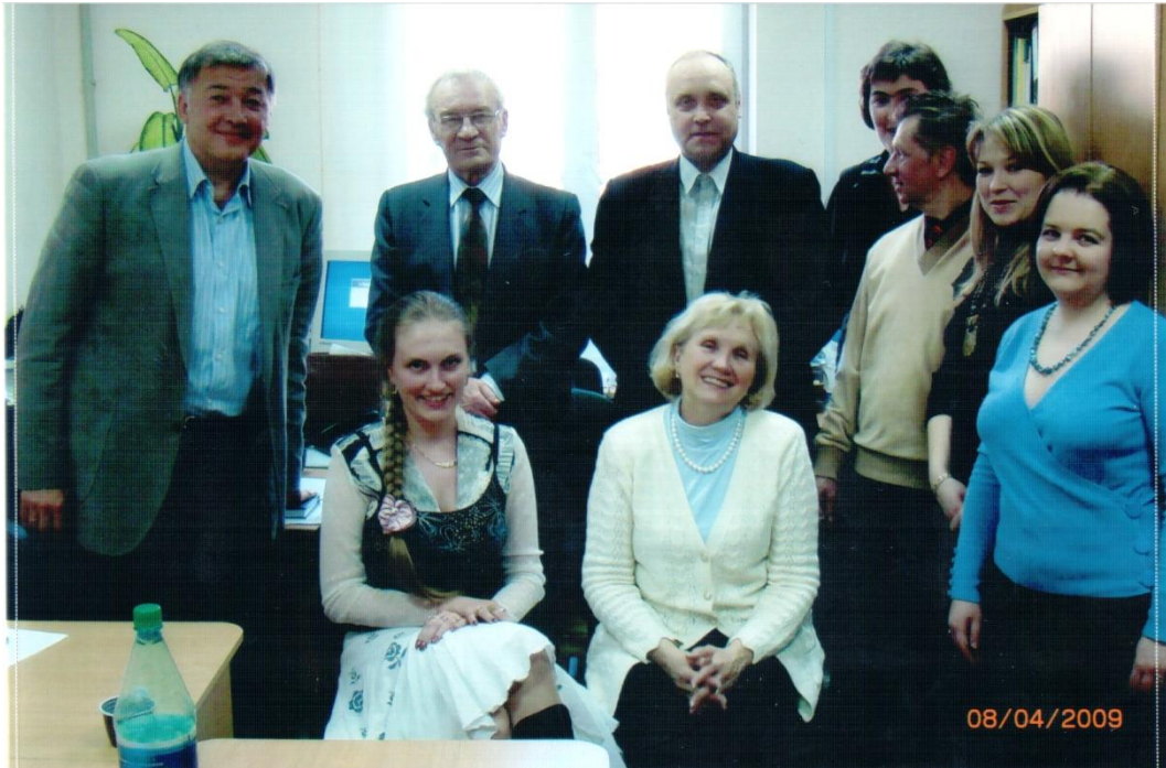
На кафедре Экономической кибернетики Харьковского национального экономического университета. Международная конференция. Апрель 2009 года