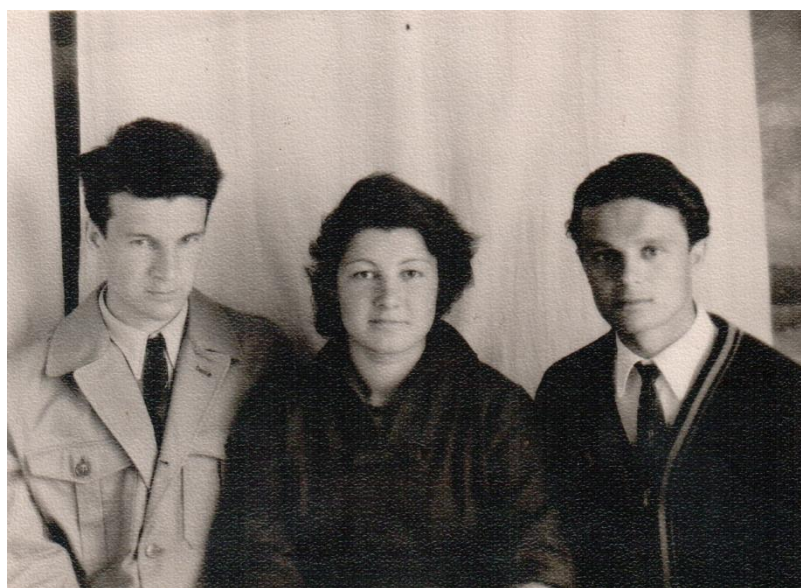
Август 1959 года. Алканка. С сестрой и братом