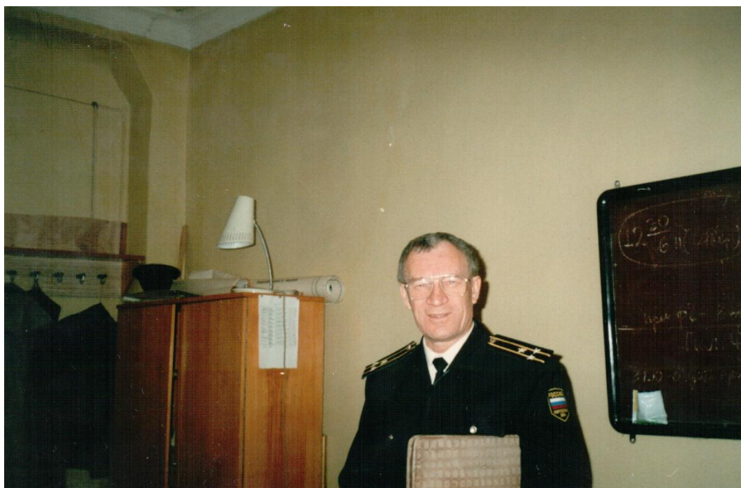
Заведующий кафедрой морской радиолокации и радиофизики, 1996 г