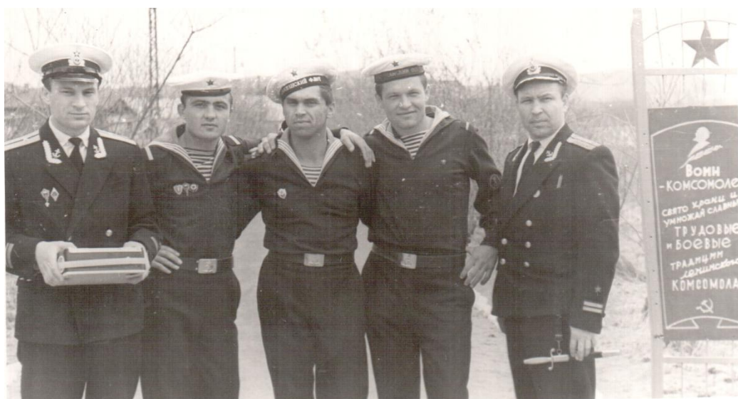
Отличники боевой и политической подготовки, 1965 год