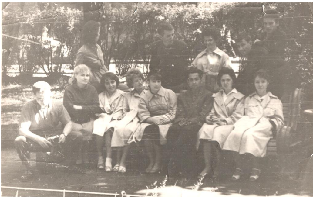
Группа 367 перед дипломным проектированием, 1962 год, садик напротив факультета (пр. М. Горького,5)