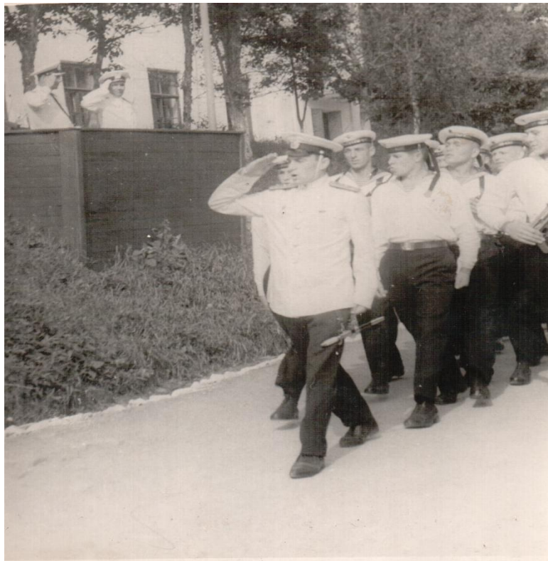
Прохождение торжественным маршем в день ВМФ, 1966 год