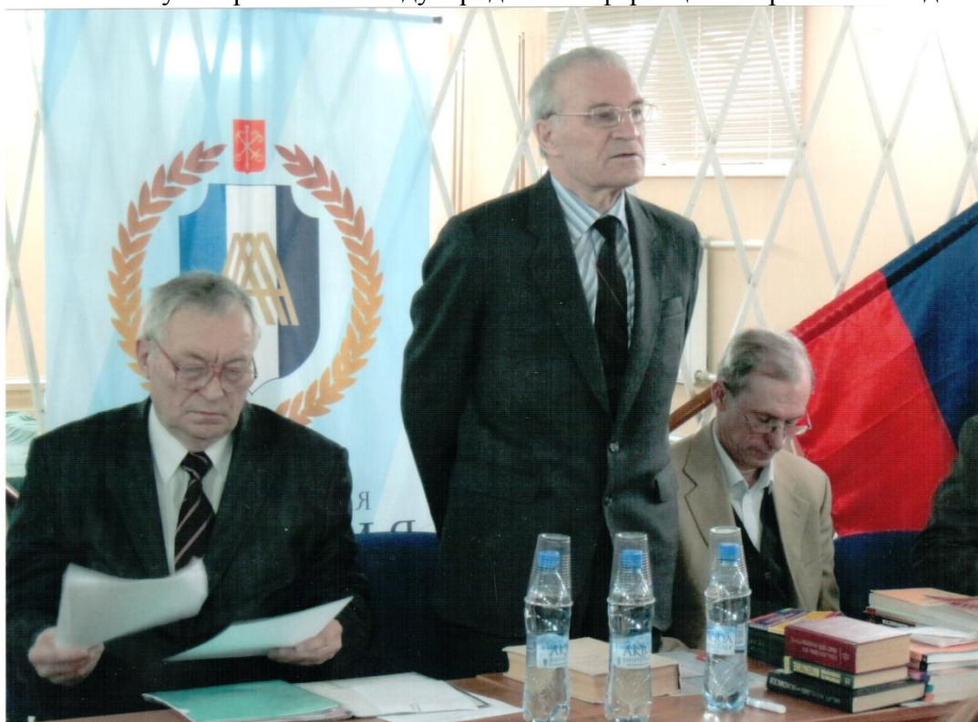
Открытие 5-й Межрегиональной Олимпиады «Математика в управлении». База отдыха Академии, 5 апреля 2010 года