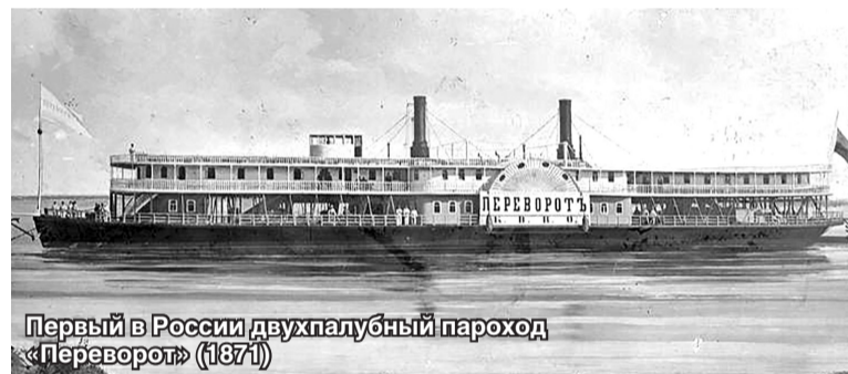
Первый в России двухпалубный пароход «Переворот» (1871)

был переименован в «Добрыню Никитича», а «Великая княжна Ольга Николаевна» – в «Алёшу Поповича». Недолго дворцы-пароходы носили имена былинных русских богатырей. Вскоре они сменили названия на более революционные – «Спартак» и «Володарский». «Спартак» – один из самых знаменитых российских речных судов. Являлся одним из волжских