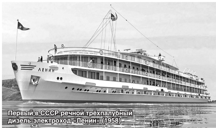
Первый в СССР речной трёхпалубный дизель-электроход «Ленин» (1958)

вые в мире – освоил строительство теплоходов. А в 1934 году был построен уникальный служебный «правительственный» теплоход «Максим Горький» (первоначально «Красный богатырь»), намного опередивший время своими тактико-техническими качествами и прекрасной отделкой. Он создан по проекту военно-технического отдела ОПТУ НКВД как судно специального назначения (личный теплоход И.В. Сталина). Длина теплохода составляла 68,8 метров, проектная скорость 30 км/час.