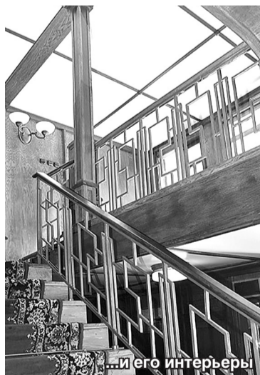
...и его интерьеры

В 1937 году завод «Красное Сормово» построил для канала «Москва – Волга» четыре первоклассных пассажирских теплохода: «Иосиф Сталин», «Клим Ворошилов», «Михаил Калинин», «Вячеслав Молотов». Их проектирование и постройка – крупное достижение сормовских судостроителей. Это был первый в стране опыт сварных судов больших мощностей. Помещения были отделаны шпоном ценных пород дерева, мебель изготовлена из ореха. На теплоходе действовали отделенные связи, сберкасса, телефонная связь, музыкальный салон, киноустановка. Суда были рассчитаны на 205 пассажиров. Эти красивые, необычные теплоходы стали одним из символов канала имени Москвы. По дизайну они выглядели для тех времен довольно современно и даже футуристически. Герои довоенного фильма «Волга-Волга» с Любовью Орловой в главной роли плывут по каналу до Москвы на теплоходе «Иосиф Сталин».