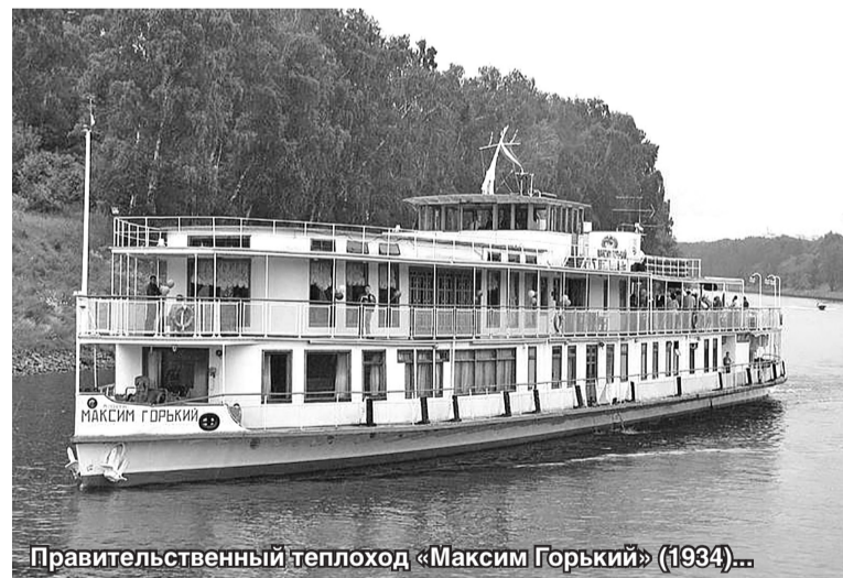
Правительственный теплоход «Максим Горький» (1934)...

В архиве музея истории завода «Красное Сормово» сохранилась копия акта от 4 июня 1899 года о «срочном пассажирском первом рейсе» парохода «Императрица» (построен в 1899 году по заказу пароходного общества «По Волге») по маршруту Нижний Новгород – Астрахань. В акте, подписанном представителем от Сормовского завода инженером-механиком И.Ф. Наумовым и ревизором-шпионером дальнего плавания А.А. Соколовым, в частности, сказано: «Пароход «Царица»... приняв груза 1850 пуд. нефтяных остатков для топлива... и пассажиров 130 человек отошёл от Нижнего Новгорода 22 мая... Во время пути машина работала плавно, без нагрева