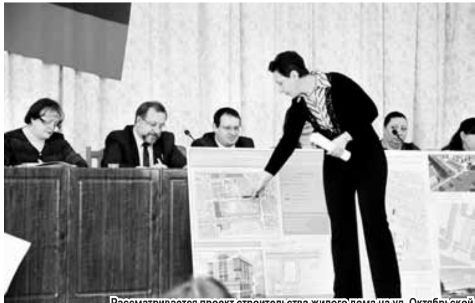
Рассматривается проект строительства жилого дома на ул. Октябрьской.

В О ВРЕМЯ публичных слушаний рассмотрены обращения граждан и предприятий по изменению вида разрешенного использования ряда территорий. Так, было заявлено о возведении на ул. П. Тольятти/Пионерс-