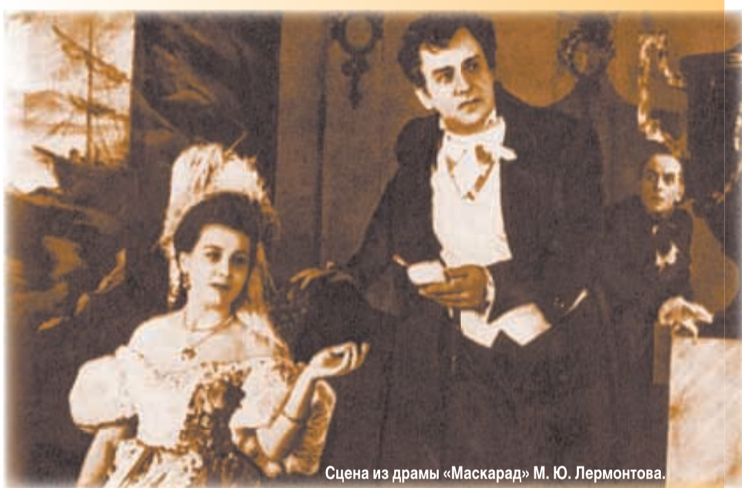
Сцена из драмы «Маскарад» М. Ю. Лермонтова.

В Москве, пройдя огромный конкурс, был зачислен в Центральный техникум театрального искусства. Но проучился он там недолго. Уже в конце учебного года его отчислили с формулировкой «по профнепригодности». Такой удар может вынести не каждый. Но Мордвинов не сдался. В том же 1925 году он поступил в студию под руководством Ю. А. Завадского. А позже, когда на основе студии был создан Театр, молодой актер вошел в его труппу. В 1930 году Мордвинов был избран членом