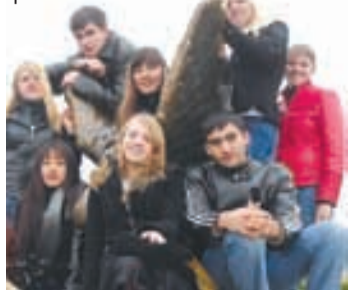
Полосу подготовила Дарья КОРБА.

Чтобы показать безграничные возможности невербальных средств, студенты первого курса Пятигорской фармацевтической академии организовали так называемое «Шоу русских сказок». Основным условием было разыграть сюжет сказки, не используя слов. Задача зрителей же заключалась в том, чтобы угадать ее название. Ребята сами готовили реквизит и костюмы, долго репетировали. В итоге получилось яркое и зажигательное представление. Конечно, все сказки были раскритикованы с первого раза.