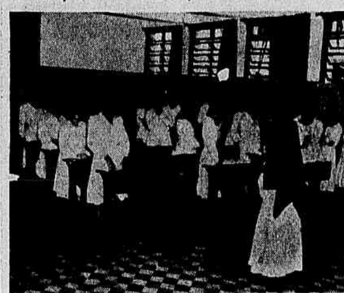
As sentenciadas, durante uma aula, quando cantavam o Hino Penitenciário. A aproximação do fotógrafo, tiveram todas um gesto de defesa, virando as costas ou cobrindo o rosto com as mãos

Na Penitenciária de Mulheres o reporter pôde ver de perto a obra extraordinária de recuperação das criminosas — Um instituto penitenciário que enaltece a cultura jurídica do Brasil