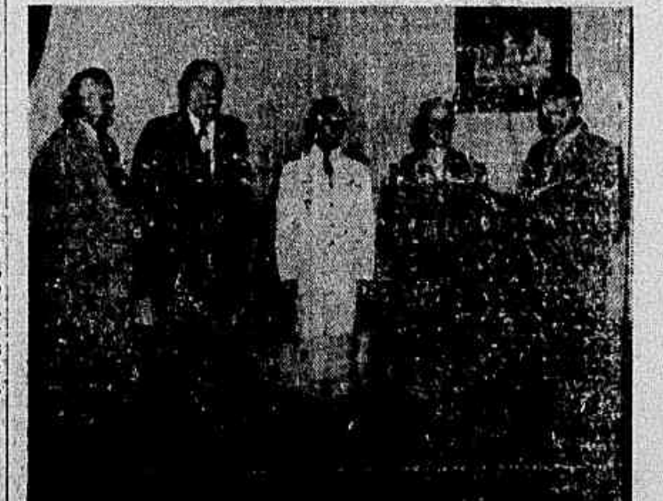
Aspecto colhido durante a solenidade de posse do novo sub-chefe do Gabinete Militar da Presidência da Republica, no Palácio Rio Negro, em Petrópolis