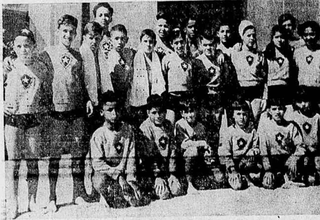
A equipe do Botafogo, que concorrerá ao Campeonato Infanto-Juvenil

Em desfile a nova geração aquática Na piscina do Fluminense, as eliminatórias do Campeonato Infanto-Juvenil — Icarai, o favorito — Poderá surpreender, o Fluminense — Programa organizado para o certame aquático de amanhã