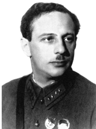
Армейский комиссар Б. М. Иппо — начальник Военно-политической академии в 1933–1937 гг.

В Военно-политической академии имени Н. Г. Толмачёва в 1936 г. были арестованы 14 преподавателей, в 1937–1938 гг. — 12 человек из управления вуза (в том числе начальник академии, его заместитель и 4 начальника отделов), 40 человек из профессорско-преподавательского состава (10 начальников кафедр, 2 руководителя цикла, 17 руководителей,