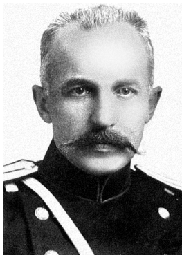
А. Е. Снесарев

Кубанской армией и вместе с ее остатками сдался Советскому командованию. Преподавал в военных учебных заведениях Ленинграда. По делу «Весна» Н. А. Морозова приговорили к 5 годам исправительно-трудовых работ 8 . Генерал-лейтенант старой армии Андрей Евгеньевич Снесарев был человеком исключительно разносторонних дарований. Крупный знаток военной географии, блестящий педагог, он владел 14 языками. В 1928 г. за многолетнюю и плодотворную деятельность по строительству Вооруженных сил А. Е. Снесарев первым из советских военачальников удостоился звания Героя Труда 9 . А спустя каких-то два года его обвинили в контрреволюционной деятельности и приговорили к высшей мере наказания. По указанию И. В. Сталина расстрел заменили десятью годами исправительно-трудовых лагерей. Тя-