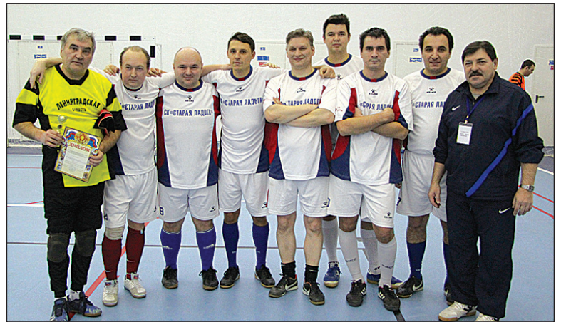
Команда Администрации Ленинградской области.