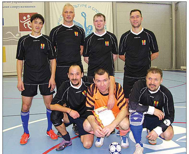
Победитель турнира – команда Петергофа.