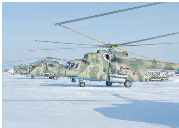
Вертолёты — одно из эффективных боевых средств современной армии.

Помимо мероприятий боевой подготовки, в ходе которых происходило сжигание экипажей, авиационных зенитов и в целом эскадрильи, тувинским военным лётчикам довелось выполнять немало и других задач. Так, в августе месяце они привлекались к транс-