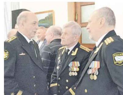
Морякам-подводникам есть что вспомнить.

Ныне соединение входит в состав Краснознамённых подводных сил Северного флота.