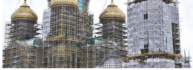
Освящение Патриаршего собора Русской православной церкви во имя Воскресения Христова — Храма Победы — запланировано на 7 мая.

...Надо отметить, что в ходе всех выступлений был сделан упор на необходимость международной консолидации в деле сохранения общечеловеческих духовных ценностей, важнейшей из которых является память о войнах страны, победившей фашизм. Также прозвучали предложения по организации и проведению совместных мероприятий российских и международных ветеранских организаций, приуроченных к 75-й годовщине Победы в Великой Отечественной войне, цель которых — сохранение памяти о всенародном подвиге и увековечение миллионов фронтовиков, спасших мир от «коричневой чумы».