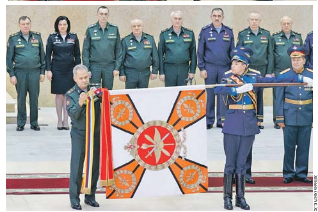
сто, отвагу и самоотверженность, проявленные при исполнении воинского долга, заслуги в укреплении обороноспособности страны и высокие личные по-

казатели в служебной деятельности очередных воинских званий, орденов и медалей удостоились более 80 генералов и старших офицеров.