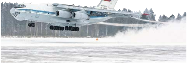
Ил-76 — настоящий труженик военно-транспортной авиации.