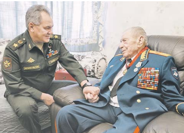
ФОТО АКАДЕМИКА С.А. ВАСИЛЬЕВА