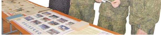
Занятия с редакторами стенной печати.

Как раз именно сейчас идёт серьёзная внутренняя работа с личным составом по плану учений месячника сплочения воинских коллективов, которая должна послужить своего рода залогом для полноценного функционирования