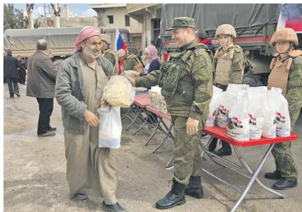
Военнослужащие Российского ЦПВС проводят гуманитарную акцию в пригороде Алеппо.

На днях по трассе М5, имеющей для сирийской экономики важное