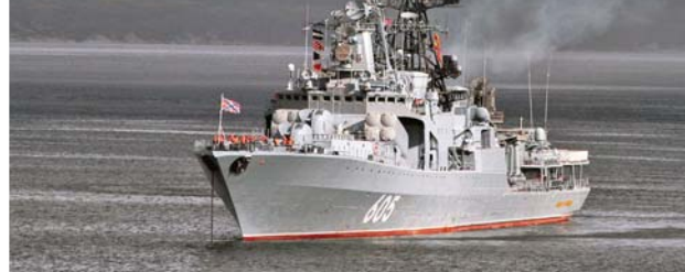
На рейде боевое дежурство продолжается.

К сдаче курсовой задачи будут запланированы специальные тренировки боевой части. Моряки выполнят задачи по ведению противовоздушной обороны в пункте базирования и применению вооружения корабля в бою — всё, как на практическом учении, только пуски будут условными