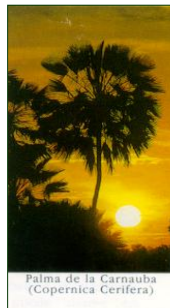
Palma de la Carnauba (Copernicia Cerifera)

La cera de la hoja de la palma de la carnauba (carnaubeira) es por mucho la cera vegetal más importante tanto desde el punto de vista económico como por sus aplicaciones.