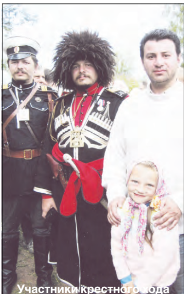
Участники крестного хода