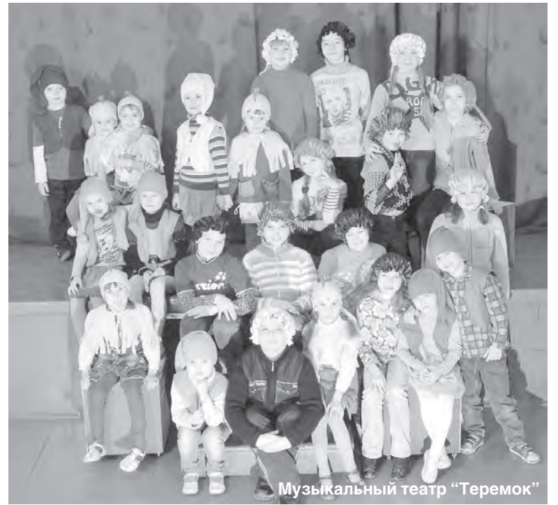
Музыкальный театр "Теремок"