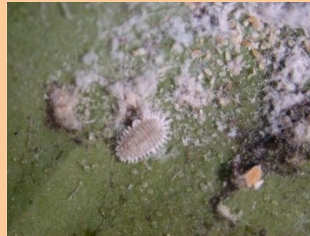
- Cochinillas ( Planococcus citri )