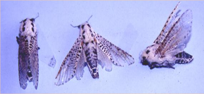
- Barrenador madera ( Zeuzera pyrina )