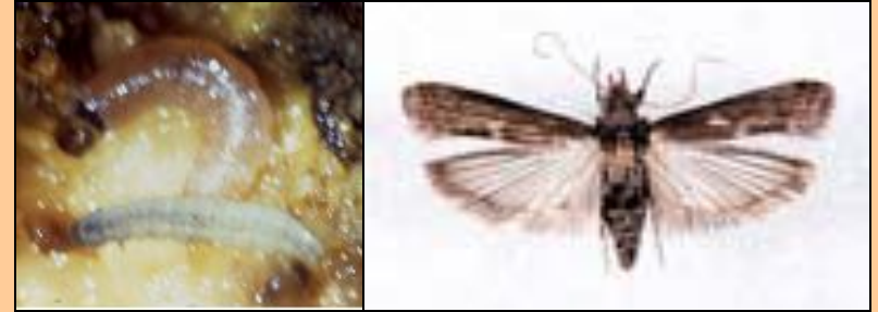
-Barrenetas ( Criptoblades y Ectomyelois )