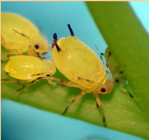
- Pulgones ( Aphis sp,....)