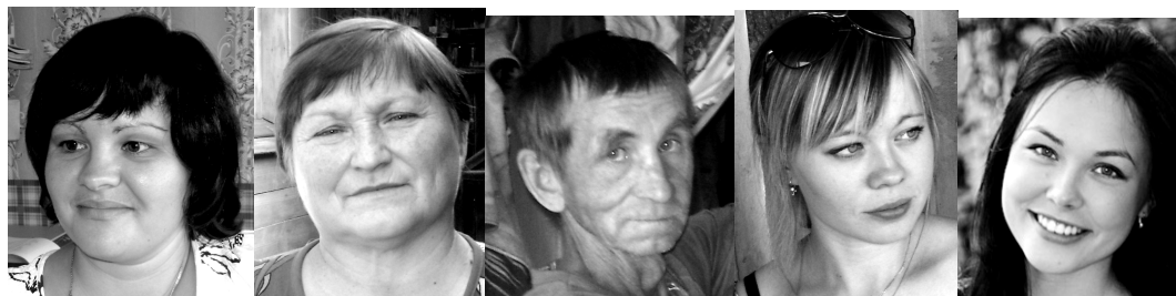
Рис. 5. Современные коми-пермяки

Таким образом, авто- и гетеростереотипы коми-пермяков и русских относительно внешности коми-пермяков одинаково ориентированы на европеоидный антропотип (ядро стереотипа), в то же время отмечаются черты сублапоноидного волго-камского типа (периферия стереотипа).