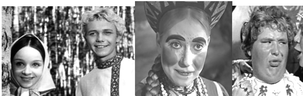
Рис. 11. Персонажи сказок А. Роя (слева направо): Вася и Аленушка («Огонь вода и медные трубы»), Марфушенька-душенька («Морозко»), Андрей-царский сын («Варвара-краса, длинная коса»)

Среди прототипных образов красоты в русском языке выделяются растения («гастрономическая метафора»: как малина, как репка ) и животные ( как серна ), божества ( как Афродита, как Аполлон ), фольклорные персонажи ( как [Царевна] лебедь, как [Добрый] молодец, Иван-царевич, ясный сокол ) [Окунева 2008]. Традиционные автостереотипы русских ярко визуализированы в сказках А.Роя (рис. 11).