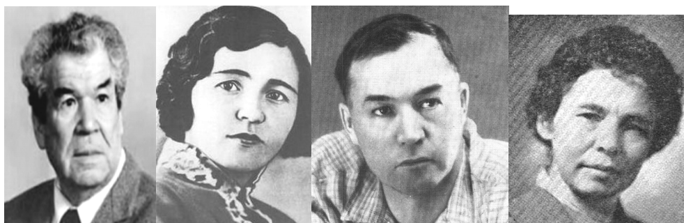
Рис. 6. «Советские» башкиры (слева направо): поэт М.Карим, писатели Х. Давлетшина, А.Бикчентаев, Ф. Рахимгулова

(47,5%), типичный монголоид (25% респондентов). Периферийные признаки: часто не отличить от славян (7,5% респондентов). Незначимые характеристики: наипрекраснейший , густые брови , ярко выраженные скулы , лицо с широкими скулами , маленького роста , невысокий ; разнообразный (европеоиды, есть и монголоиды) , средний разрез глаз .