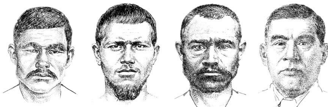
Рис. 9. Антропологические типы башкир [по: Зинин, Винниченко 1979]

На антропологический тип башкирского этноса в эпоху его становления значительное воздействие оказали смешение и этническая интеграция с булгаро-мадьярскими и финно-угорскими племенами Приуралья и бельской долины [Кузеев 1974]. На основании анализа ДНК в 7 субпопуляциях башкир установлено, что в этногенезе башкир принимали участие европейские, южно-сибирские и центрально-азиатские популяции [Лобов 2009].