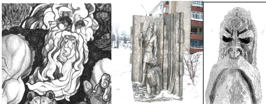
Рис. 1. Кудым-Ош (слева направо): картина В.Онькова, памятник в г.Кудымкаре, скульптура В. Онькова

Художественное воплощение этих образов также отражает этнические автостереотипы внешности (рис. 1–2), в котором актуализированы в основном европеоидный и – реже – монголоидный типы. Общая черта внешности – чрезвычайно густой волосяной покров (огромная борода у европеоидов, густые брови и волосы у монголоида). Европеоиды – чаще блондины с мощным телом.