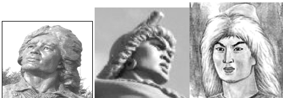
Рис. 8. Салават Юлаев (слева направо): бюст скульптора Т.П. Нечаева, памятник С.Тавасиева в Уфе, иллюстрация к эпосу

воплощении национального башкирского героя Салавата Юлаева (рис. 8).