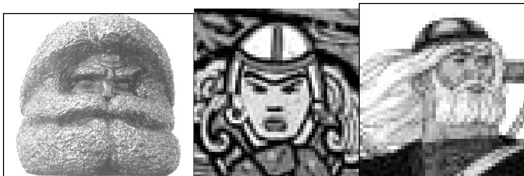
Рис. 2. Перя-богатырь (слева направо): скульптура В. Онькова, иллюстрации В.Г. Игнатова к эпосу, обложка к сборнику финно-угорских сказок «Перя-богатырь» (1984) А.В. Мошева

Мифологические и художественные автостереотипы совпадают с нашими данными в признаках большой, могучий, сильный, крепкий (15,6% респондентов), красивый, симпатичный, статный (12,5%), чаще блондин или рыжий (9,4% респондентов); не совпадают по признакам необычайно высокий и волосатый .