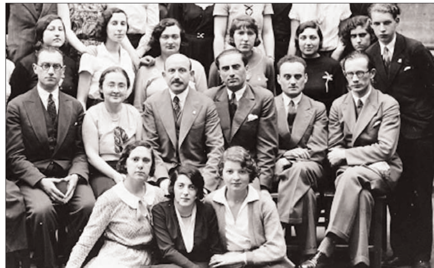
Учителя и ученики рижской школы «Эзра». 1930-е годы

Внимательно просмотрим архивное дело, в котором сохранились уставы частных еврейских школ за 1926—1933 гг. 48 В них указан язык преподавания в различных школах. Так в школе общества «Тора-вдэрех-эрец» (председатель обще-