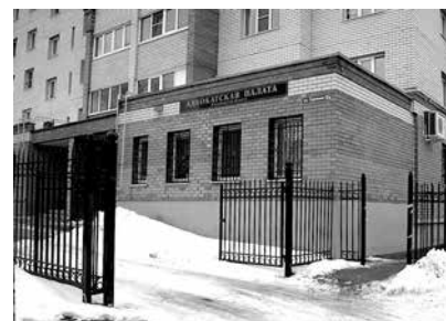
Издание Адвокатской палаты Владимирской области

Адвокатская палата Владимирской области 600028, город Владимир, ул. Сурикова, д. 10 «А» Телефон/факс (4922) 52-64-89 Сайт: arvo.fparf.ru E-mail: advokat.palata@mail.ru