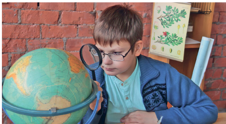
География – это всегда интересно!

Наталья ПАРАХНЕВИЧ