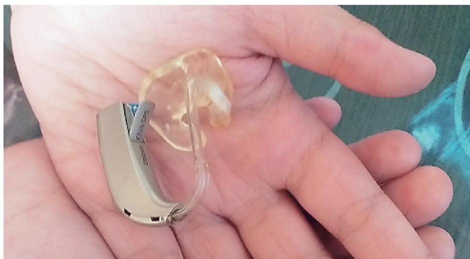
«Ушко» на ладошке