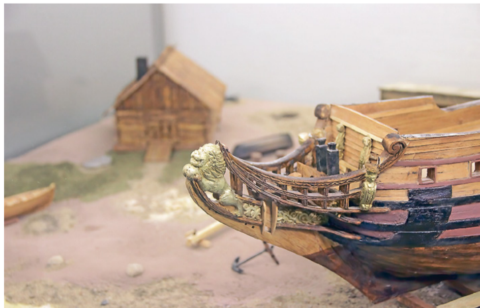
Диорама «Соломбальская верфь XVIII века»