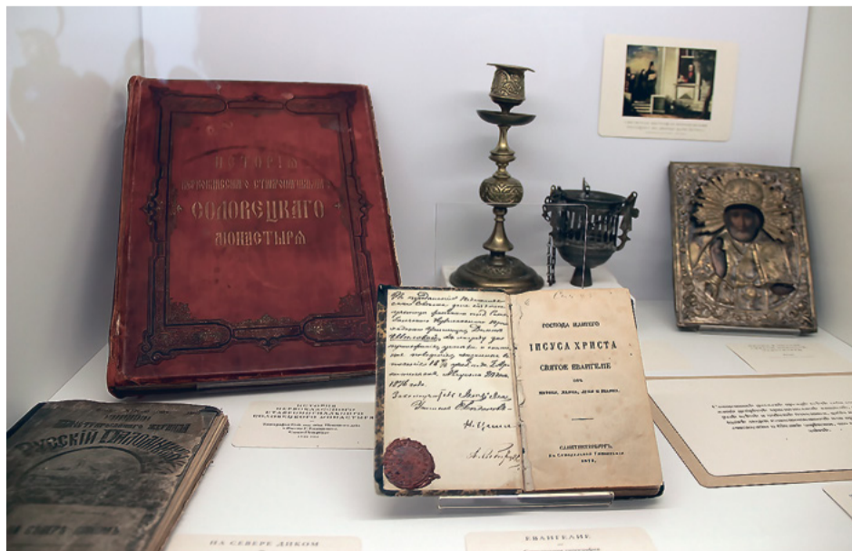
«В море неверующих нет»