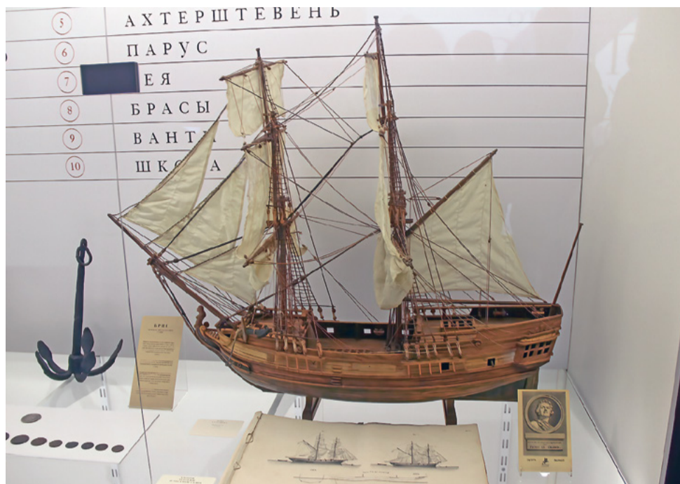
Модель брига XVIII века

На выставке затронуты темы из Устава, которые довольно редко упоминаются – о духовных узах флота и православной церкви. Например, появление в российском флоте Андреевского флага тоже имеет религиозный оттенок. Есть и другие, не менее интересные, музейные иллюстрации к Морскому уставу Петра Первого.