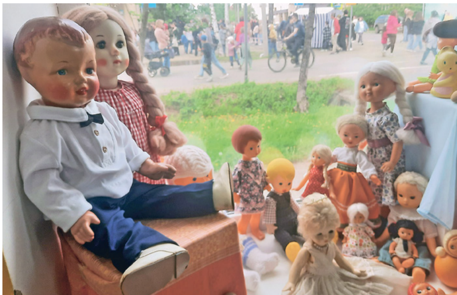
Эти две большие куклы – только для избранных

Но не такой Котлас! Он предпочёл именно ту дату, когда стал городом. Вроде как уже чего-то достиг. И во время празднования своего 105-летия он мог вспомнить всё, что с ним произошло за это время. Вон даже куклы, которыми играли дети ответственных работников, до сих пор как новые. Так ведь аккуратно играли и не давали кому не положено!