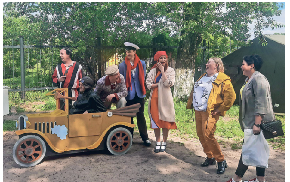
Корейко, Шура Балаганов и Остап Бендер нашли общий язык с котлашанами