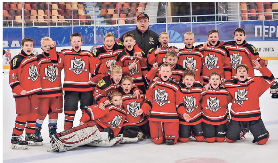
«Белые волки» сразу после победы в Перми.