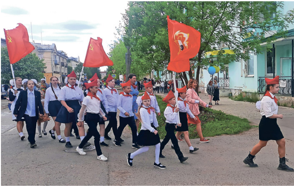
Кто шагает дружно в ряд?