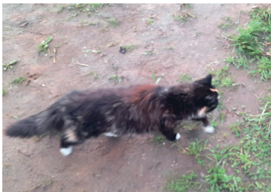
Кошка Удача обрела чудесное спасение на ферме Ананьиных и теперь работает здесь талисманом