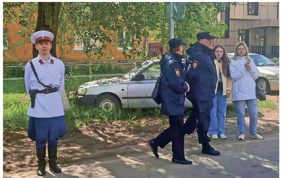
Встретились стражи порядка из разных времён