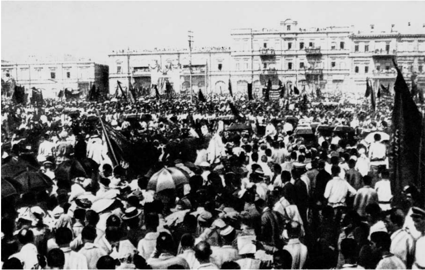
Рис. 7. Перенесение останков 26 Бакинских комиссаров. Баку, сентябрь 1920 года