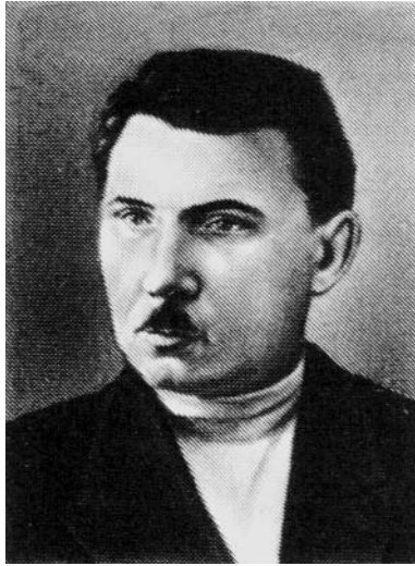
Рис. 4. Шеболдаев Борис Петрович (1895–1937), большевик, заместитель наркома по военным и морским делам Бакинского Совета Народных Комиссаров