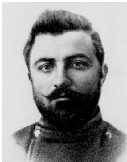
Рис. 5. Джапаридзе Прокофий Апрасинович (Алеша) (1880–1918), большевик, председатель исполкома Бакинского совета, с апреля 1918 года — комиссар внутренних дел и комиссар продовольствия в Бакинском Совете Народных Комиссаров

командованием полковника Ильяшевича. Это была достаточно мощная сила — до 10 тыс. человек при 20 орудиях, 50 пулеметах, нескольких бронемашинах и даже со своей эскадрильей гидропланов 32 . Правда, как и другие части бывшей русской армии, он был в немалой степени затронут «митингами и сумлениями» солдат 33 . Тем не менее он оставался вполне еще боеспособным и казался очень привлекательным для бакинских большевиков. Первоначально они оказали «муганцам» немалую помощь оружием и боеприпасами. К пограничникам приезжал один из руководителей коммуны Алеша Джапаридзе (рис. 5), который своей образованностью и манерами даже на чрезвычайно скептически настроенного к большевикам офицера В. А. Добрынина произвел впечатление человека «неглупого, самостоятельного и даже культурного». К «муганцам» Джапаридзе, имевший у большевиков репутацию «товарища несколько оппортунистического характера» 34 , обращался «господа офицеры» и не возражал против ношения ими погон 35 . Только географическая удаленность Мугани от Баку и разразившийся вскоре кризис ком-