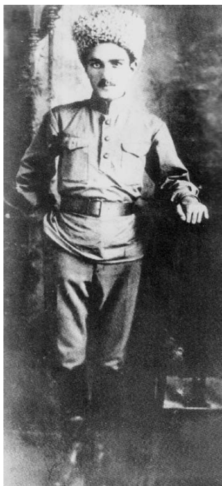
Рис. 2. Микоян Анастас Иванович (1895–1978), большевик, летом 1918 года — комиссар 3-й бригады Кавказской Красной армии

Требовались объяснения, и лишь спустя две недели их в довольно путаной форме дал Шаумян. По его мнению, на «кавказской почве» гражданская война не исключала межнациональных столкновений. В письме в СНК от 13 апреля 1918 года он доносил, что участие в боях армянских национальных частей «придало отчасти гражданской войне характер национальной резни, но избежать этого не было возможности. Мы сознательно шли на это » (выделено мной. — А. Б.). Далее следовал лукавый словесный ход, призванный примирить классовую борьбу с национальным геноцидом: «Мусульманская беднота сильно пострадала, но она сейчас сплачивается вокруг большевиков и вокруг Совета» 16 . Столь же неуклюжую попытку развести национальную и классовую борьбу предпринял А. И. Микоян (рис. 2), один из руководителей военных отрядов Баксовета. В частном письме он отмечал 17 :