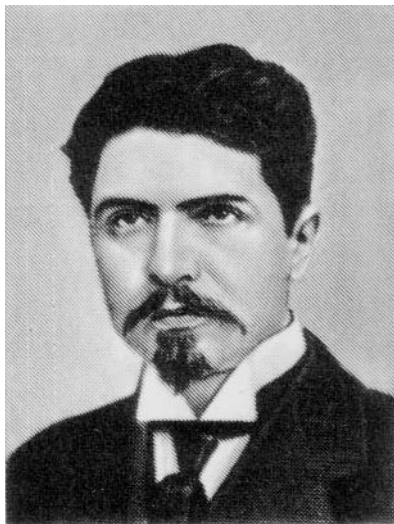
Рис. 1. Шаумян Степан Георгиевич (1918–1978), большевик, чрезвычайный комиссар СНК РСФСР по делам Кавказа, с апреля 1918 года — председатель Бакинского Совета Народных Комиссаров и комиссар по внешним делам

делам Кавказа. Между тем армяне значительно уступали по численности азербайджанскому населению: на 1 января 1916 года в Баку проживали 75 тыс. армян и 183 тыс. азербайджанцев, в Бакинской губернии их было соответственно 42 тыс. и 691 тыс. 3 Налицо диспропорционально большое представительство армян в новых органах власти сравнительно с их долей во всем населении. В условиях уже существовавшей армяно-азербайджанской напряженности подобный дисбаланс был по существу губительным.