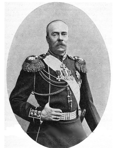
Попечитель Училища правоведения Принц Александр Петрович Ольденбургский. Фото 1915 г.

Среди его выпускников много выдающихся юристов и государственных деятелей, сыгравших важную роль в