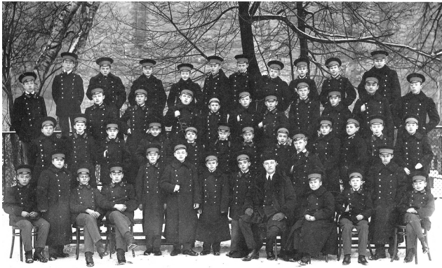
Воспитанники подготовительного класса Императорского училища правоведения. 1913 год.