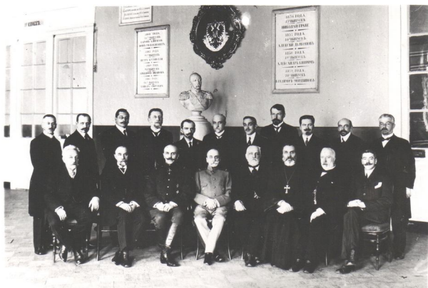
Учителя Училища правоведения.

год, а в 1890-х гг. – 700 рублей. Полный курс обучения составлял 6 лет: два класса начальных (пятый и шестой) и четыре класса окончательных (четвертый, третий, второй и первый). В 1847 г. из-за недостаточной подготовки поступающих в Училище были учреждены подготовительные классы, для устройства которых за 50 тысяч рублей куплен двухэтажный каменный дом на Сергиевской ул. 12. Подготовительные классы были сначала двухгодичными, а позднее – трехгодичными. В них принимались дети с 8 лет. В итоге курс обучения, который шел по двум направлениям – общеобразовательному и практическому, – составил 10 лет.