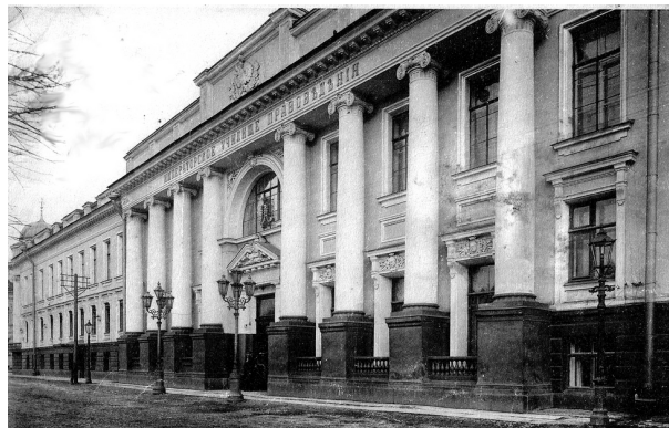
Здание Императорского училища правоождения, наб. р. Фонтанка д. 6. Фото конца XIX в.