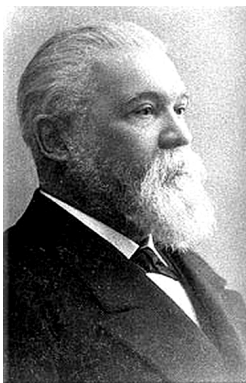
Николай Степанович Таганцев (1843–1923), юрист, криминалист, государственный деятель