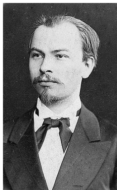
Федор Федорович Мартенс (Friedrich Fromhold Martens, 1845–1909), юрист-международник, дипломат