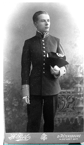
Воспитанник Императорского училища правоождения. СПб, Архив кинофото документов