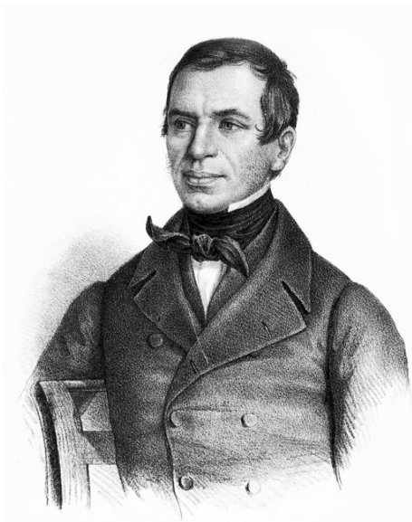
М. П. Погодин. Литография. Худ. Ф. Шир, 1846 г.

Михаил Петрович Погодин (1800–1875), консерватор, сторонник русской самобытности, стремившийся привить студентам любовь к отечественным древностям, возглавлял кафедру российской истории в Московском университете (1835–1844). В ходе длительного исследования древнерусских летописей Погодин пришел к пониманию коренного отличия русской и западноевропейской историй, а также особого характера отечественной истории, изложив свои тезисы во вводной лекции «Взгляд на русскую историю», прозвучавшей 8 сентября 1832 г. в присутствии тогда еще товарища министра народного просвещения С. С. Уварова. Речь произвела на Уварова сильное впечатление, и повлияла на его понимание триады и русской народности. В частности, по мысли Погодина, история должна стать «охранительницей