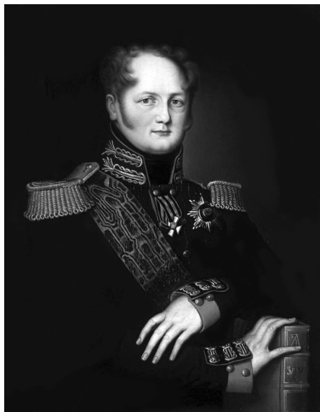
Портрет императора Александра I. Неизвестный художник, начало XIX в.

Но, как опытный политик и глубокий консервативный мыслитель, он видел и слабые стороны монарха. В неопубликованном трактате 1831 г. «Этюды об императоре Александре» Уваров критикует слепую приверженность государя абстрактным европейским теориям, «нескольким абсолютным формулам, не допускающим никаких изменений»: «Все прекрасные качества души Александра — гуманность, чувствительность, храбрость, живой ум — теряли много от того, что у него не было одного — русской фибры» 78 .