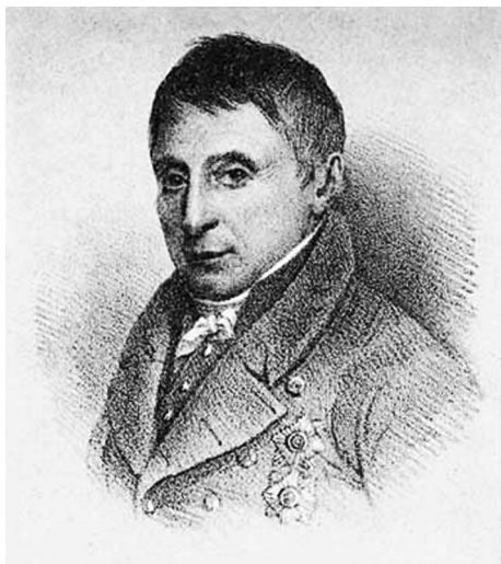
Портрет А. Н. Оленина. Фотогипия с литографии. А. Зенефельдер с рисунка Антонена, 1825 г.

отдававшего предпочтение классицизму XVIII в. Неоклассицизм, сочетавший ориентацию на классический идеал античного искусства и поиск канона русского искусства, значительно повлиял на формирование у Уварова национально ориентированного мировоззрения, нашедшего законченное выражение в концепции триады.