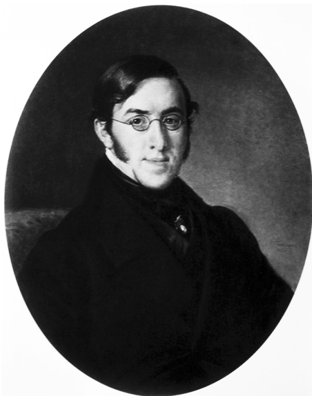
Портрет Н. Г. Устрялова. Худ. В. Тропинин, 1850 г.

По данному вопросу, как и по многим другим, Уваров занимал компромиссную позицию. Разумеется, он никогда не был гонителем философии, как некоторые его предшественники в Министерстве народного просвещения. Еще в 1826 г. в Комитете устройства учебных заведений он выступил против