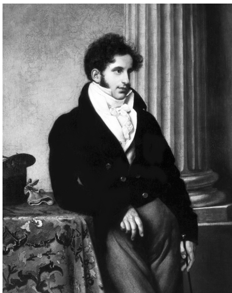
Портрет С. С. Уварова. Худ. О. Кипренский, 1815 г.

языках, что являлось нормой для высшего сословия того времени. Но необычным для его эпохи и круга общения было постоянное стремление к самообразованию, сохранявшееся в нем до последних дней 21 .