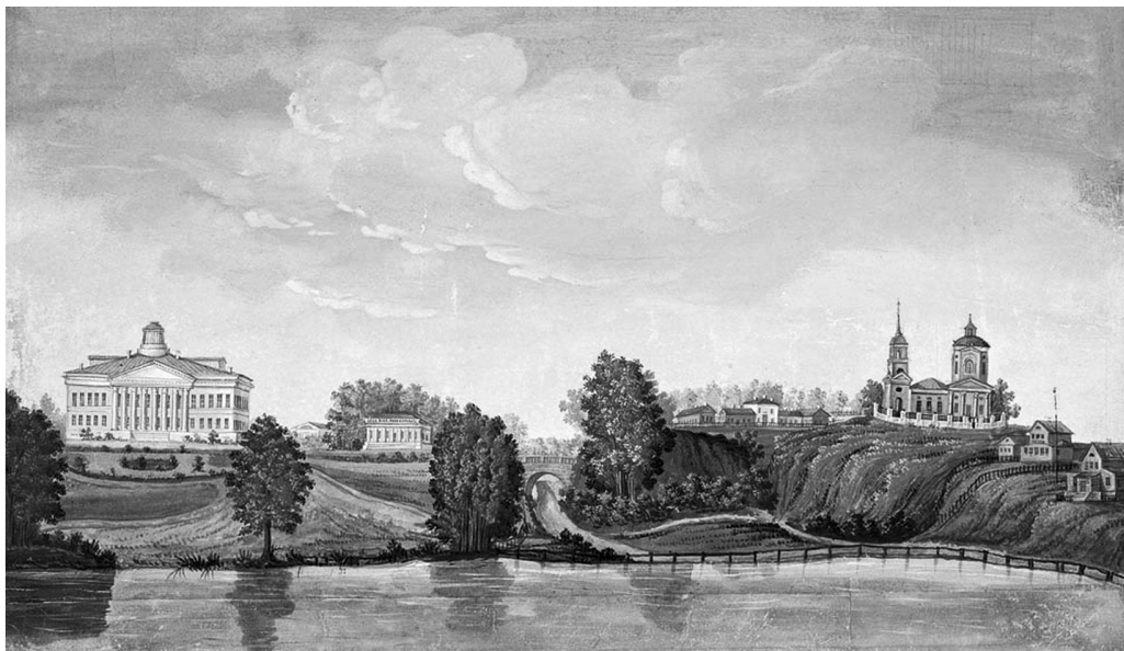
Усадьба «Поречье». Неизвестный художник, первая четверть XIX в.

избранным обществом лучших отечественных ученых. Приглашаемые профессора знакомили Сергея Семеновича и его гостей со своими открытиями и работками, обсуждали самые разные научные, литературные и художественные проблемы, и сам хозяин щедро делился собственными широкими познаниями и любовью к прекрасному, подавал интересные темы для возвышенного общения: «Современные явления ума, воспоминания ученые и литературные впечатления Италии, неизгладимые в памяти хозяина, сношения его с учеными знаменитостями Германии и Франции предлагали неистощимое содержание для бесед, далеких от житейских мелочей» 190 . Благодаря дружеской, непринужденной и, вместе с тем, творческой атмосфере, господствовавшей в Поречье, где «время проходило в живом сообщении мыслей о науках, словесности, искусствах», это небольшое имение заслужило прозвище «русских Афин» 191 .