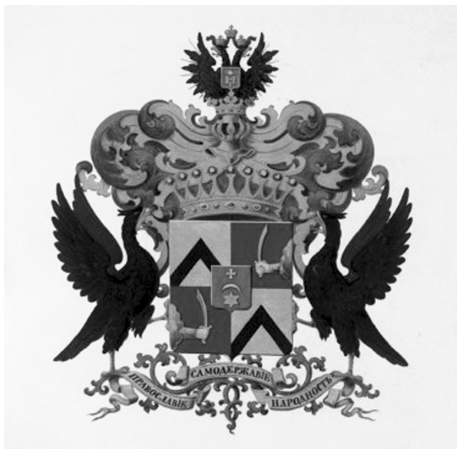
Герб графа Уварова

Император высоко оценил многолетнюю работу сановника в министерстве, в 1844 г. пожаловав ему орден св. Александра Невского, а в 1846 г. «во изъявление особенной признательности к неусыпным трудам его на поприще государственной службы» — графский титул 182 . Девизом, высеченном по желанию Уварова на гербе нового графского рода, стала триада «Православие. Самодержавие. Народность». Титулованный дворянин граф Уваров удостоился также высшей награды в России — ордена св. Андрея Первозванного, пожалованного ему в 1850 г.