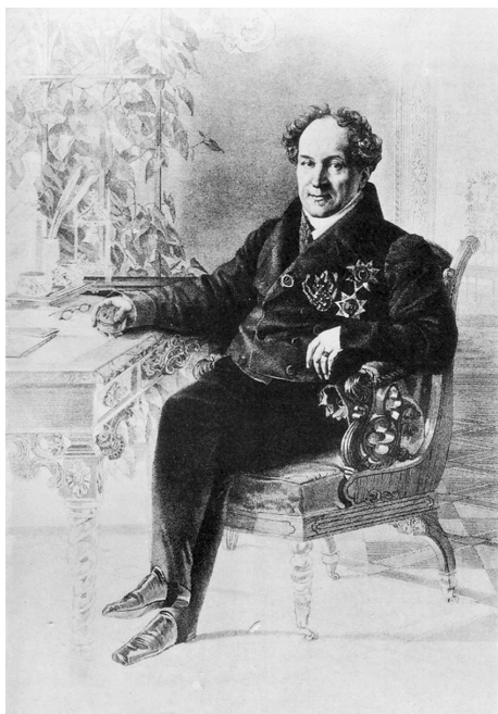
Князь А. Н. Голицын. Гравюра Т. Райта с портрета К. Брюллова, между 1840 и 1844 г.

розенкрейцерства. Знакомясь с западной мистической литературой, князь «начал постигать, что в многообразии мира наружного скрывается еще более многообразный мир внутренний» 63 , и принял теорию т. н. «внешней и внутренней Церкви», согласно которой двум человеческим природам — внешней и внутренней — соответствуют две Церкви: внешняя, т. е. формальная религиозная организация, и внутренняя — мистический союз во Христе 64 . Следствием увлечения этой теорией у Голицына стало явное предпочтение традиционным христианским Церквам маргинальных религиозных движений и сект, а также убежденный экуменизм и эсхатологизм. После обращения в 1812 г., во время нашествия Наполеона, в свою «мистическую веру» императора Александра он обрел мощные государственные рычаги для воплощения в России излюбленной мистико-космо-