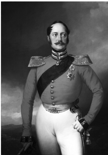
Портрет Николая I. Худ. Ф. Крюгер, 1847 г.

Не меньшие затруднения для Уварова, чем «реакционная партия», в правительстве создавала «либеральная партия», приверженцы идей европейского Просвещения, которые стали прибегать к новым, более ухищренным интригам. Вот как он описывал эту борьбу: «В России, как и во всей Европе, начало века испытало рождение одной политической школы, которая под разными именами подчинялась одной и той же программе. Это были, под различными титулами, люди почти всегда благородного происхождения, которые непоколебимо верили, что великие беды, завещанные XVIII веком XIX-му, могут быть предотвращены несколькими общими формулами, какими-то негибкими абстракциями, применявшимися без различия во всех странах Европы. Эта универсальная панацея не допускала никаких видоизменений и должна была быть навязана без различия от одного конца Европы до другого, невзирая на историю и особенности жизни народов, и, образовав там собой нечто вроде социализма высшей политики, привести в каждой точке земного шара к полному перерождению существовавшие учреждения. <...> Эта школа, повсюду одна и та же, совершила вторжение и в наши дела. Намеревались утвердить силу и величие этой страны, столь мало сходной со всеми другими, на освобождении низших классов, которые не испытывали в этом нужды. Намеревались также