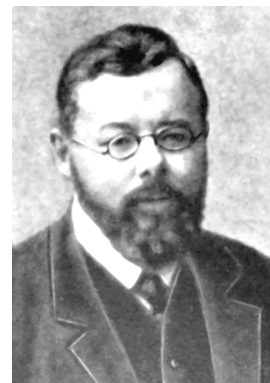
Михаил Иванович Туган-Барановский (1865– 1918), экономист, историк

Как и М.И. Туган-Барановский, Анцыферов не видел в капитализме серьезного препятствия для развития кооперации. Он четко различал понятия кооперативного движения и кооперации как хозяйственного предприятия. По мнению ученого, в процессе развития кооперативного движения формируются нравственные идеалы, создается новый человек, тогда как реальный кооператив вполне укладывается в рамки капиталистического хозяйства, действующего ради экономической выгоды.