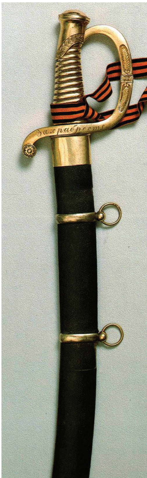
Золотое Георгиевское Оружие „За храбрость“