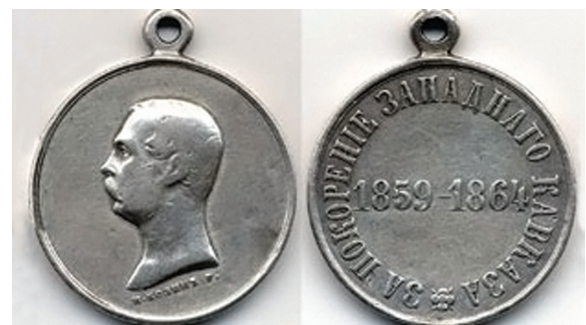
Медаль „За покорение Западного Кавказа“ (серебро)