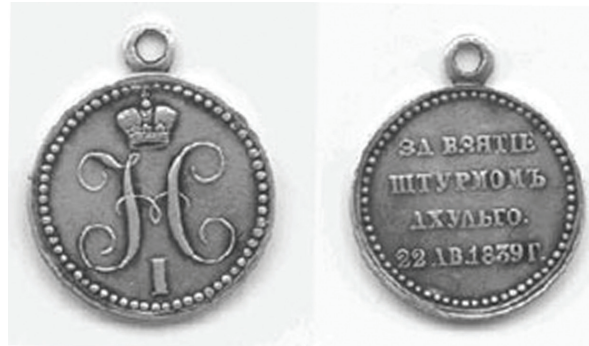
Медаль „За взятие штурмом Ахульго“ (серебро)