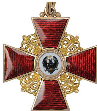
Знак ордена Св. Анны