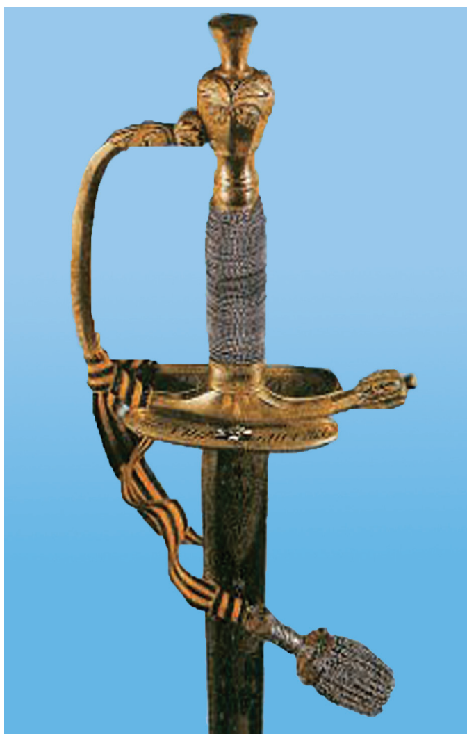
Золотое Георгиевское Оружие „За храбрость“ (шпага с алмазами и надписью „За сражение при Прейсиш-Эйлау“ – 1807 – награда генерала П. Багратиона)