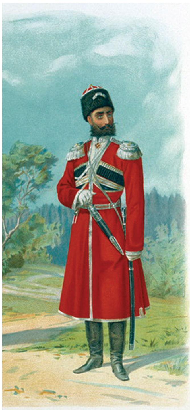
Генерал СЕИВ Кавказского Конвоя