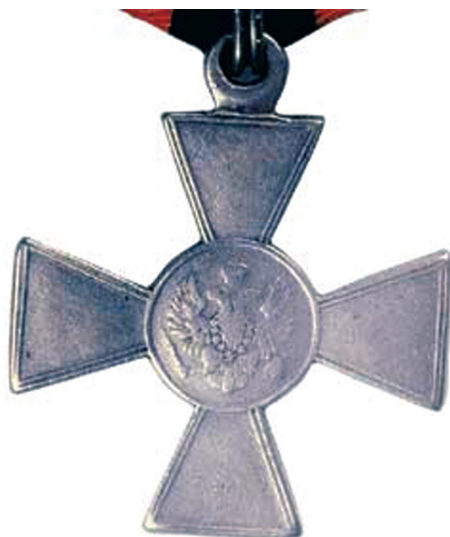
Знак Отличия Военного Ордена