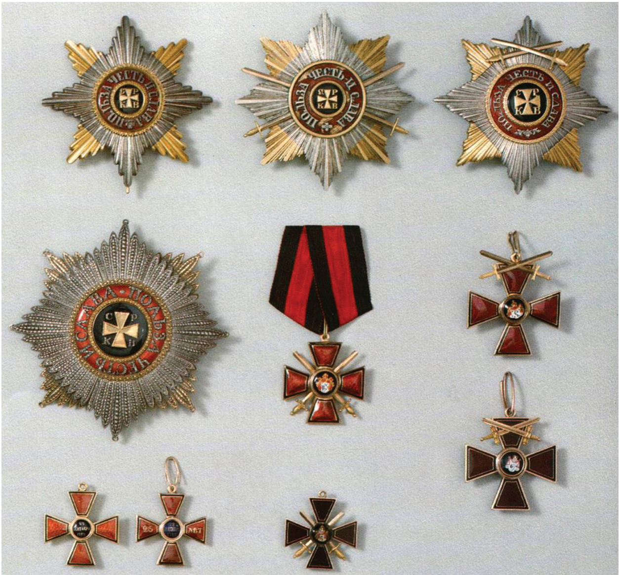
Звезды и знаки ордена Св. Владимира