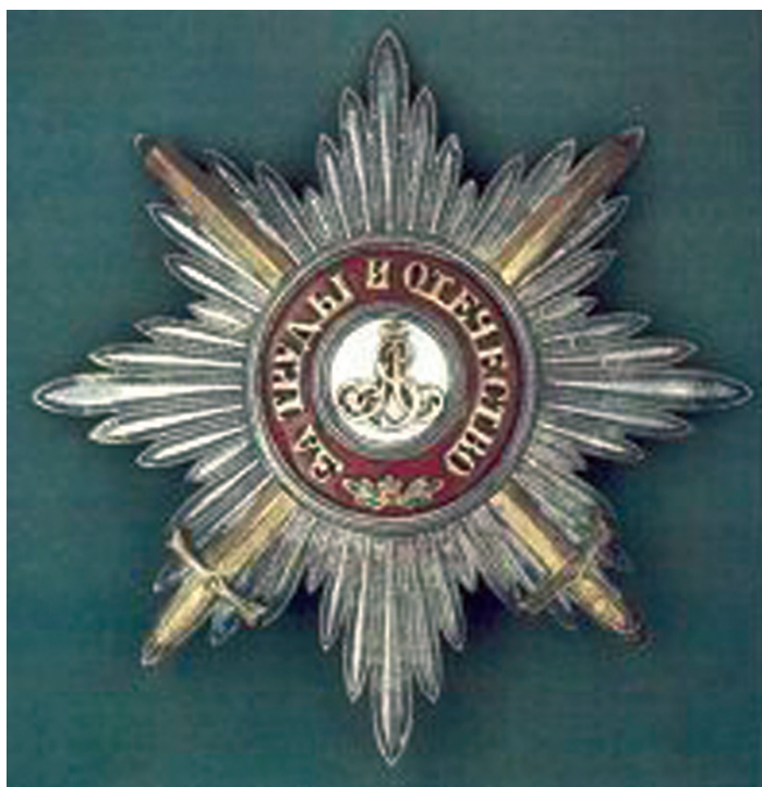
Звезды и знаки ордена Св. Александра Невского