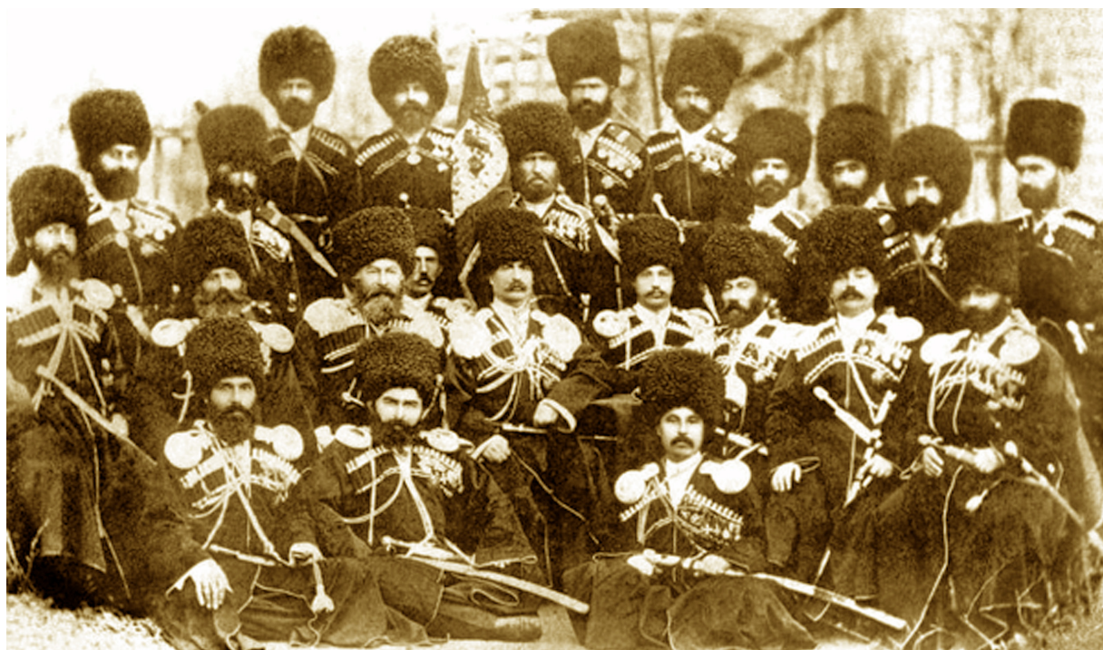
Группа генералов и офицеров кавказцев