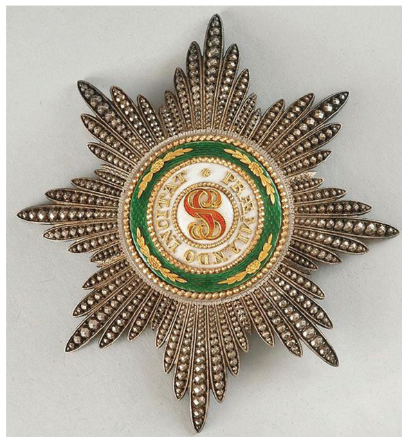
Звезда ордена Св. Станислава