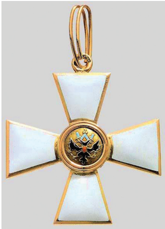
Орден Св. Георгия IV степени