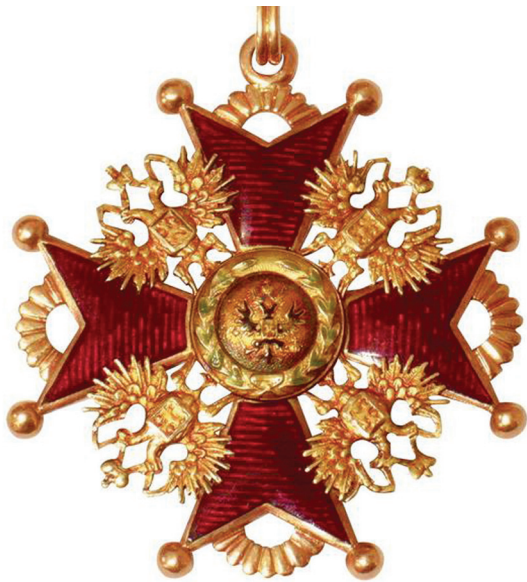
Знак ордена Св. Станислава