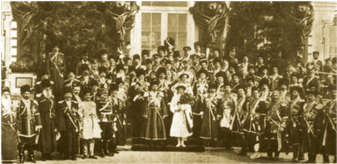
Группа генералов и офицеров СЕИВ Кавказского Конвоя