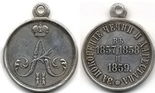
Медаль „За покорение Чечни и Дагестана“ (серебро)