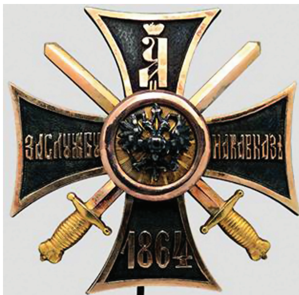
Крест „За службу на Кавказе“ для генералов. (Золото)