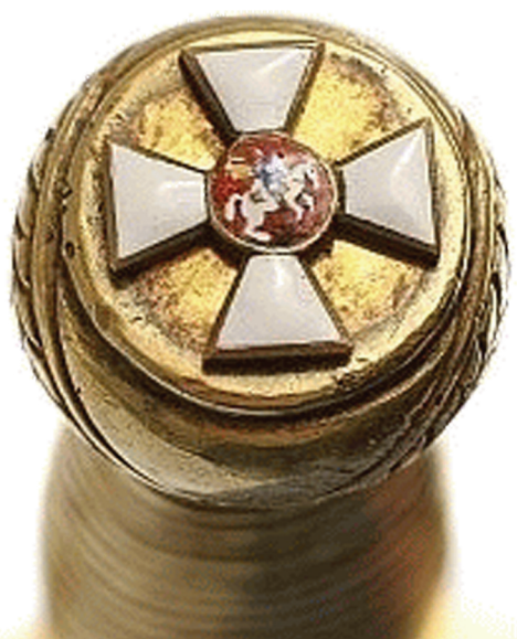
Георгиевский морской кортик