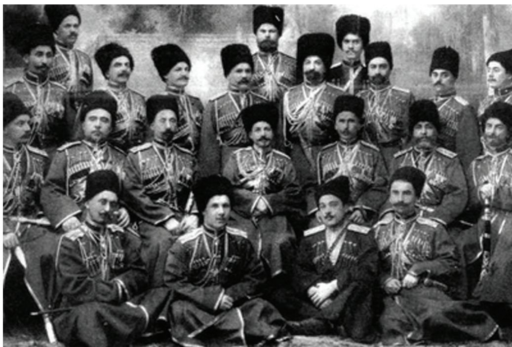
Группа офицеров СЕИВ Кавказского Конвоя