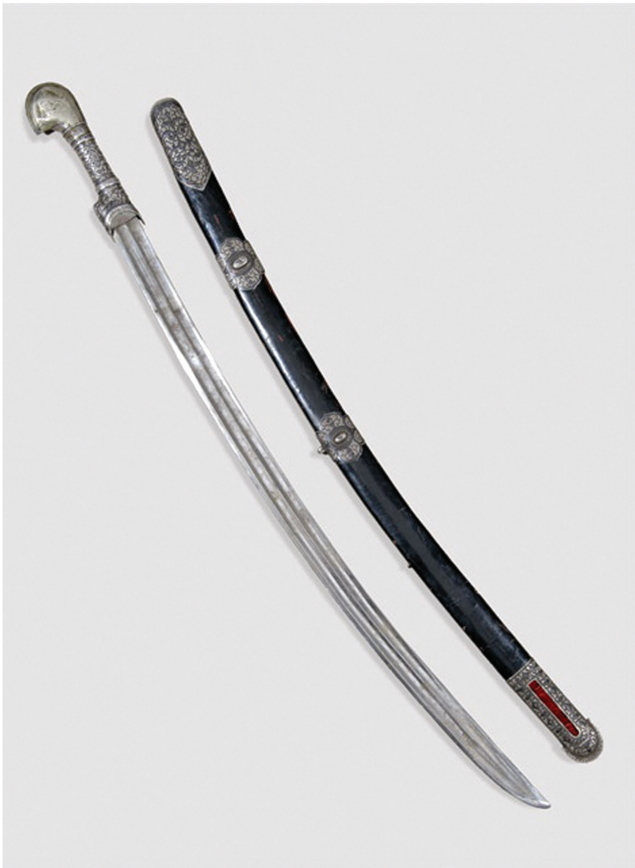
Кавказская шашка (Серебро)