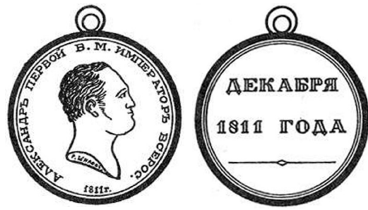
Медаль для кабардинской делегации. (1811). (Золото)