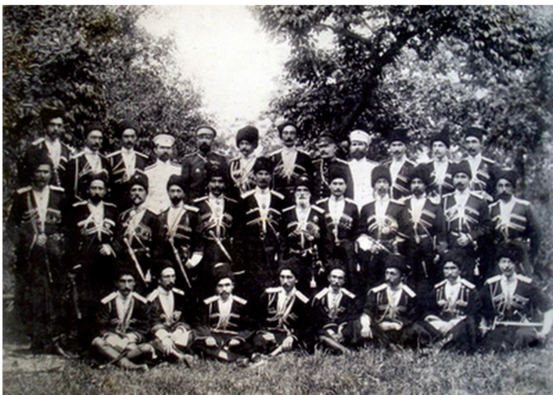
Группа офицеров Дагестанского полка