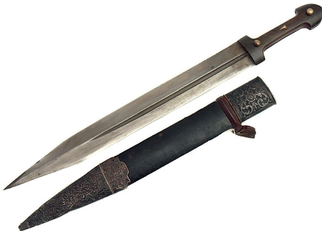
Кавказская шашка и кинжал (Серебро)