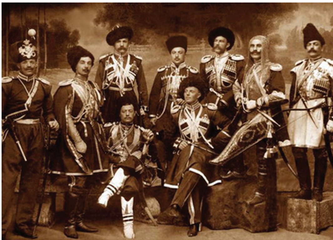
Группа офицеров СЕИВ Кавказского Конвоя