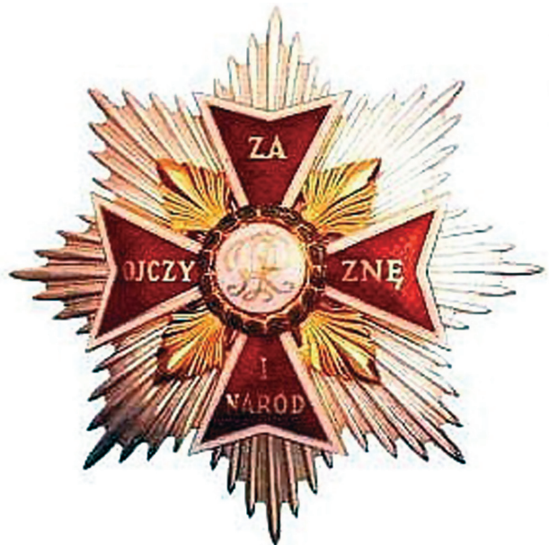
Звезды и знаки ордена Белого Орла