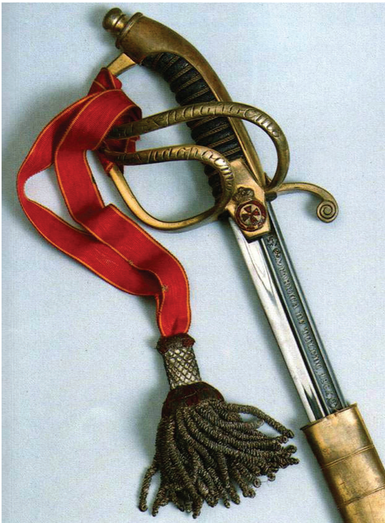
Аннинское оружие (За храбрость)