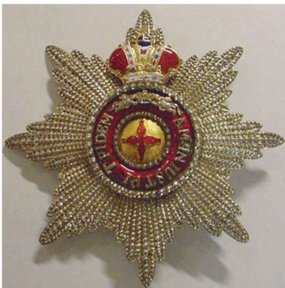
Звезда ордена Св. Анны