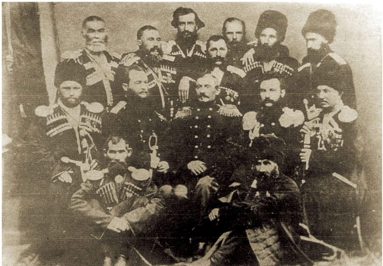
Представители народов Зап. Кавказа с начальником Кубанской области генералом Цакни