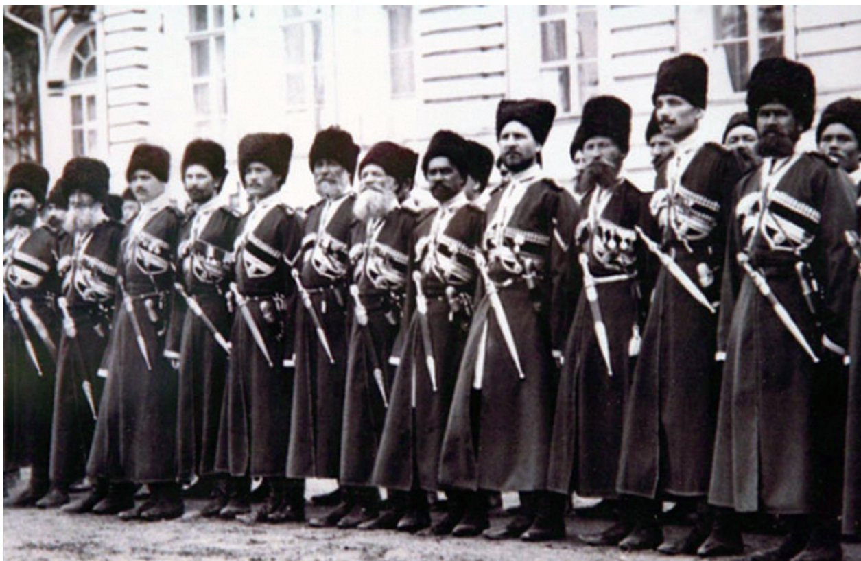
Офицеры СЕИВ Кавказского Конвоя