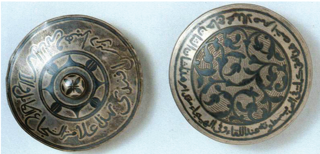
Ордена, учрежденные Шамилем