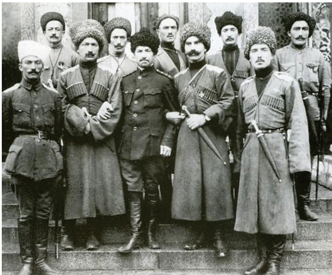
Группа генералов и офицеров Дикой дивизии в Петрограде (1917 г.)