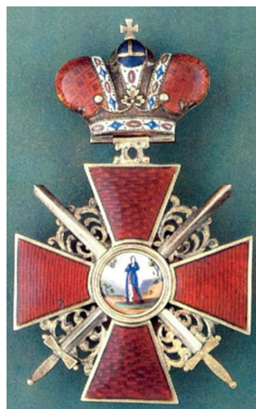
Знак ордена Св. Анны с Императорской короной и мечами (За военные заслуги)