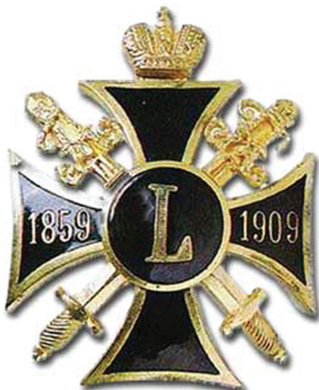
Крест „50-летие окончания Кавказской войны“