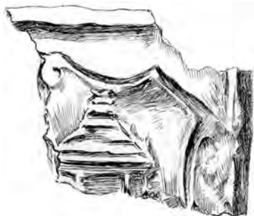
Рисунок фрагмента изразца, присланный Н.Г. Маслаковцем В.К. Лукомскому (Российский государственный исторический архив. – Ф. 986. – Д. 44. – Л. 15)

Определить герб удалось вполне , не только в смысле принадлежности роду, но даже лицу 113 . Желание дать Вам исчерпывающее разъяснение всех частей 4-ех-сложного герба (составленного по системе quatre quartiers) 114 , подкрепленное