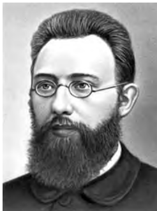
Владимир Дмитриевич Бонч-Бруевич