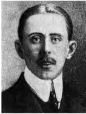
Удо Георгиевич Иваск