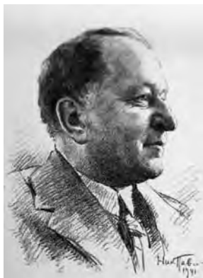
Петр Максимилианович Дульский