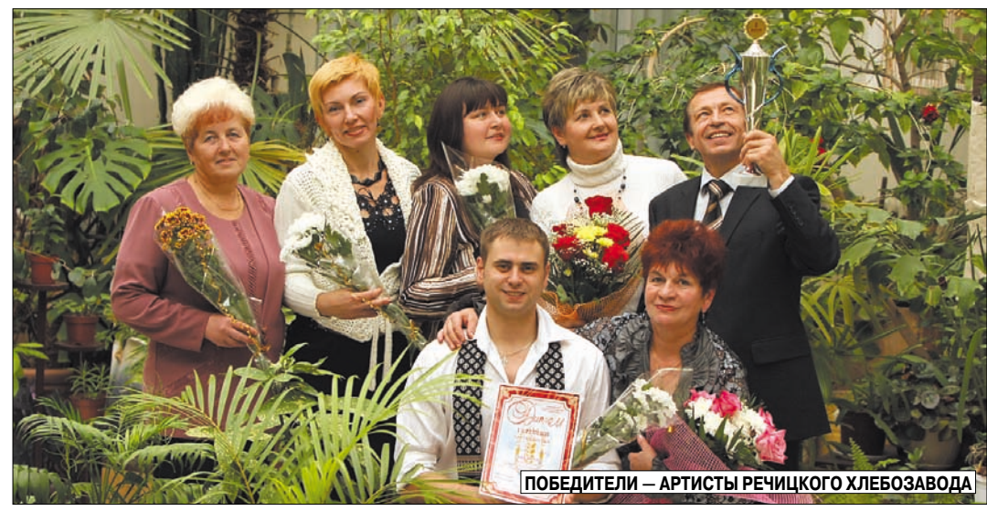
ПОБЕДИТЕЛИ — АРТИСТЫ РОГАЧЕВСКОГО ХЛЕБОЗАВОДА

Ясное дело, без хлеба нам обойтись трудно, даже невозможно. А вот зрелища... Что они питают? Хотелось сказать, душу, но нет. Духовный голод мы удовлетворяем через книги, многие ищут смысл жизни в храмах. Что такое зрелище для нас, современных людей?