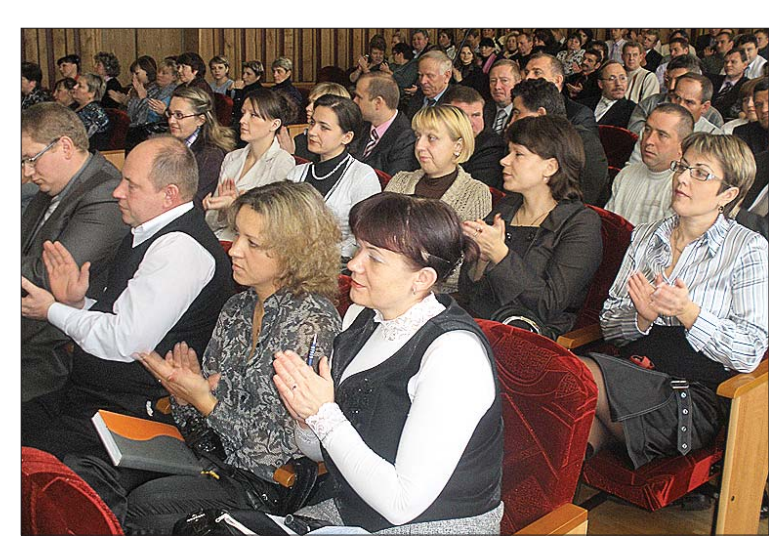
СОБРАНИЕ УПОЛНОМОЧЕННЫХ В ЧЕЧЕРСКЕ

— Пятилетка роста по всем направлениям — так можно охарактеризовать это время для нашего вуза. Открыты два новых факультета: биологический и факультет повышения квалификации и переподготовки кадров, магистратура. Начали готовить специалистов по 10 новым специальностям. Теперь у нас учатся также иностранные студенты из России, Украины, Азербайджана и Туркменистана. Реализован перспективный план подготовки специалистов высшей квалификации на 2006 — 2010 годы. На минувшем форуме была отмечена необходимость развития науки как важной составляющей дальнейшего развития государства. Университетом разработана и выполнена программа по проблемам истории, культуры и экологии Мозырско-Припятского Полесья “Полесье-2007”. В рамках ее выполнялось 11 проектов, 8 заданий, включенных в государственные программы научных исследований. Ускоренное развитие получили перспективные направления в науке, нашедшие практическое применение в различных отраслях, в частности на Мозырском нефтеперерабатывающем заводе. Университет является владельцем 7 патентов на полезные модели и изобретения. Принята Программа инновационного развития вуза до 2015 года, в рамках которой выполнено 20 хозяйственных договоров. К лучшему изменились условия учебы и быта студентов. Капитально отремонтированы общежитие № 2, столовая, продолжается ремонт главного учебного корпуса, открыт новый тренажерный зал.