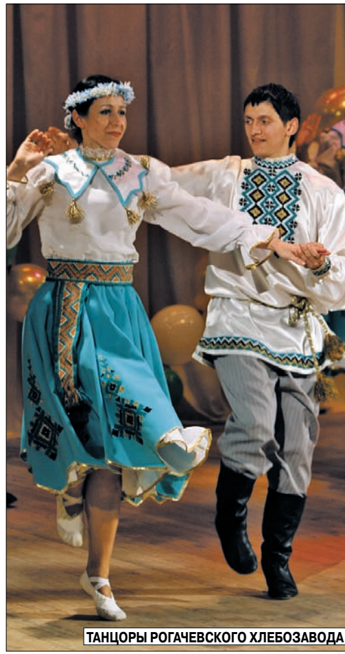
ТАНЦОРЫ РОГАЧЕВСКОГО ХЛЕБОЗАВОДА