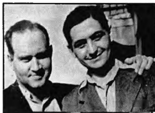
С Давидом Ойстрахом