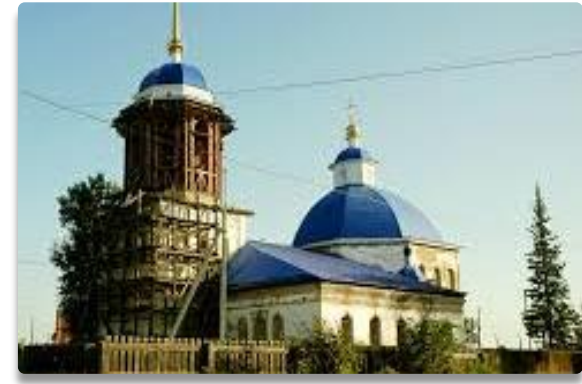
По сей день продолжается ремонт церкви