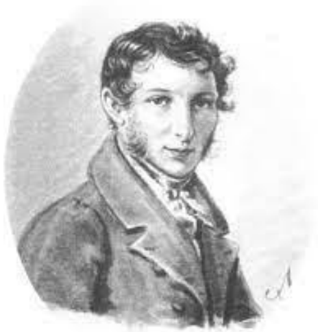
С. П. Трубецкой