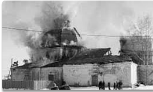
Церковь пережила страшный пожар в 2006 году