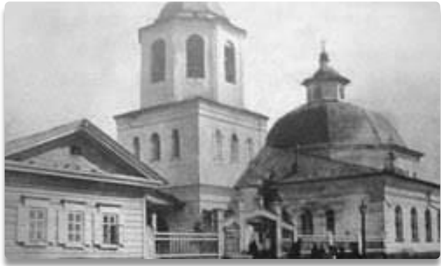
Храм Господень – краса и гордость села Оёк