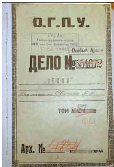
Обложка дела. Cover of the file

Дело открывает ордер ОГПУ № 9474 от 21 февраля 1931 г. на производство ареста и обыска у Свечина по адресу Москва, Дегтярный переулочек, д. 4, кв. 7, выданный сотруднику оперативно-го отдела ОГПУ Мукке и подписанный заместителем председателя ОГПУ Г.Г. Ягодой и начальником оперативного отдела Ершовым 7 . При обыске у Свечина, произведенном комиссаром оперативного отдела Кулешевым в присутствии понятых, были изъяты: револьвер «Наган» с 14 патронами и кобурой, две пары золотых часов на цепочке, два знака ордена Св. Георгия в футляре с золотой монограммой, Георгиевское оружие с надписью «За храбрость», а также чемодан с письмами и документы 8 . Позднее Све-