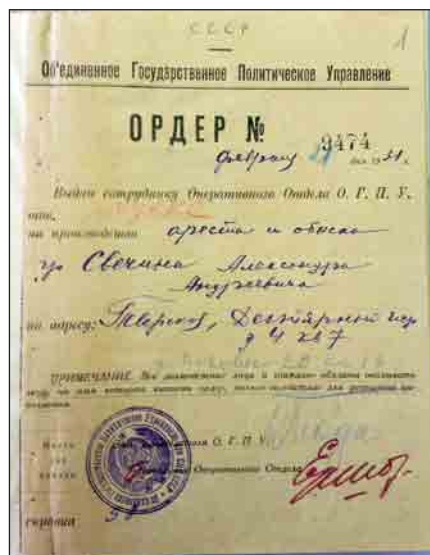
Ордер на арест. Публикуется впервые. Arrest warrant. Published for the first time