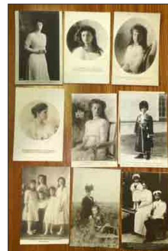
Изъятые материалы. Публикуется впервые. Excluded materials. Published for the first time

чин упоминал среди изъятого еще один чемодан с документами и золотую цепочку от часов 9 . Изъятые ценности были приняты комендатурой административно-организационного управления ОГПУ 10 . Чемодан с книгами и письмами был опечатан и оставлен на хранение супруге арестованного под расписку о сдаче его по требованию ОГПУ 11 . Среди изъятого оказалась чековая книжка Свечина, ссудное свидетельство и 218 руб., которые были переданы ячейке Осоавиахима Военной академии РККА 12 . В деле сохранились изъятые у Свечина материалы – 13 открыток с изображениями представителей семьи императора Николая II и письмо брата М.А. Свечина из Франции от 9 апреля 1928 г. 13