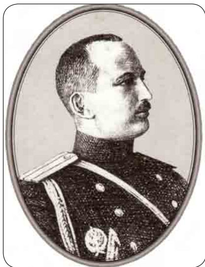
А.А. Свечин в старой армии. A.A. Svecin in the old army

мели выстрелы, они оказались не только не нужны властям, но и воспринимались как потенциальная угроза безопасности Советской России, а затем и СССР. Положение этой группы лиц усугубилось с приходом к власти такого яркого противника политики привлечения бывших офицеров на службу в РККА каким был И.В. Сталин. Произошло это не сразу, но именно бывшие офицеры стали одной из первых жертв массовых репрессивных кампаний, которые проводились в СССР в конце 1920-х – начале 1930-х гг.