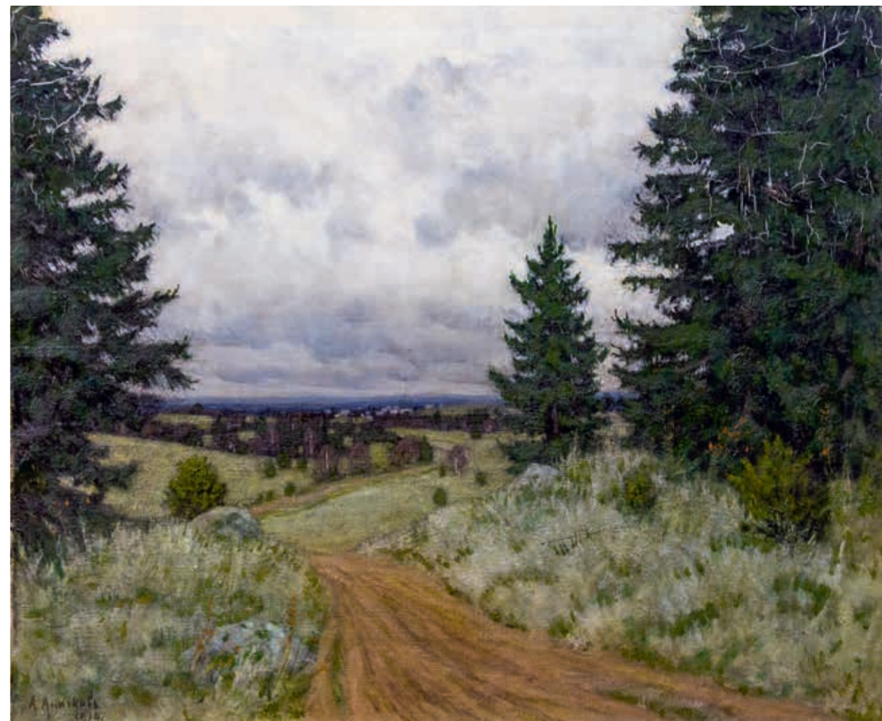
Александр Иванович АНИЧКОВ Осенний пейзаж. 1914