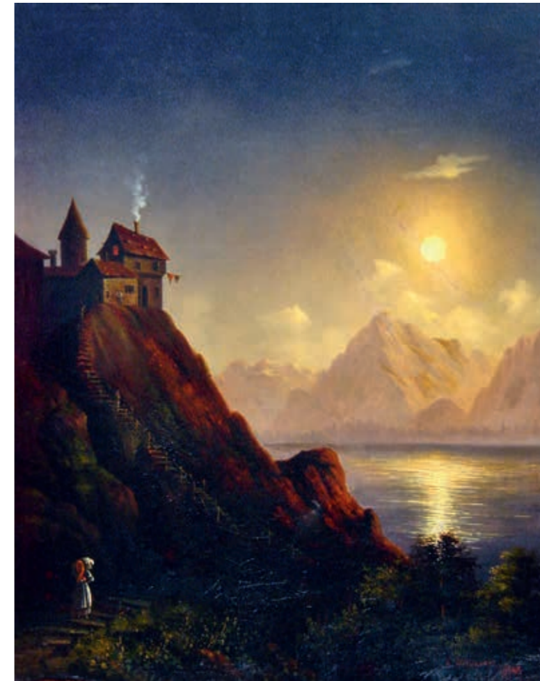
Владимир Карлович (Фёдорович) фон ШУЛЬМАН Озеро в горах. 1849