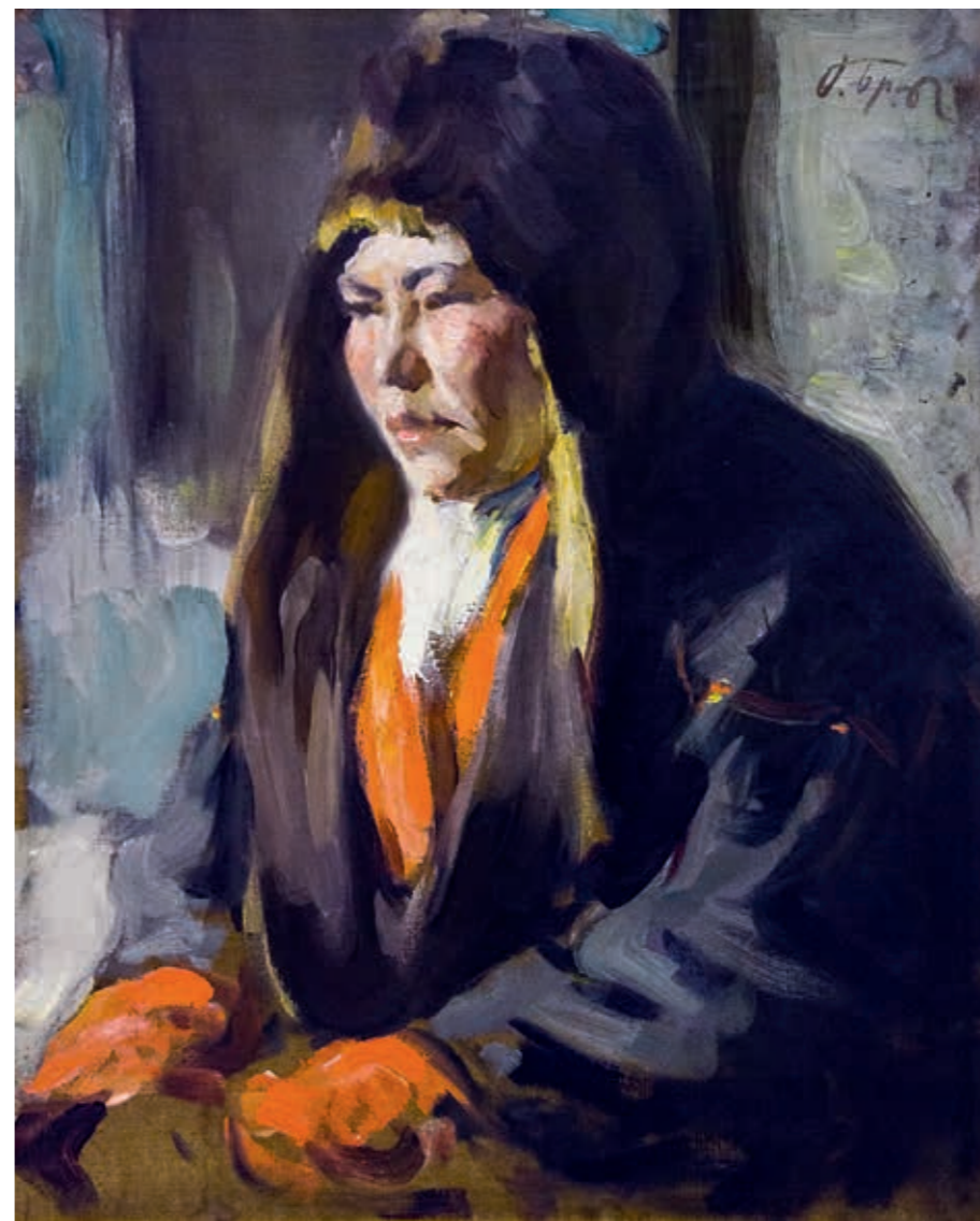
Осип Эммануилович БРАЗ Портрет nenки