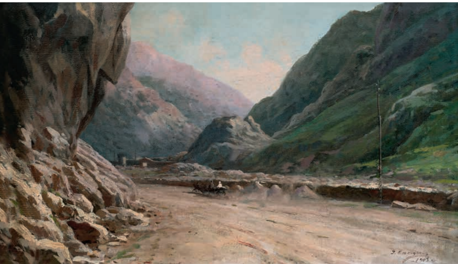
Яков Андреевич БЕЛОУСОВ Горный пейзаж (Кавказ). 1903