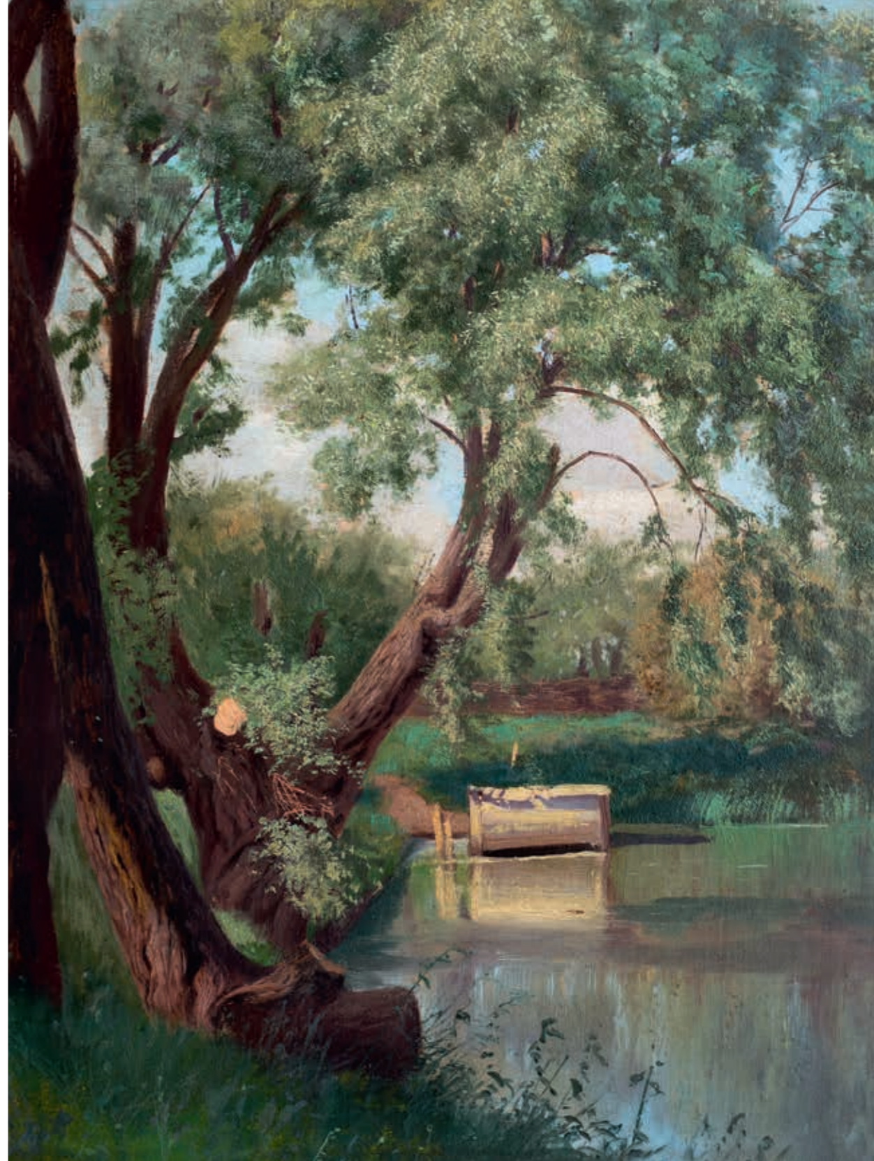
Константин Яковлевич КРЫЖИЦКИЙ Пейзаж (Озеро).