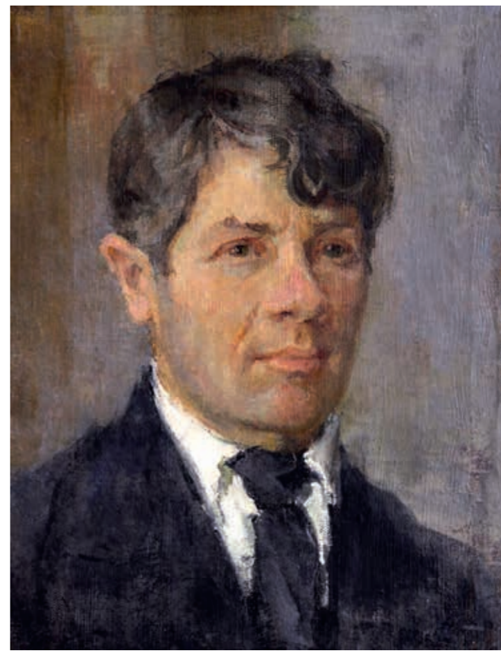
Николай Иванович МИХАЙЛОВ Портрет художника Константина Константиновича Чеботарёва. 1917 (?) Портрет Евгении Андреевны Медведской. 1917