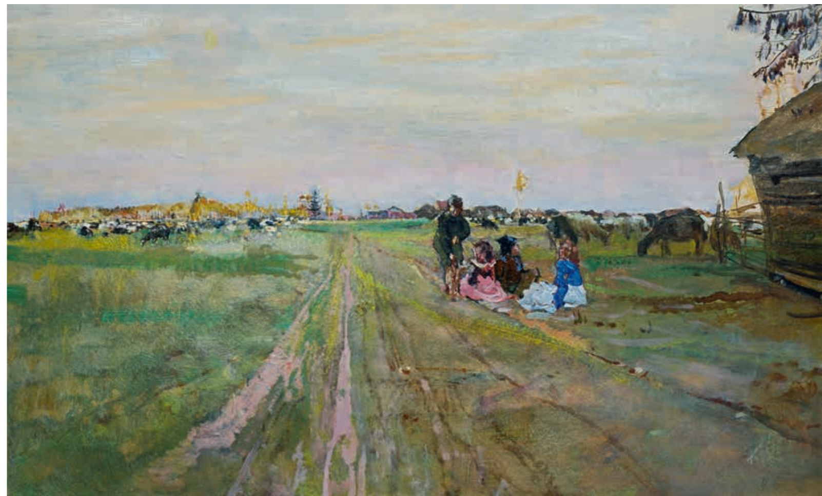
Исаак Израилевич БРОДСКИЙ К вечеру. 1911