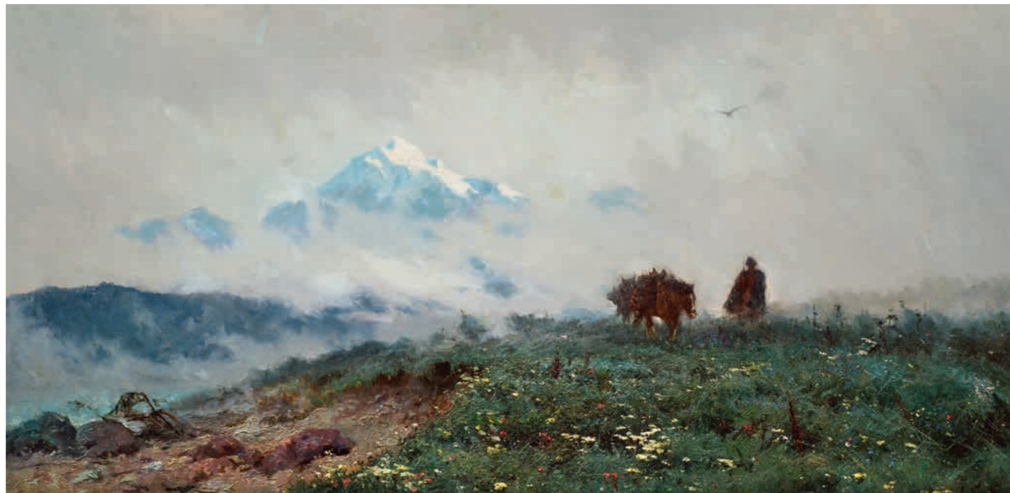
Антон Иванович КАНДАУРОВ Горный пейзаж (Кавказ). 1896