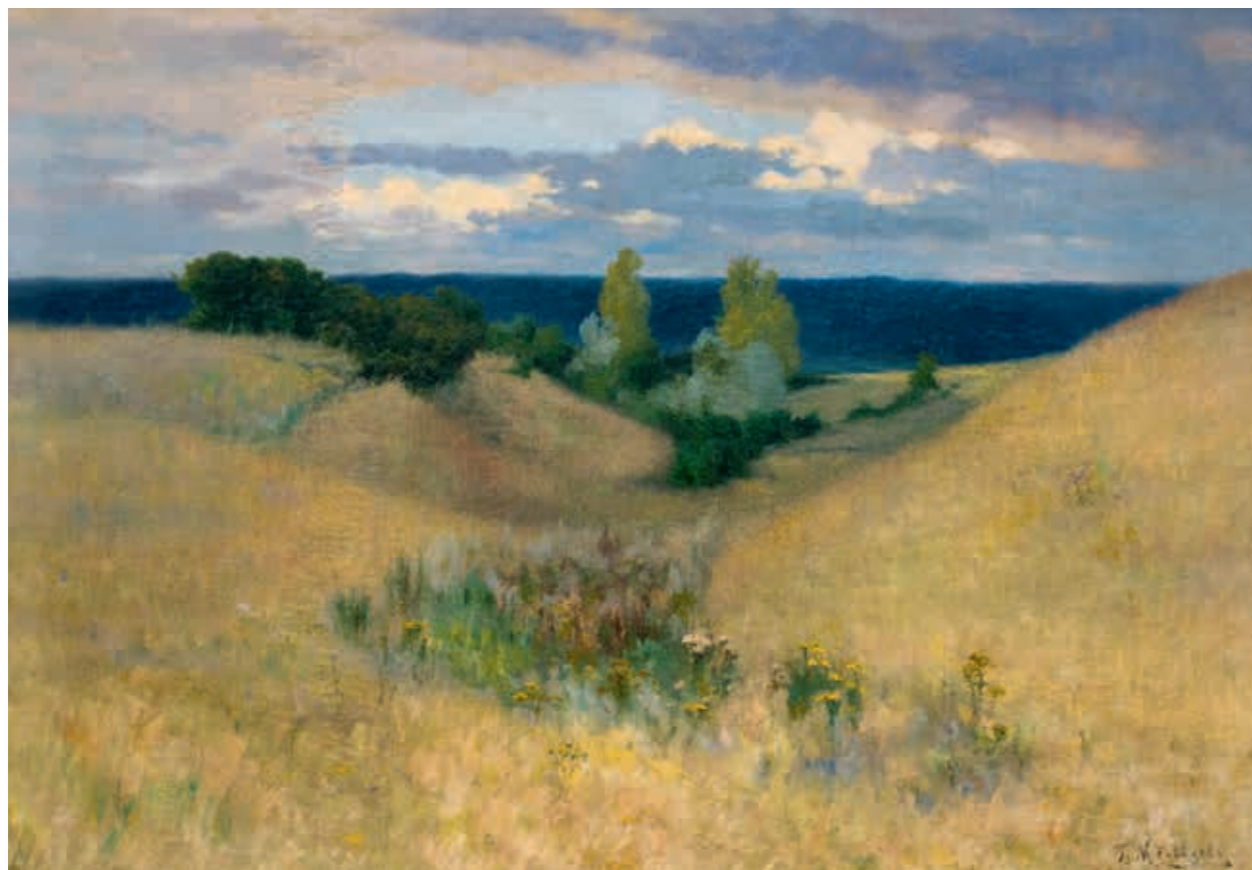
Григорий Антонович МЕДВЕДЕВ Пейзаж Облака