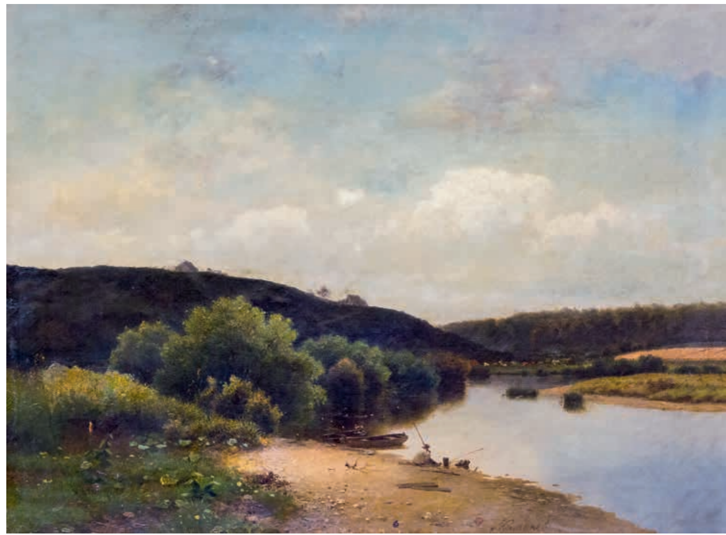
Лев Львович КАМЕНЕВ Казанка