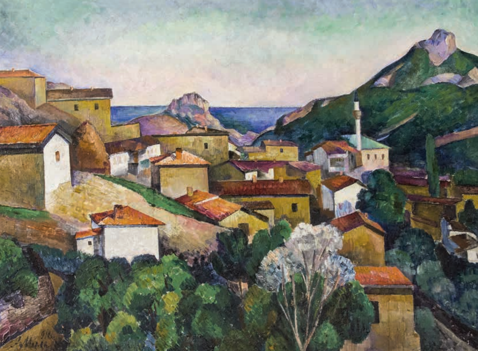
Адольф Израилевич МИЛЬМАН Крымский пейзаж. 1916