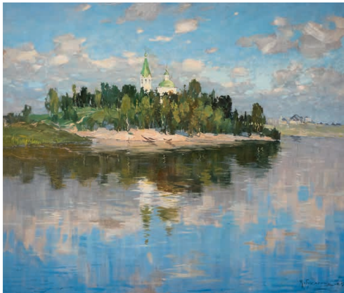
Михаил Маркелович ГУЖАВИН Пейзаж с озером. 1917