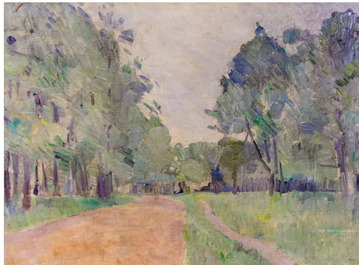
Пётр Иванович Львов Пейзаж. Серый день