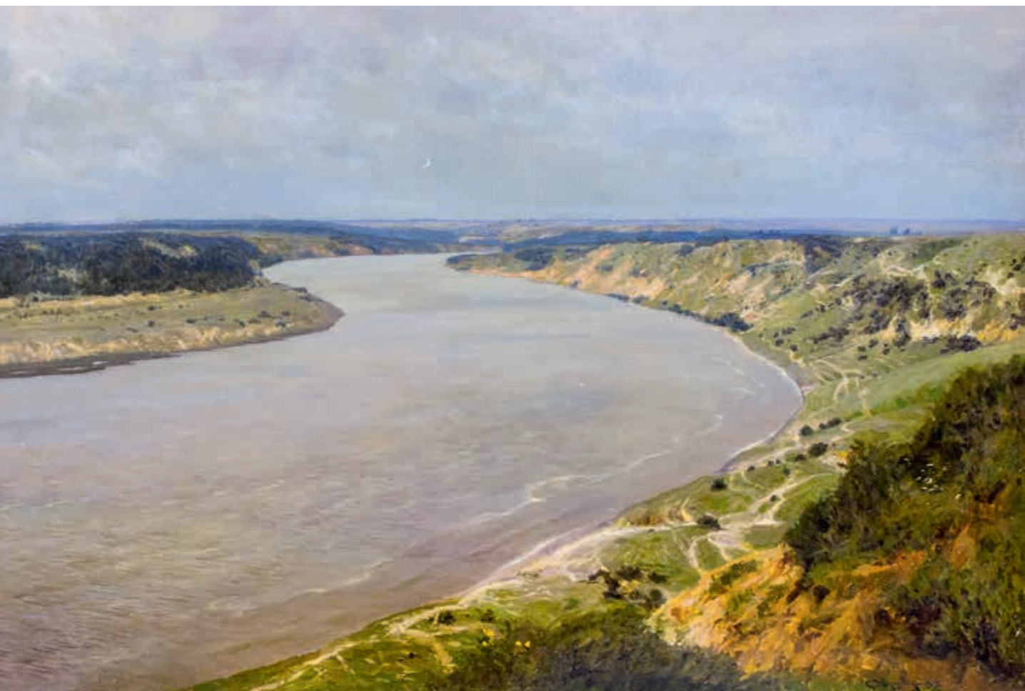
Станислав Юлианович ЖУКОВСКИЙ Река Неман. 1895