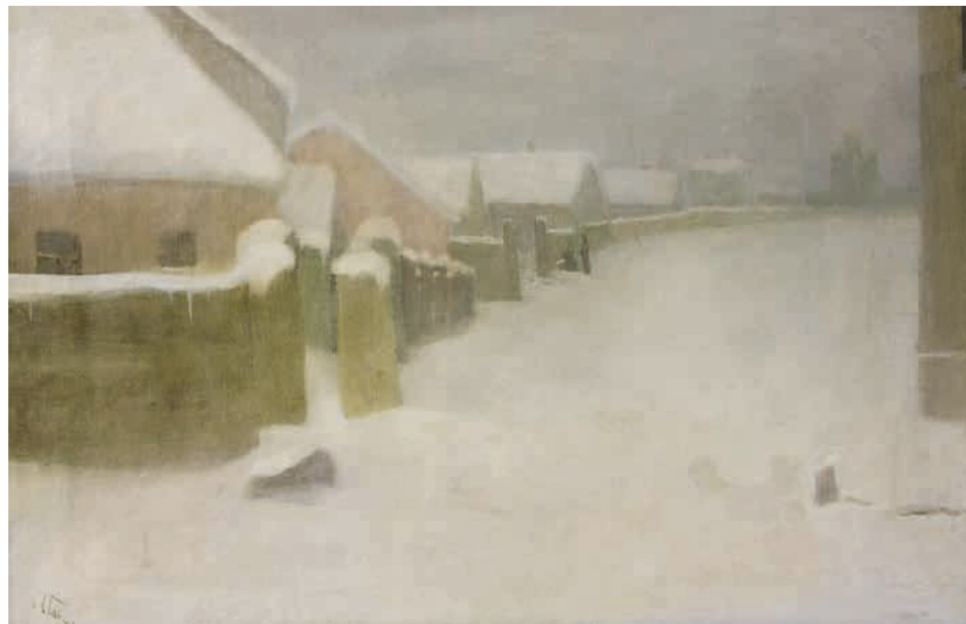
Александр Фёдорович ГАУШ Зимний пейзаж