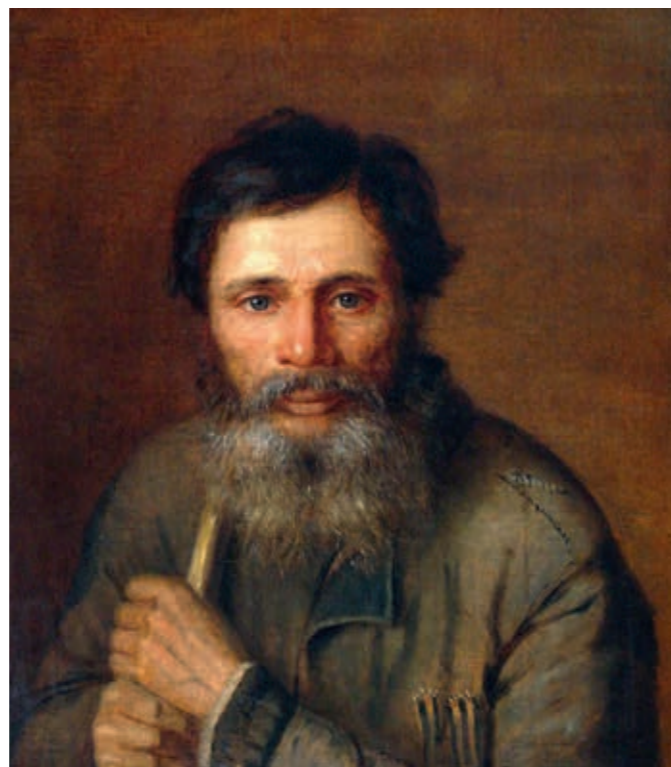
Иван Игнатьевич ЖУРАВЛЁВ Портрет Павла Петровича Филипповича. 1871 Портрет старика-крестьянина