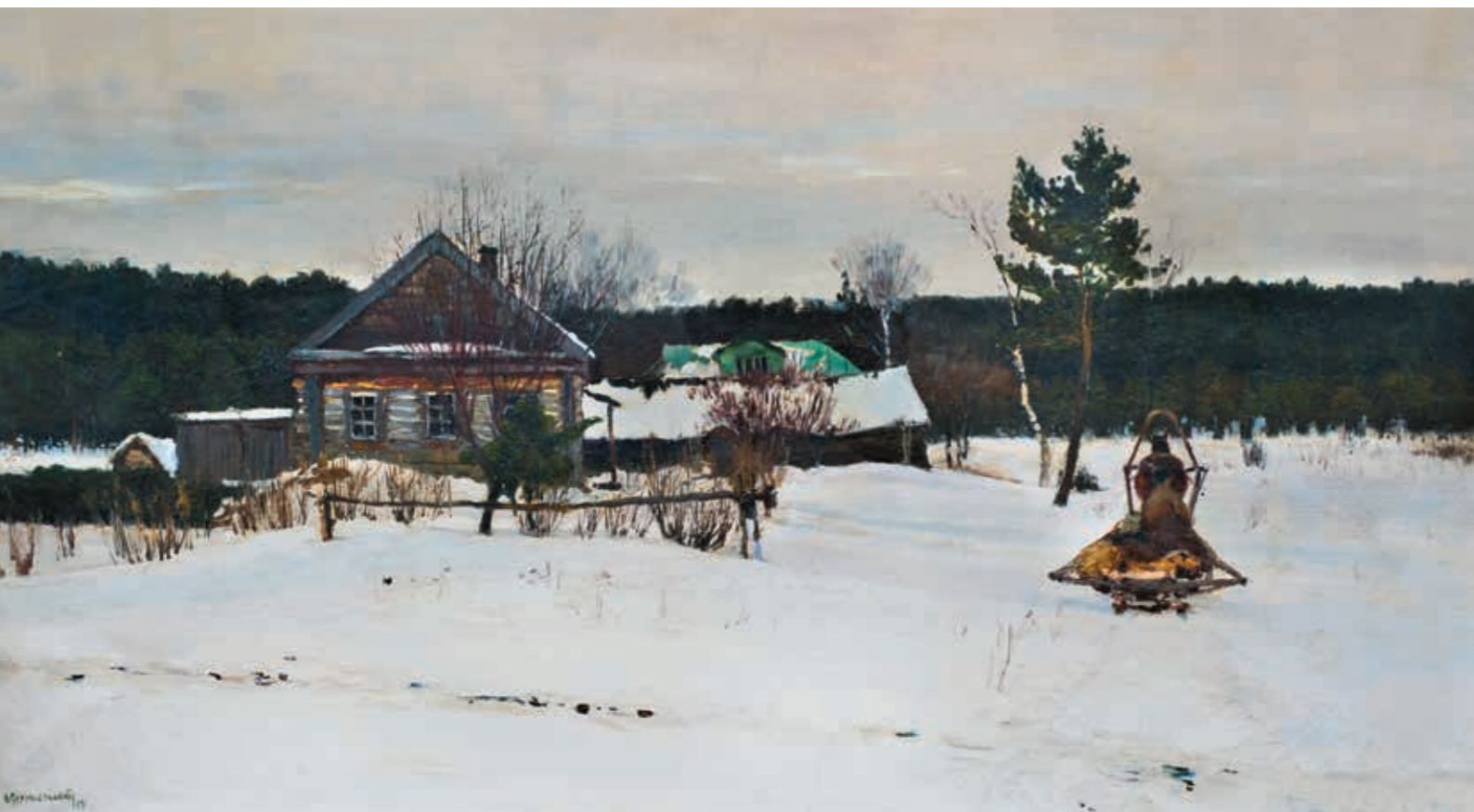
Василий Васильевич ПЕРЕПЛЁТЧИКОВ Зимний пейзаж. 1891