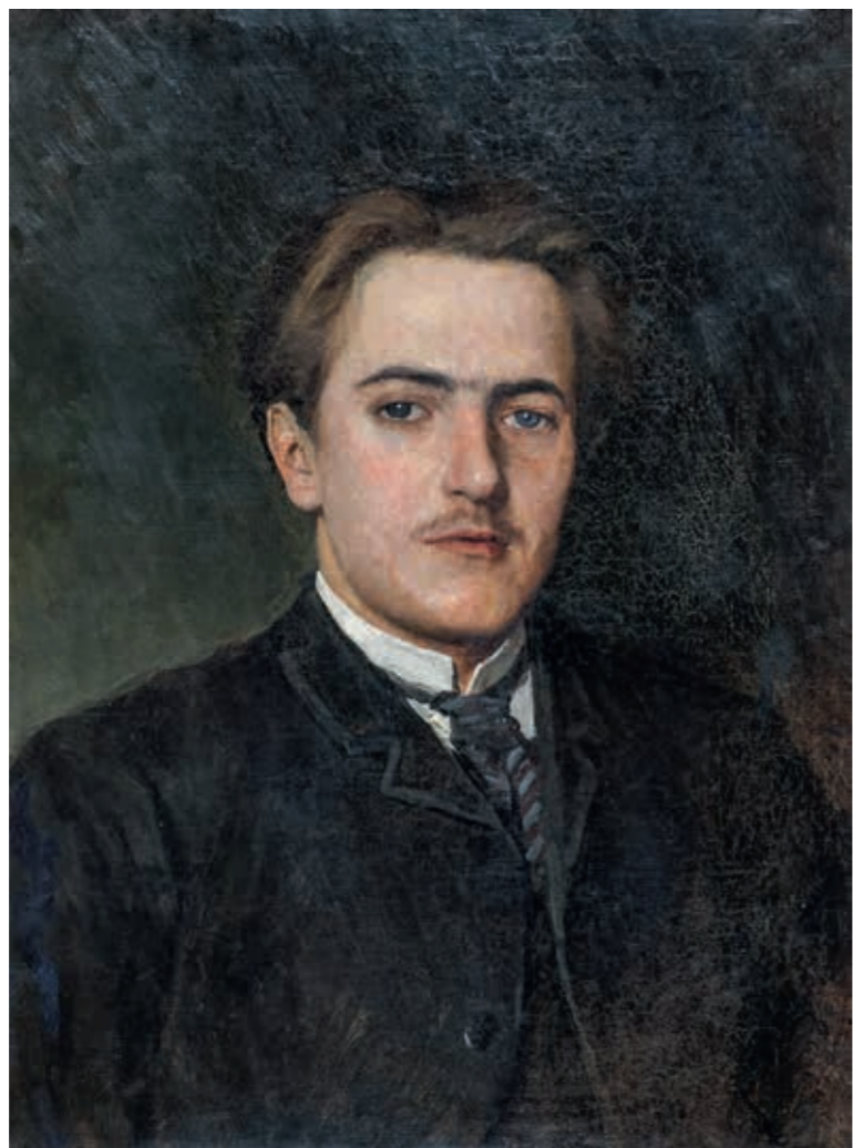
Николай Петрович БОГДАНОВ-БЕЛЬСКИЙ Портрет художника Александра Михайловича Кокорева. Конец 1880-х – нач. 1890-х гг.