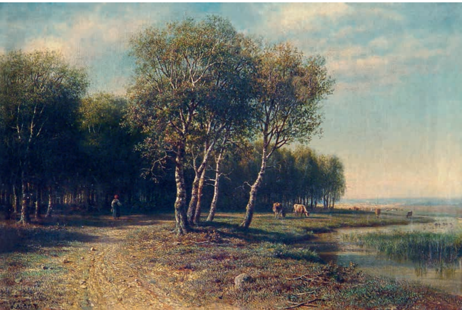
Михаил Константинович КЛОДТ (барон Клодт фон Юргенсбург) Пейзаж. 1871