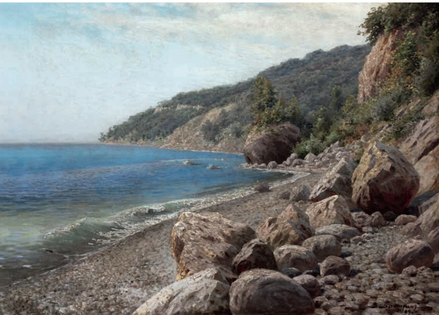
Виктор Павлович БАТУРИН Морской пейзаж. 1909