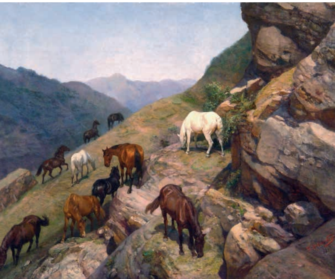
Павел Осипович КОВАЛЕВСКИЙ Табун лошадей в горах. 1894