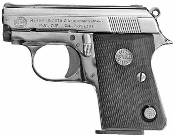
Внешний вид пистолета «Астра-Ункета»