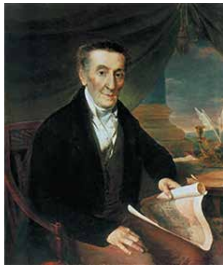
И. Л. Лазарев. Портрет работы В.А. Тропинина, 1822 г. Исторический музей (Москва)

Лазарь Екимович [17(28).2.1797, Москва – 14.10.1871, Брюссель], генерал-майор, участник Отечественной войны 1812, русско-персидской (1826-28) и русско-турецкой (1828-29) войн, награжден золотым оружием с надписью «За храбрость», после заключения Туркманчайского мира 1828 года участвовал в организации переселения в Россию 40 тысяч армян из Персии.