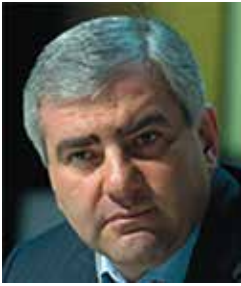
Карапетян Самвел Саркисович (Россия)

Президент Группы компаний «Ташир», в состав которой входит более 200 компаний в различных отраслях экономики РФ. С 2017 года входит в рейтинг 500 богатейших людей мира агентства Bloomberg.