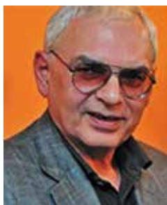
Шахназаров Карен Георгиевич (Россия)

Народный артист Российской Федерации, Генеральный директор «Мосфильма», кинорежиссер, сценарист, кинопродюсер и общественный деятель. Его фильмы – «Мы из джаза», «Город Зеро», «Анна Каренина. История Вронского» и многие другие, покорили сердца миллионов зрителей, вошли в золотой фонд отечественного и мирового отечественного кинематографа.