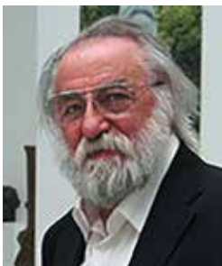
Согоян Фридрих Мкртичевич (Россия)

Народный художник России, Армении и Украины, скульптор. Автор более 400 монументальных и станковых композиций. Среди них: – 1970–1972 гг. – памятник воинам, погибшим в Великой Отечественной войне. Самарканд, Узбекистан; – 1991 г. – «Мать-Земля» («Армения», соавт. М. Ф. Согоян). Вашингтон, США; – 1998 г. – бюст М. И. Рыжкова. Спитак, Армения; – 2008 г. – памятник «Жертвам безвинным, Сердцам милосердным»; многофигурная композиция (соавт. М. Ф. Согоян). Гюмри, Мемориальный комплекс, посвященный 20-й годовщине Спитакского землетрясения 1988 года в Армении; – 2009 г. – памятник Католикосу всех Армян Вазгену I. (соавт. М. Ф. Согоян, В. Ф. Согоян); – 2010 г. – бюст известному полярнику, Герою Советского Союза и Герою России А. Н. Чилингарову. Санкт-Петербург; – 2010 г. – памятник «Танковое сражение под Прохоровкой. Таран» (соавт. М. Ф. Согоян, В. Ф. Согоян). Государственный военно-исторический музей-заповедник «Прохоровское поле», село Прохоровка, Белгородская обл. Его произведения хранятся в музеях, галереях и частных собраниях Армении, России, Великобритании, Германии, США, Узбекистана Украины и Швейцарии. Двое его сыновей – Ваге и Микаэль Согояны – тоже скульпторы.