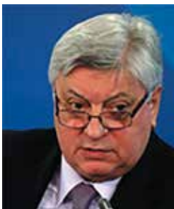
Торкунов Анатолий Васильевич (Россия)

Народный художник России, Армении и Украины, скульптор. Автор более 400 монументальных и станковых композиций. Среди них: – 1970–1972 гг. – памятник воинам, погибшим в Великой Отечественной войне. Самарканд, Узбекистан; – 1991 г. – «Мать-Земля» («Армения», соавт. М. Ф. Согоян). Вашингтон, США; – 1998 г. – бюст М. И. Рыжкова. Спитак, Армения; – 2008 г. – памятник «Жертвам безвинным, Сердцам милосердным»; многофигурная композиция (соавт. М. Ф. Согоян). Гюмри, Мемориальный комплекс, посвященный 20-й годовщине Спитакского землетрясения 1988 года в Армении; – 2009 г. – памятник Католикосу всех Армян Вазгену I. (соавт. М. Ф. Согоян, В. Ф. Согоян); – 2010 г. – бюст известному полярнику, Герою Советского Союза и Герою России А. Н. Чилингарову. Санкт-Петербург; – 2010 г. – памятник «Танковое сражение под Прохоровкой. Таран» (соавт. М. Ф. Согоян, В. Ф. Согоян). Государственный военно-исторический музей-заповедник «Прохоровское поле», село Прохоровка, Белгородская обл. Его произведения хранятся в музеях, галереях и частных собраниях Армении, России, Великобритании, Германии, США, Узбекистана Украины и Швейцарии. Двое его сыновей – Ваге и Микаэль Согояны – тоже скульпторы.