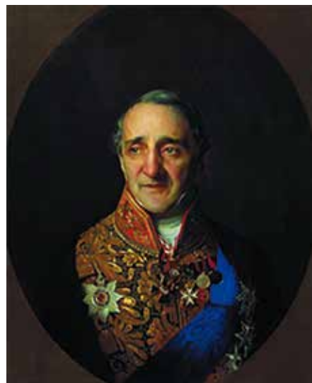
Х.Е. Лазарев. Портрет работы С.К. Зорянко, 1851 г. Нижегородский государственный художественный музей