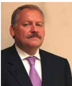
Затулин Константин Федорович (Россия)

Мастер спорта СССР по двум видам спорта, судья всесоюзной категории и заслуженный мастер спорта Армении. Он один из основателей Ереванской спортивной школы олимпийского резерва самбо и дзюдо и первый президент Федерации самбо Армении (с 1979 года, после 1991-го – ее почетный президент), награжден несколькими медалями и грамотами Международной федерации самбо.