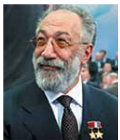
Чилингаров Артур Николаевич (Россия)

Ректор МГИМО (У) МИД России, академик РАН, член Научного совета при Совете безопасности РФ, сопредседатель Российского исторического общества, член Попечительского совета Российского совета по международным делам (РСМД), член Попечительского совета и председатель Научного совета Фонда поддержки публичной дипломатии имени А.М. Горчакова. Российский дипломат, кореевед, историк и политолог. Автор многочисленных книг. Сопредседатель российско-французского форума «Трианонский диалог», заслуженный профессор Национальной академии наук Армении.