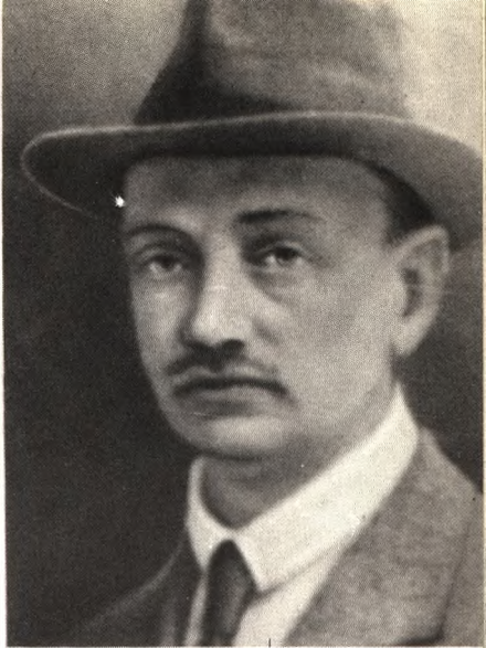
Яков Станиславович Ганецкий