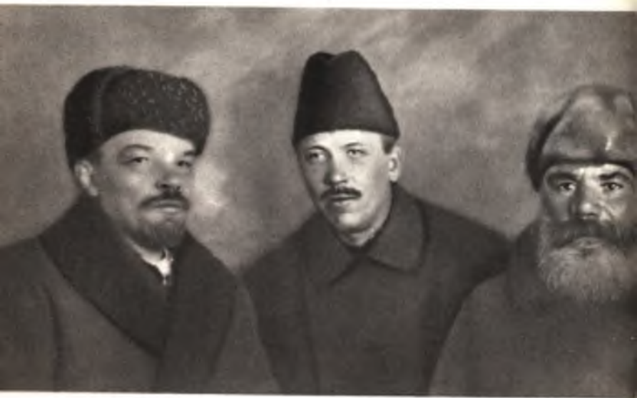
В. И. Ленин, Д. Бедный и делегат VIII съезда РКП(б) от Украины Ф. Панфилов, март 1919 г.