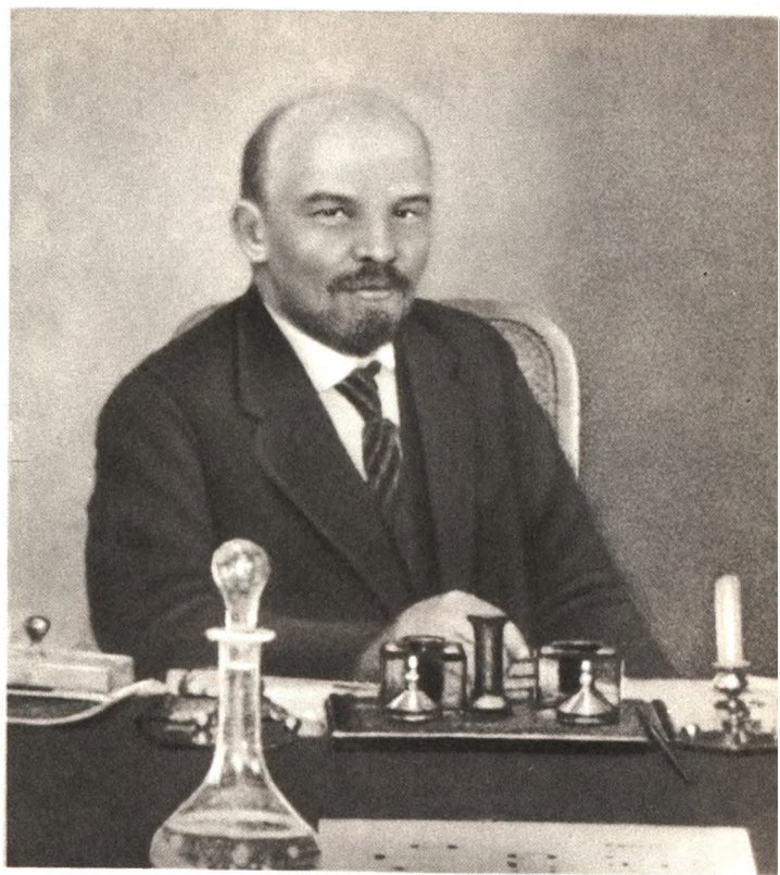
В. И. Ленин на заседании Совнаркома