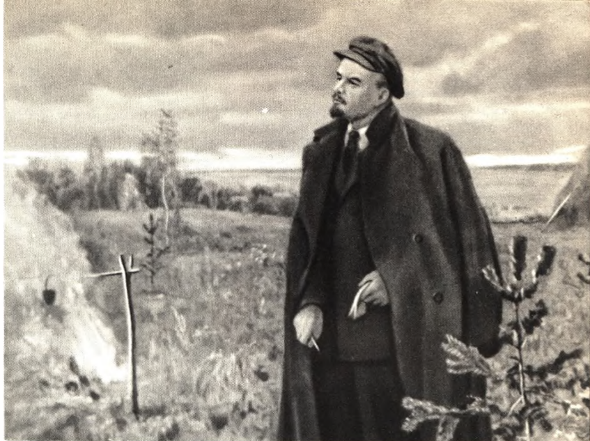
В. И. Ленин в Разливе. С карт. худ. Кукрыниксов