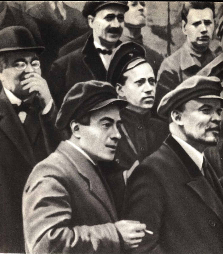
Красная площадь, 25 мая 1919 года. В. И. Ленин, В. М. Загорский, М. Ю. Козловский на параде частей Всевобуча