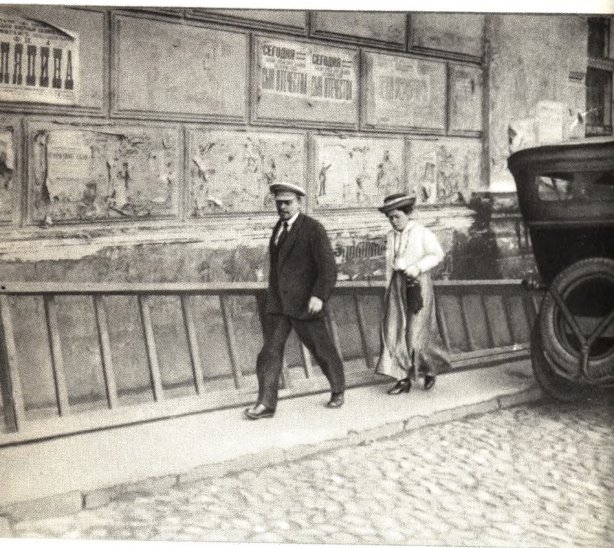
В. И. Ленин и М. И. Ульянова направляются на заседание V Всероссийского съезда Советов. Москва, июль 1918 г.