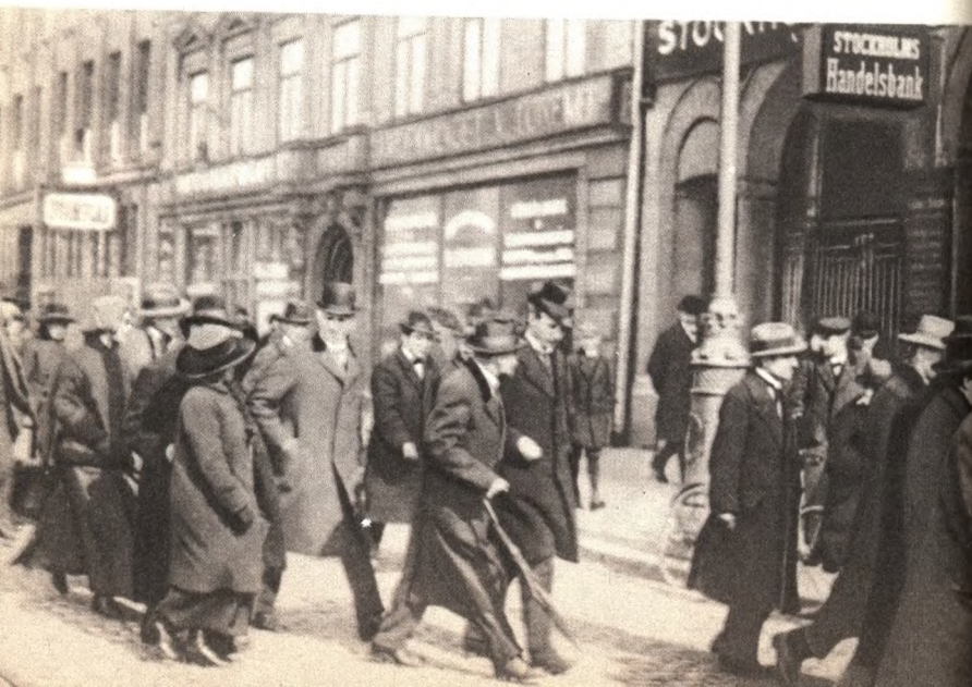
В. И. Ленин среди русских эмигрантов, возвращающихся в Россию. Стокгольм, 31 марта 1917 г.