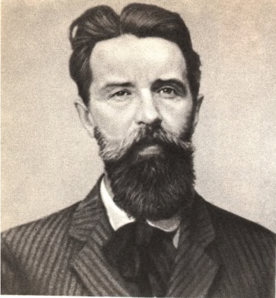
Вацлав Вацлавович Воровский