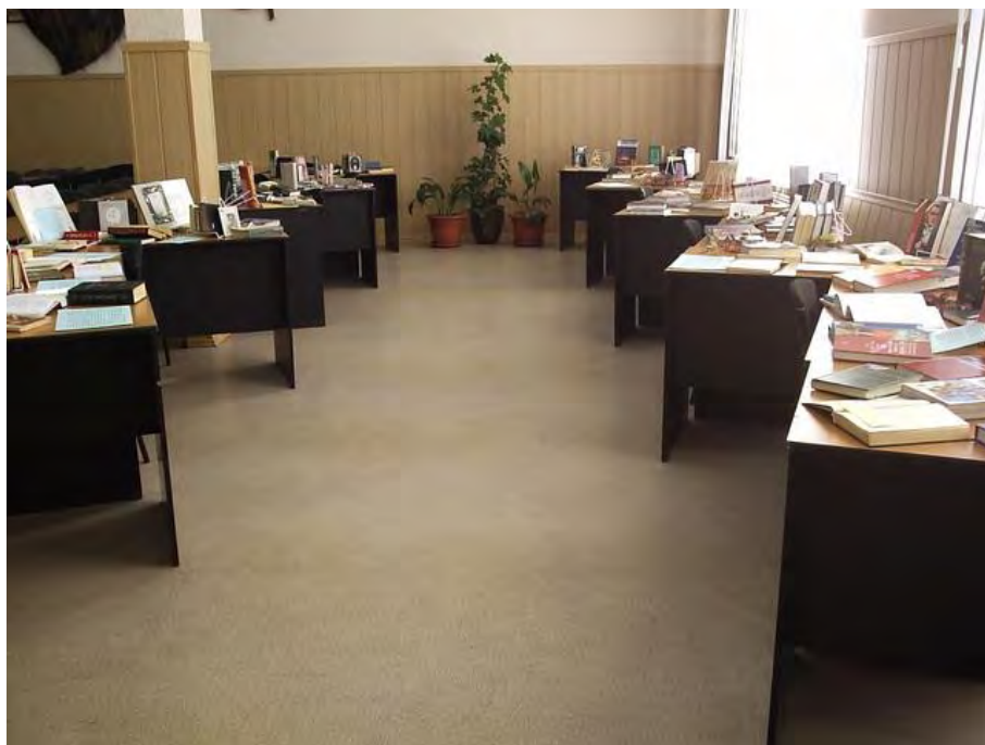
Фото 2. Общий вид выставки