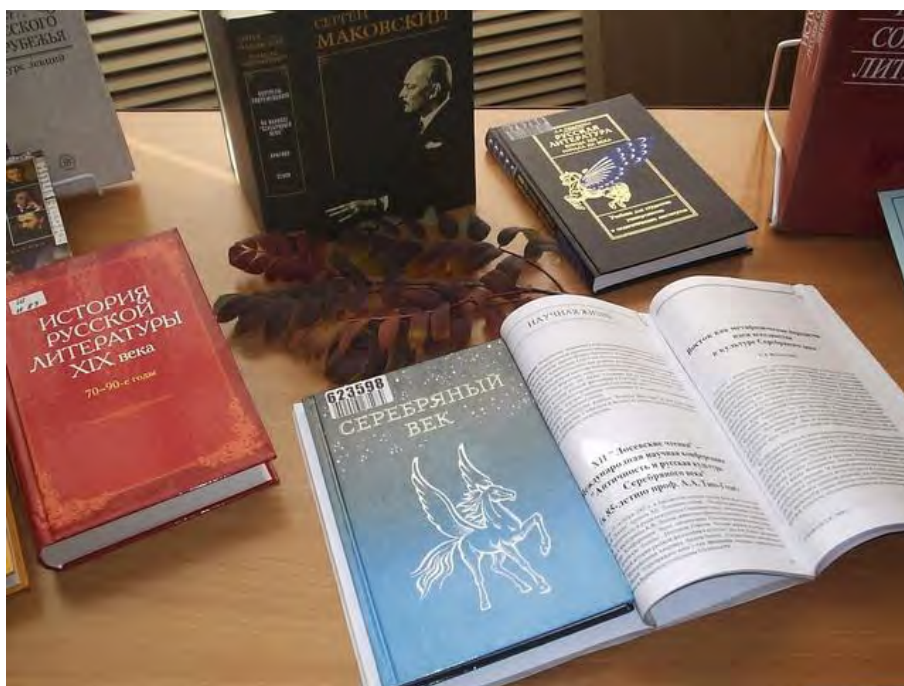
Фото 3. Книги на выставке