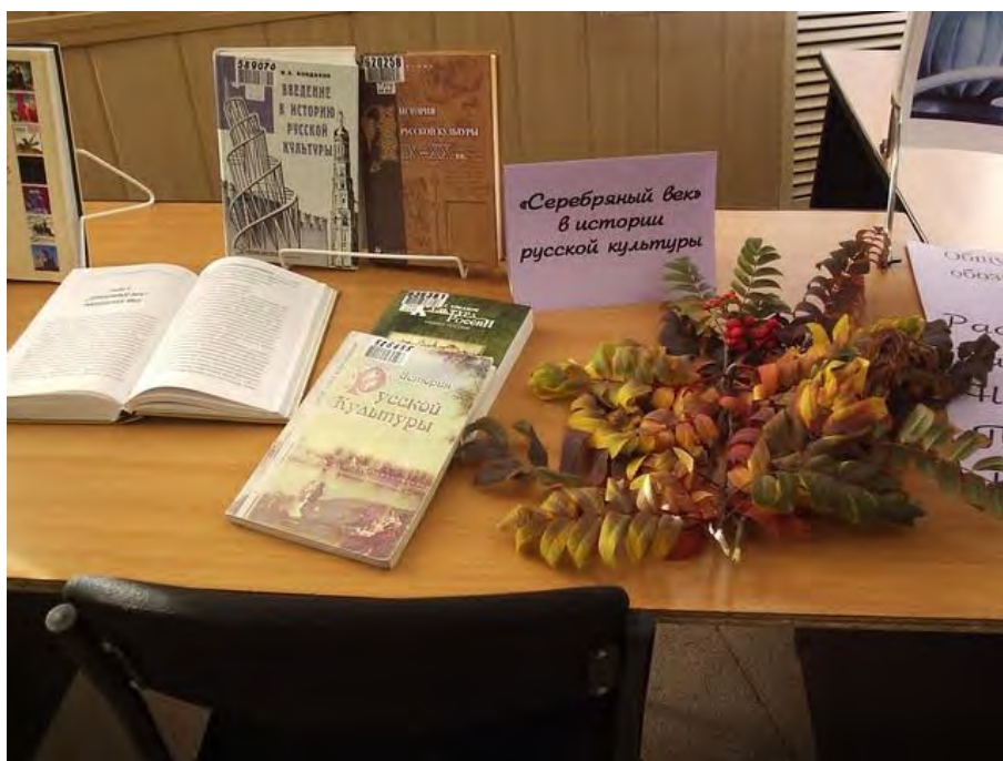
Фото 4. Книги на выставке