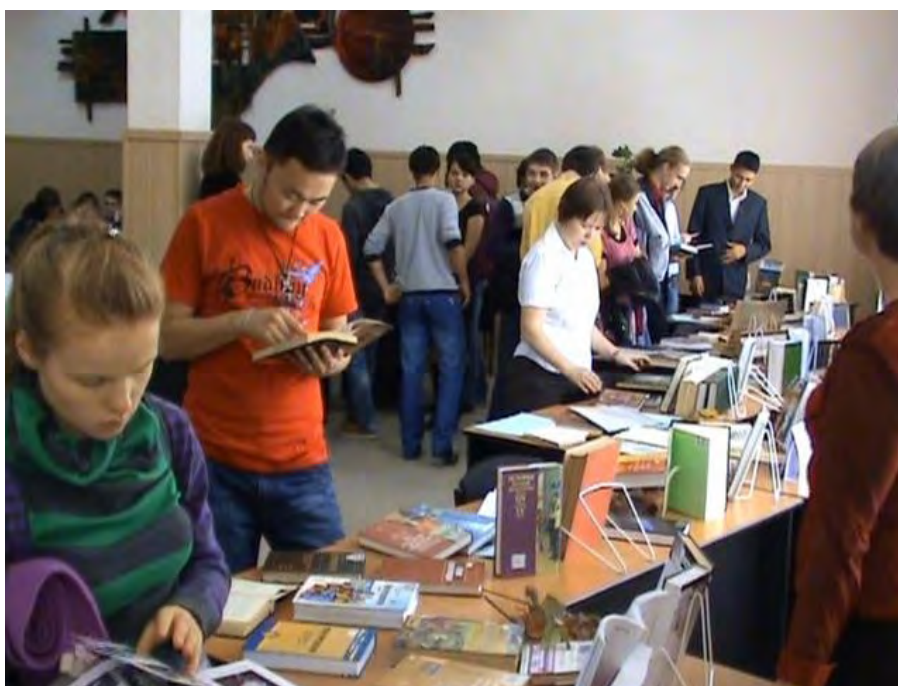
Фото 12. Посетители выставки

Выставка была открыта с 13 по 20 октября 2010 г. Всего ее посетило 228 человек, в Книге отзывов было оставлено 7 записей.