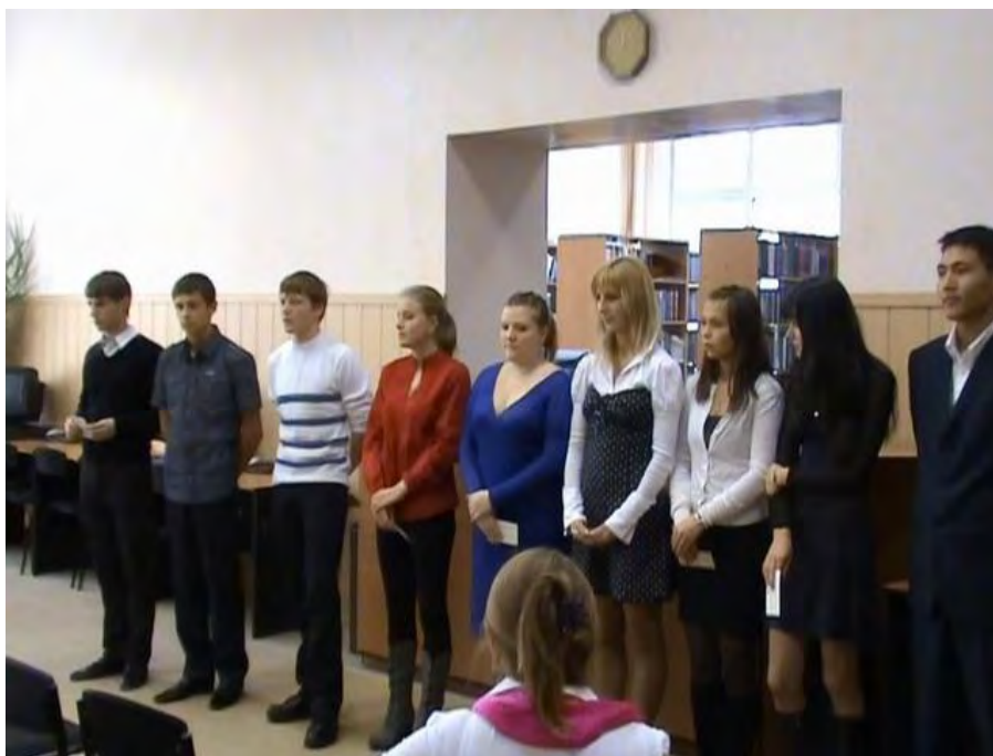
Фото 9. Выступление студентов Факультета строительства и городского хозяйства