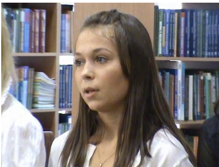
Фото 10. Выступление студентов Факультета строительства и городского хозяйства