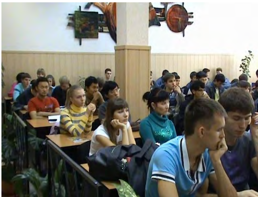
Фото 11. Посетители выставки