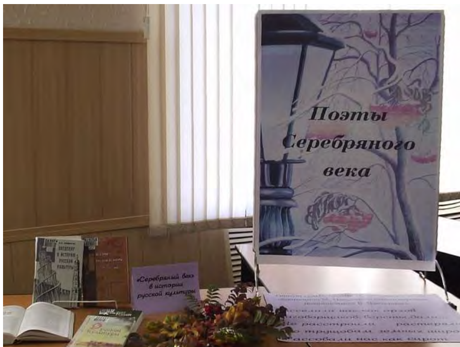
Фото 1. Заголовок выставки