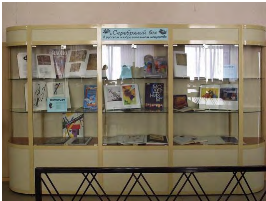
Фото 5. Экспозиция «Серебряный век в русском изобразительном искусстве»