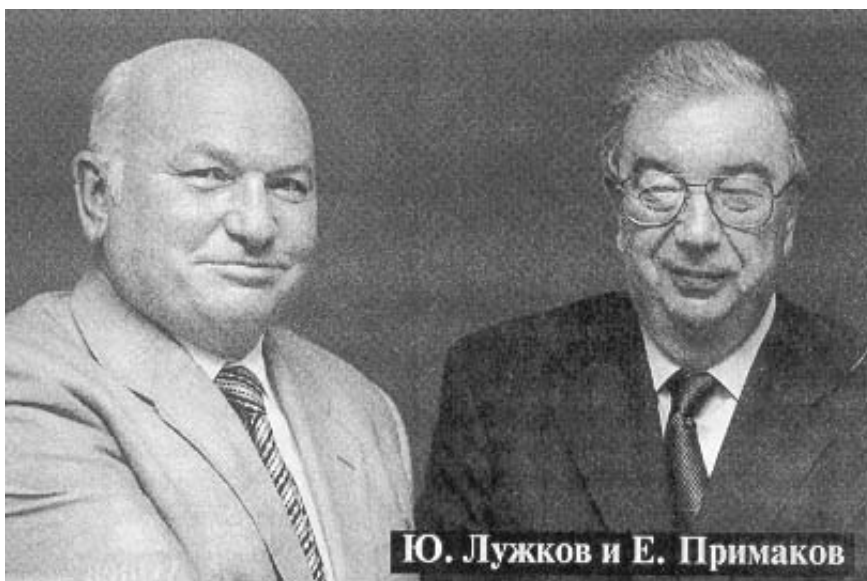
Ю. Лужков и Е. Примаков