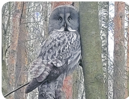
Фото Валентина Микулишна