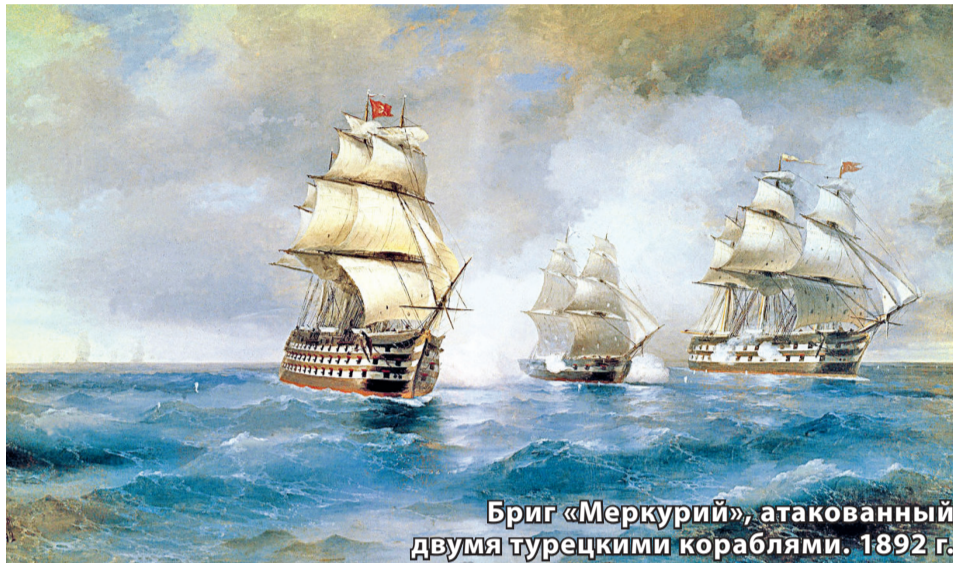
Бриг «Меркурий», атакованный двумя турецкими кораблями. 1892 г.

Рисование было не единственным талантом Ивана Константиновича. Среди его увлечений была и музыка –