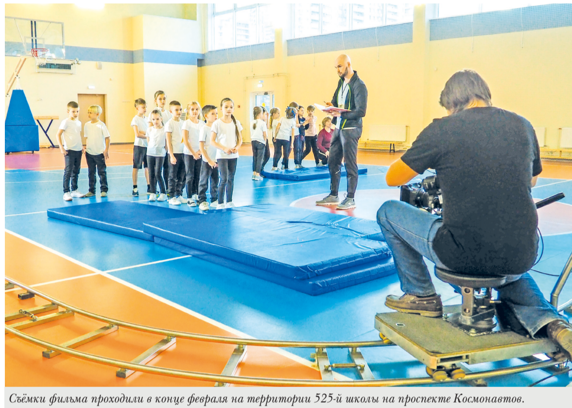
Съёмки фильма проходили в конце февраля на территории 525-й школы на проспекте Космонавтов.

– Это важный момент включения наших юных жителей в процесс уже на начальной стадии