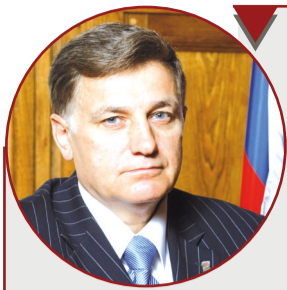
Вячеслав Макаров, Председатель Законодательного Собрания Санкт-Петербурга, Секретарь регионального отделения партии «Единая Россия»