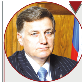
Вячеслав Макаров, Председатель Законодательного Собрания Санкт-Петербурга, Секретарь регионального отделения партии «Единая Россия»

Наша задача – быстро внести изменения и защитить интересы простых горожан».