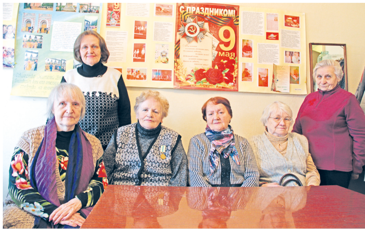
Актив общества «Жители блокадного Ленинграда» МО Гагаринское 45/2