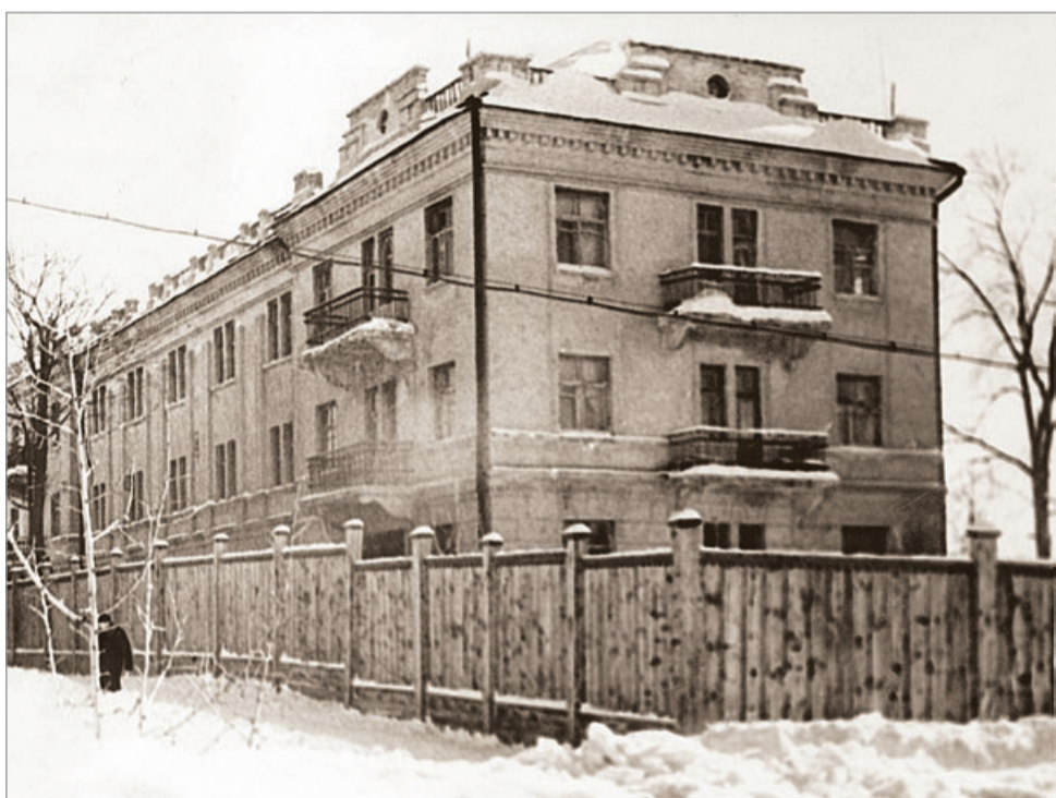
Дом студенческого общежития педагогического института на улице им. Каракозова. Ныне пер. Воскресенский, д. 2.