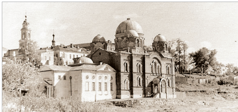
Здания (старое и новое) бывшего Казанского женского монастыря, в которых ныне размещается Государственный архив Калужской области. Перед зданиями видны остатки каменной ограды монастыря.