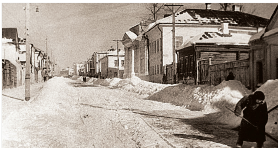
Улица им. Софьи Перовской, ныне Воскресенская.

Фото из архива семьи Хромовых. Валерий ПРОДУВНОВ.