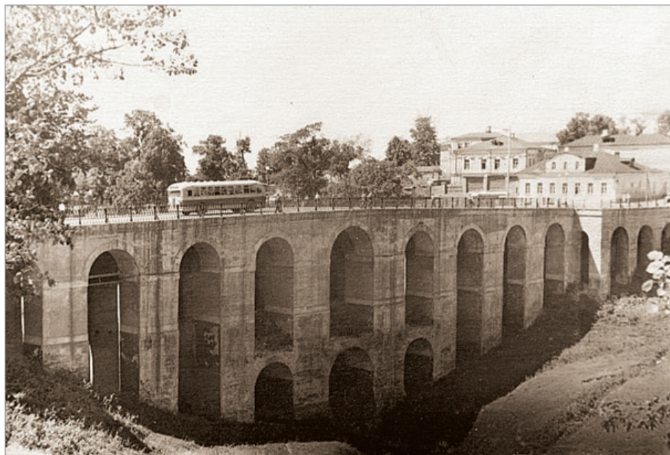
Каменный мост. По нему едет автобус ЗиС-154. Склоны оврага ещё не подверглись сплошному озеленению, которое начнется в начале 60-х годов прошлого века.