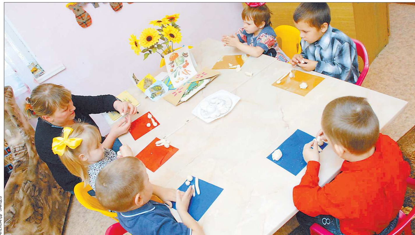
Детский сад нужен не только для присмотра за ребёнком, но и для его развития

В минувшем году санитарные врачи Свердловской области выявили нарушения санитарно-эпидемиологического режима в каждом пятом из 730 объектов общепита, учреждений культуры и образования, где проводились ёлки. Около десятка точек временно закрыли. Кроме того, четверть из 11 тысяч проверенных сладких подарков грешили отсутствием документов, свидетельствующих о качестве продукции, нарушении маркировки и срока годности конфет.