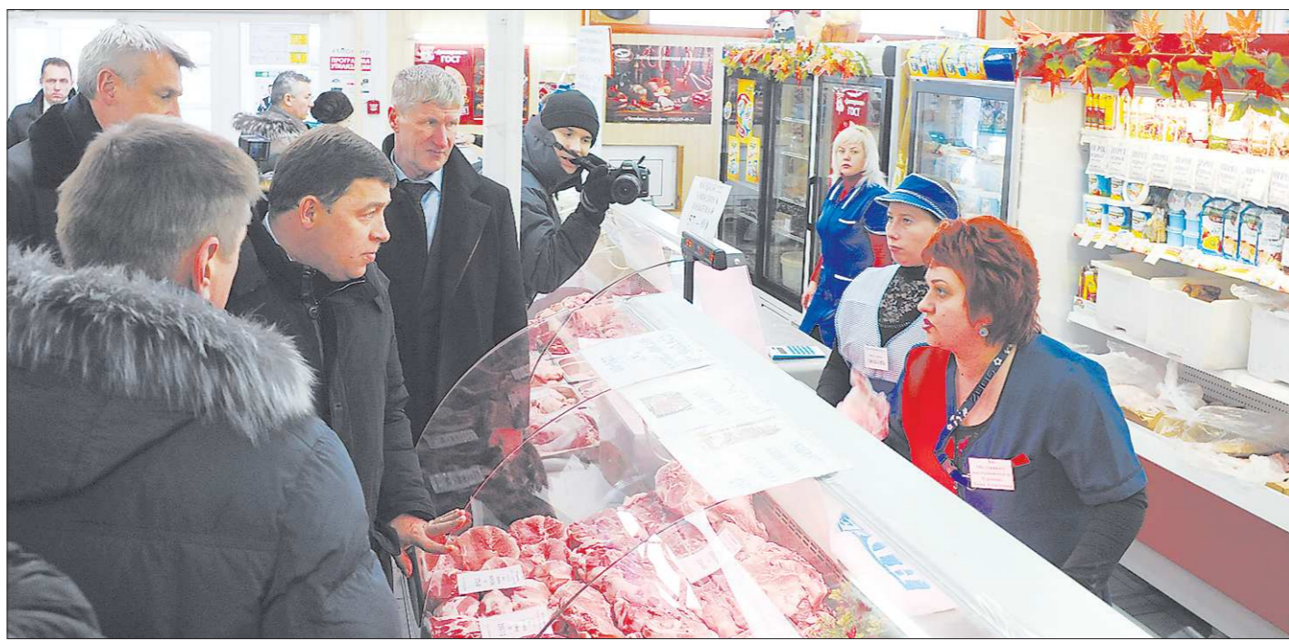
Продавцы тагильских магазинов сетуют, что покупательная способность местного населения растёт не так быстро, как хотелось бы

Участники не обошли вниманием коммунальные проблемы и дорожное строительство. Сейчас в городе 60 про-