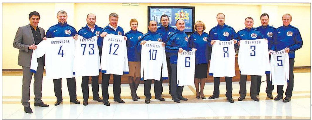
Сборная Законодательного Собрания и её болельщики демонстрируют новую спортивную форму