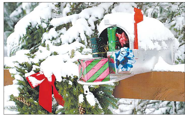
Больше всего на свете дети мечтают о новогодней ёлке и подарках от Деда Мороза. Обидно, если то или другое будет испорчено