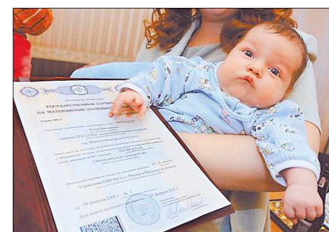
Полную версию «Прямой линии» читайте на сайте «ОГ» www.oblgazeta.ru

Закон на получение сертификата в связи с рождением второго, третьего или последующего ребёнка вступил в силу с 1 января 2007 года.