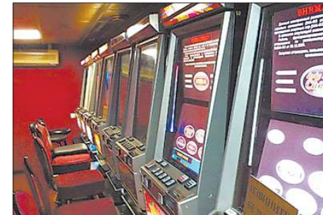
За несколько последних дней в Октябрьском районе Екатеринбурга изъяли 65 игровых автоматов, в Кировском — 17