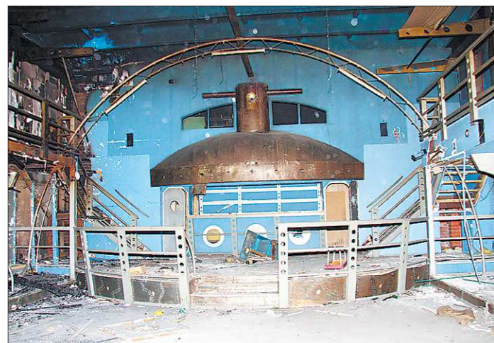
Тагильские чиновники обещают, что с разрухой на месте бывшего танцпола скоро будет покончено