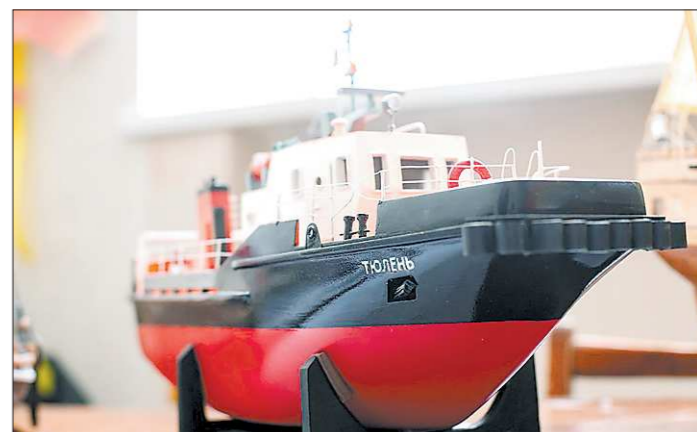
Сборка стендовой модели может занимать от нескольких дней до нескольких месяцев

УЧРЕДИТЕЛИ И ИЗДАТЕЛИ: Губернатор Свердловской области, Законодательное Собрание Свердловской области. Адрес: 620031, г. Екатеринбург, пл. Октябрьская, 1