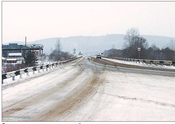
Отремонтированное по новой технологии дорожное покрытие может служить в полтора-два раза дольше

Секрет долговечности этого дорожного покрытия