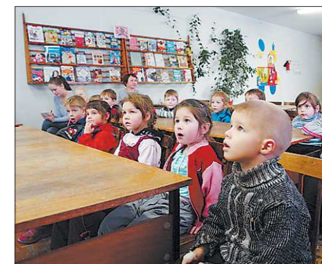
«В серебряном поле лазерный орёл с золотыми глазами и диадемой...» — описание карпинского герба заворжило малышей

В библиотеке детства и юношества в Карпинске прошёл праздник, посвящённый истории города, пишет газета «Вечерний Карпинск».