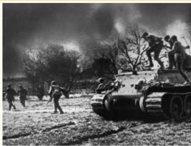
Контрудар советских войск

В Московской битве была одержана крупная победа над немецко-фашистской армией и развеян миф о ее непобедимости, окончательно сорван план молниеносной войны и достигнут решительный поворот событий в пользу СССР, оказавший большое влияние на дальнейший ход войны.