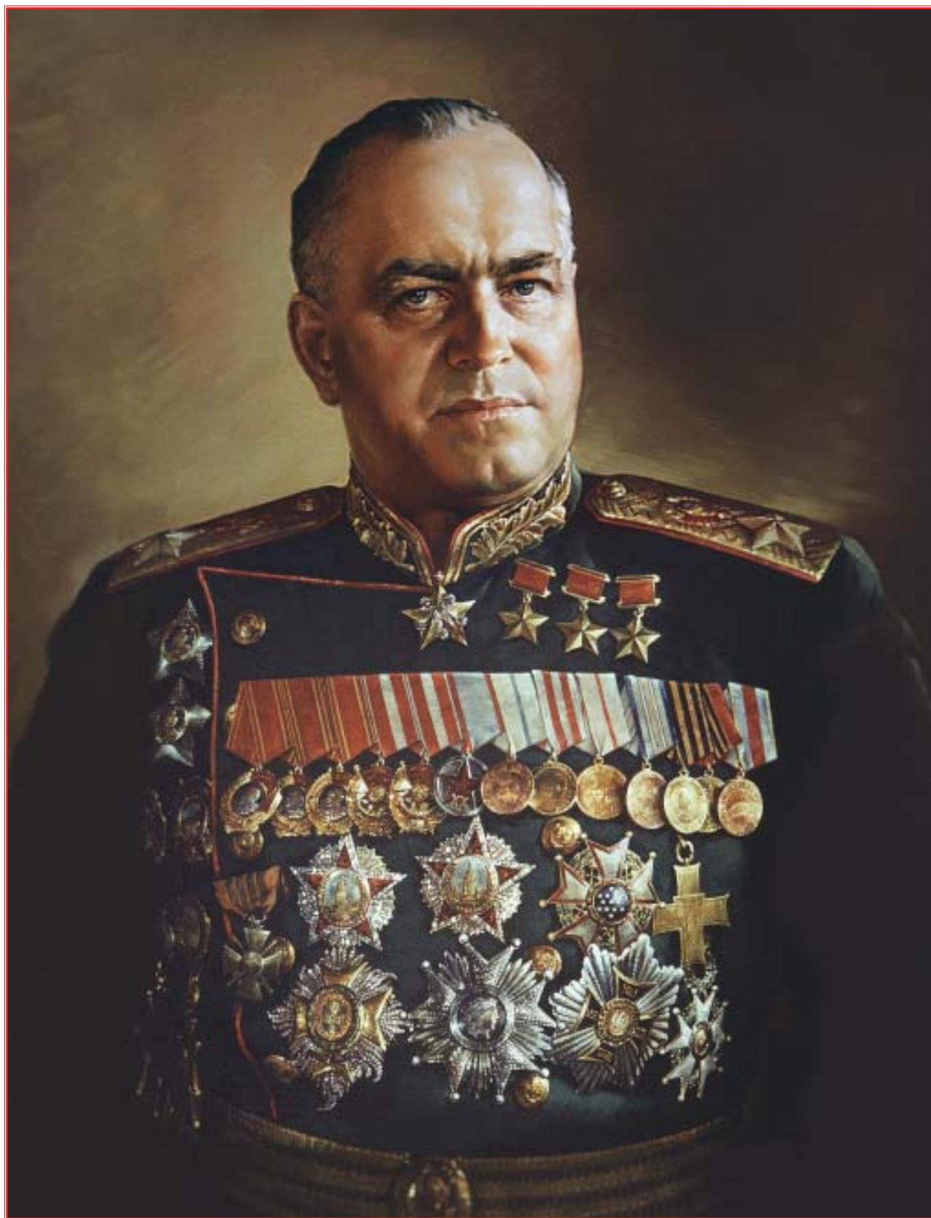
"Портрет Г.К. Жукова". Художник С.Н. Присекин. 1989 г.