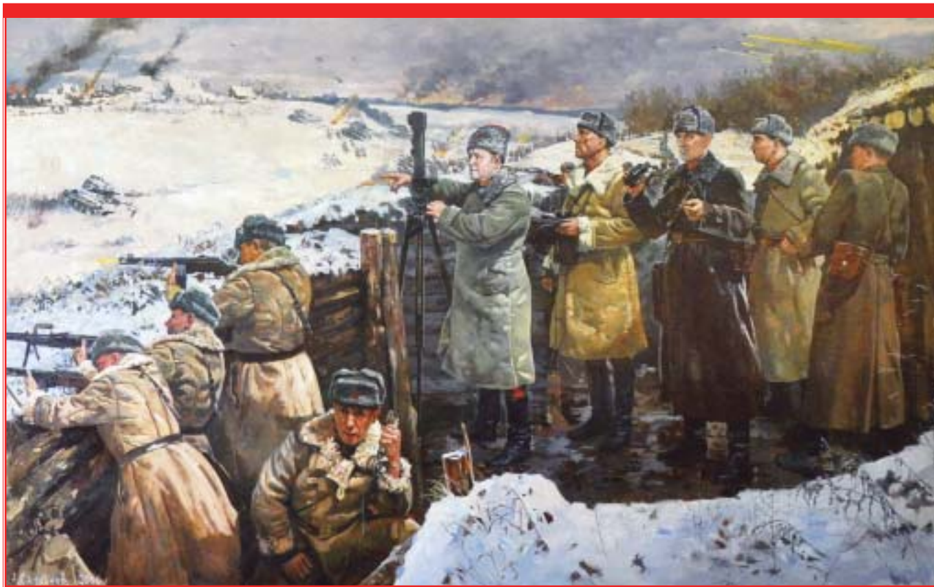
“Москву удержим!”. Художник А.М. Самсонов. 2006 г.

В октябре 1941 года – апреле 1942 года на полях Подмосковья и близлежащих к Москве областей была заложена прочная основа для последующего разгрома фашистской Германии, вероломно напавшей на рассвете 22 июня 1941 года на Советский Союз. 80 лет назад были продемонстрированы стойкость, мужество и героизм воинов Красной Армии и москвичей в защите Москвы, позволившие советскому народу получить необходимое время для развертывания в полном масштабе военной экономики, мобилизации всех ресурсов на разгром врага.