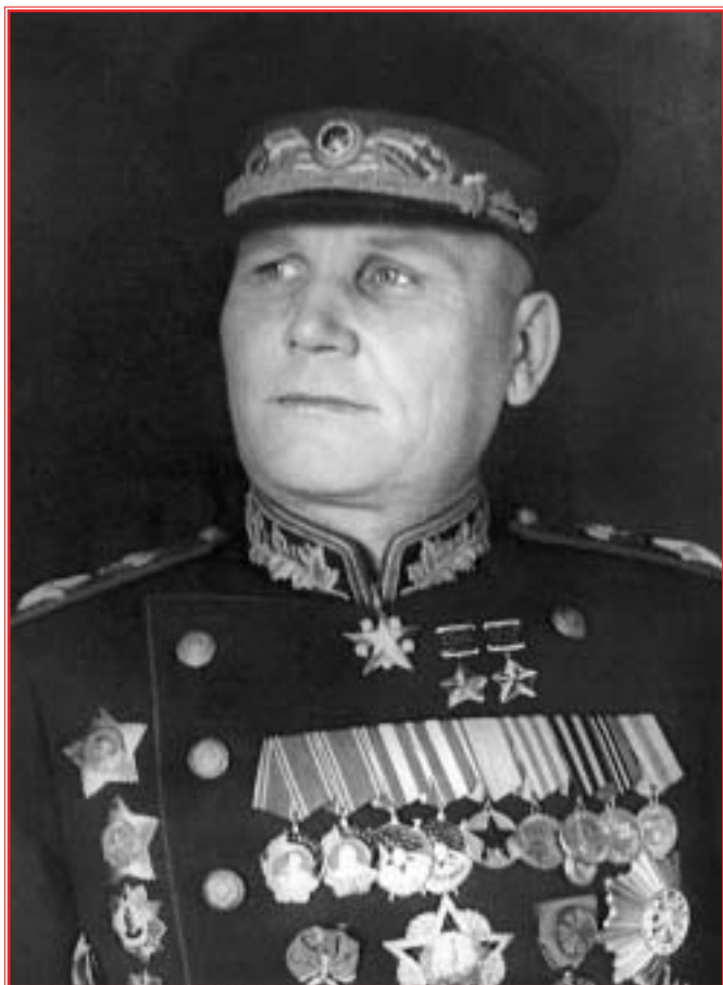
Иван Степанович Конев