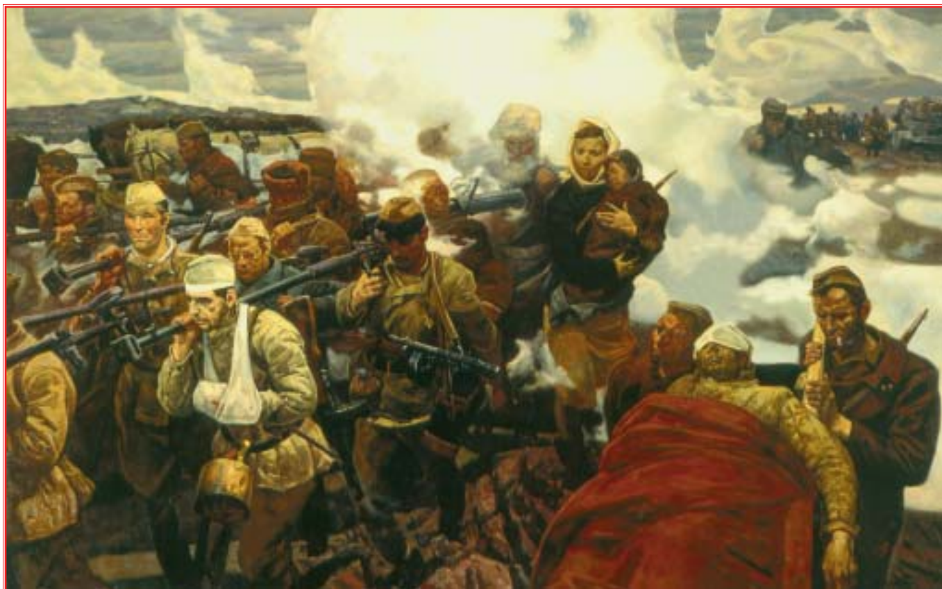
“В боях за Отчизну”. Художник М.И. Самсонов. 1987 г.