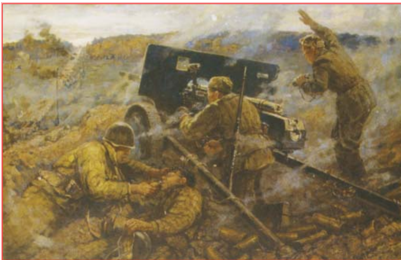
“Бой артиллеристов на Минском шоссе”. Художник М.А. Ананьев. 1962 г.