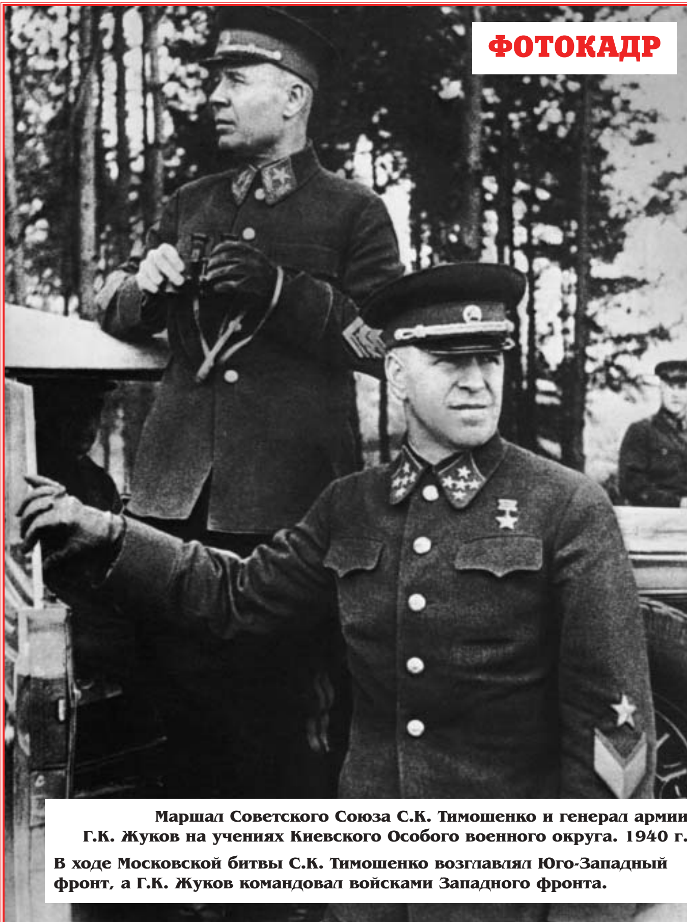
Маршал Советского Союза С.К. Тимошенко и генерал армии Г.К. Жуков на учениях Киевского Особого военного округа. 1940 г. В ходе Московской битвы С.К. Тимошенко возглавлял Юго-Западный фронт, а Г.К. Жуков командовал войсками Западного фронта.