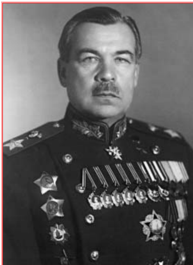
Леонид Александрович Говоров

ников. Уже в оборонительный период в основу цели и замысла фронтовых оборонительных операций были положены решительность и активность. В ходе оборонительных операций определились следующие тенденции, ведущие к успеху: заблаговременная подготовка оборонительных рубежей и занятие их войсками, совершенствование оперативного построения за счет увеличения его глубины, создания сильных вторых эшелонов и резервов, повышение роли противотанковой обороны и инженерного оборудования местности, сосредоточение основных усилий обороняющихся войск на направлениях главных ударов врага, увеличение активности и маневренности обороны. Эти тенденции развивались в последующих операциях.