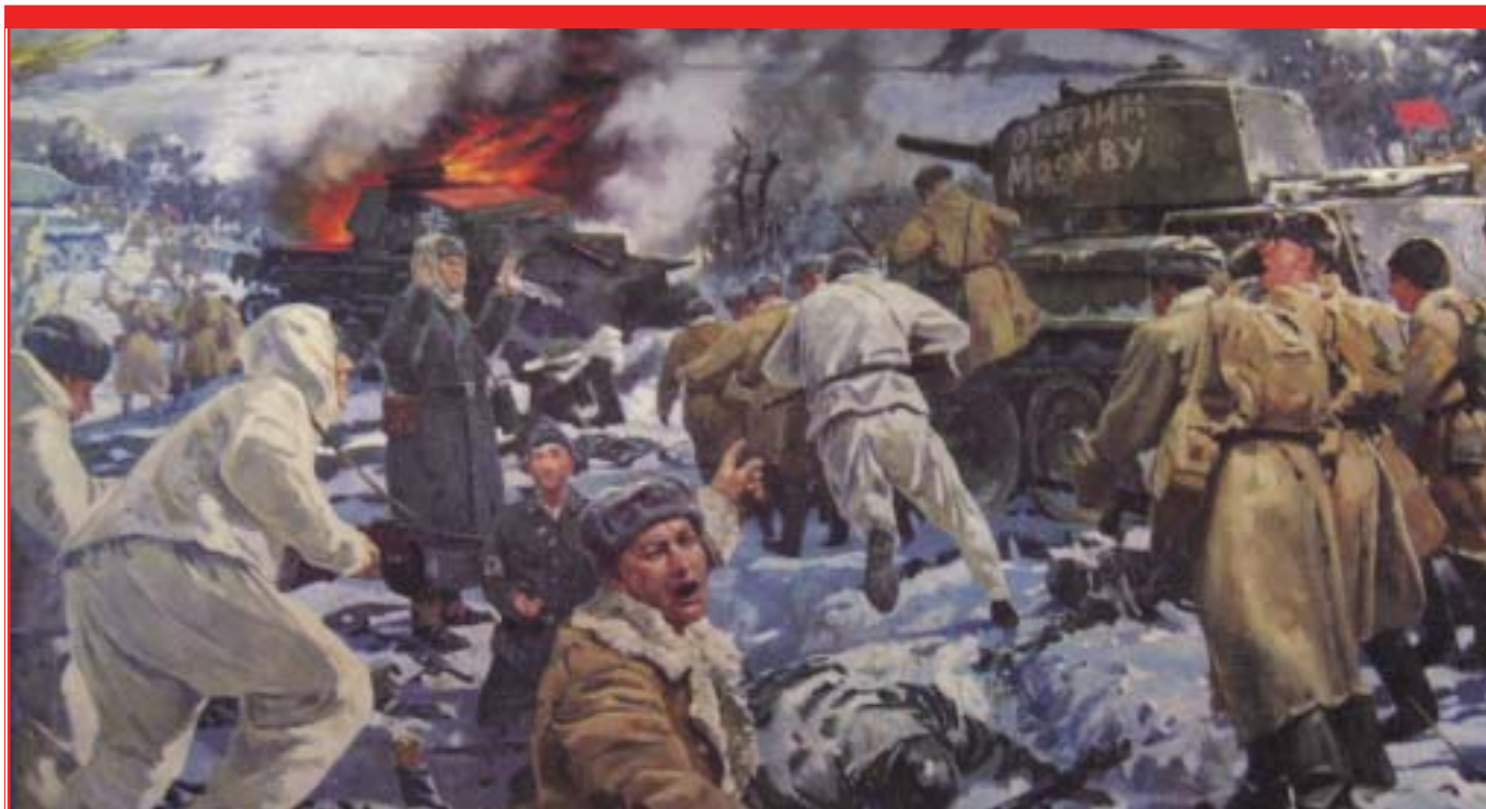
"Битва за Москву". Художник А.М. Самсонов

Осуществляется Московским центром "Патриот. Спорт".