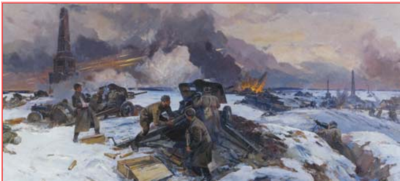
“Бой на Бородинском поле 15 октября 1941 года”. Художник Ф.П. Усыпенко. 1971 г.

миями. После войны на ответств. должн. в войсках: команд. 23-й, 25-й (Приморск. воен. округ), 39-й (Дальневост. воен. округ) армиями, первый зам. команд. войсками Прибалт. воен. округа. В конце апр. 1958 г. прикомандирован в научно-исслед. группу при Генштабе. Награжден 2 орд. Ленина, 3 орд. Кр. Знамени, орд. Суворова 1-й степ., Отеч. войны 1-й степ. Умер 1 окт. 1958 г., похоронен на Казачьем кладбище Александро-Невской лавры в Ленинграде (Санкт-Петербург).