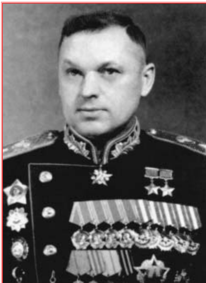
Константин Константинович Рокоссовский

руя мужество, отвагу, образцовое исполнение воинского долга. Именно так вели себя в сражениях командармы К.И. Ракутин, М.Г. Ефремов, М.Ф. Лукин, каждый из которых удостоился героического звания за подвиги у стен столицы. Ракутину посмертно было присвоено звание Героя Советского Союза, а Ефремову и Лукину, также посмертно, – звание Героя Российской Федерации.