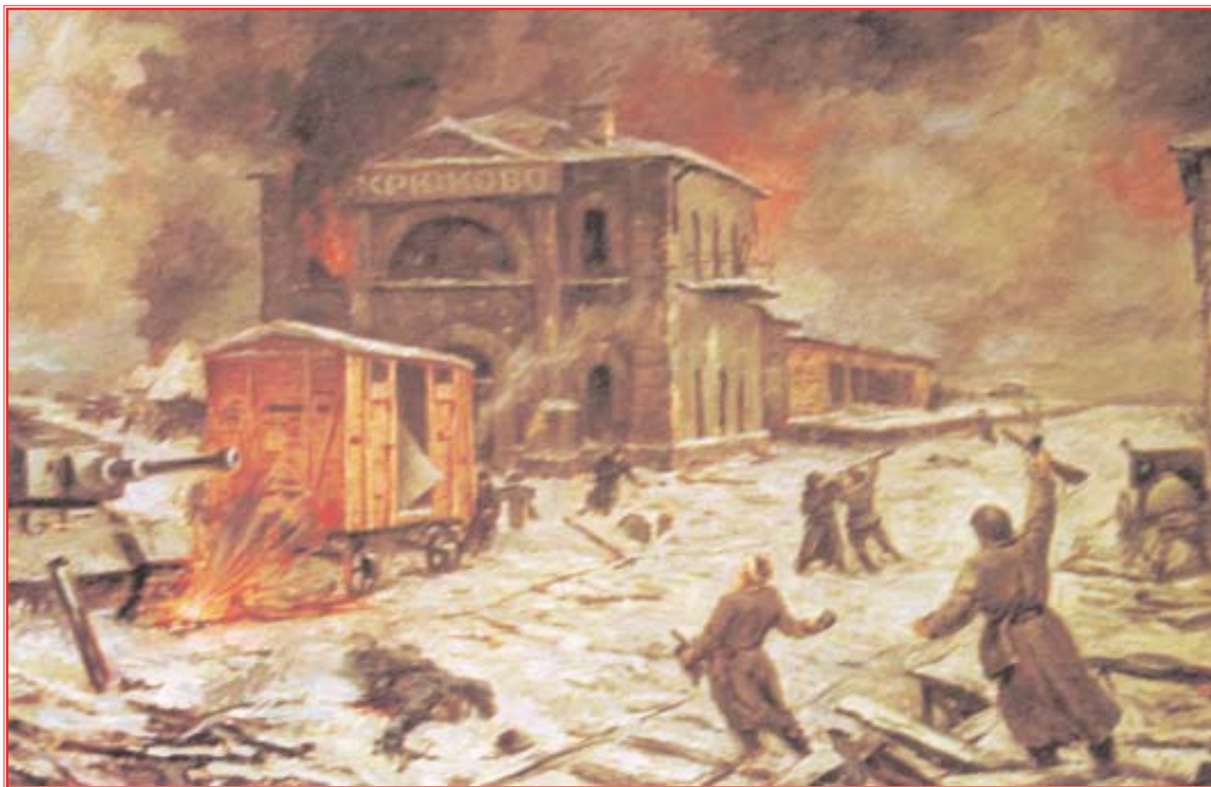
"Бой за станцию Крюково". Художник О.Г. Кузнецов. 1995 г.