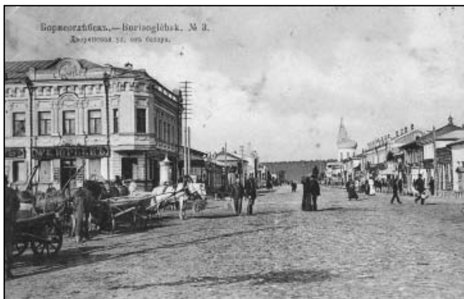
Дворянская улица от базара