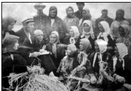
Сценка из жизни колхозников. 1930-е годы. Снимок из музея.