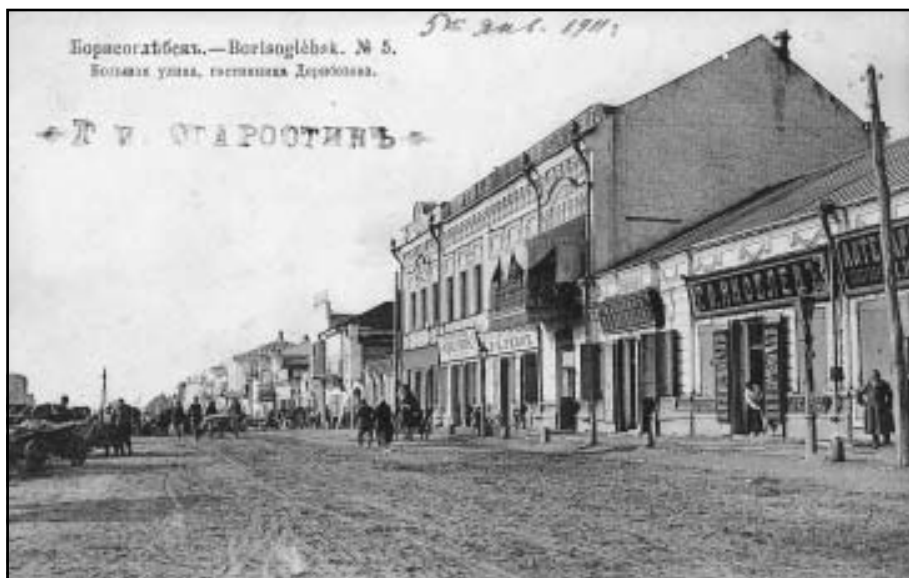
Большая улица, гостиница Дерибезова