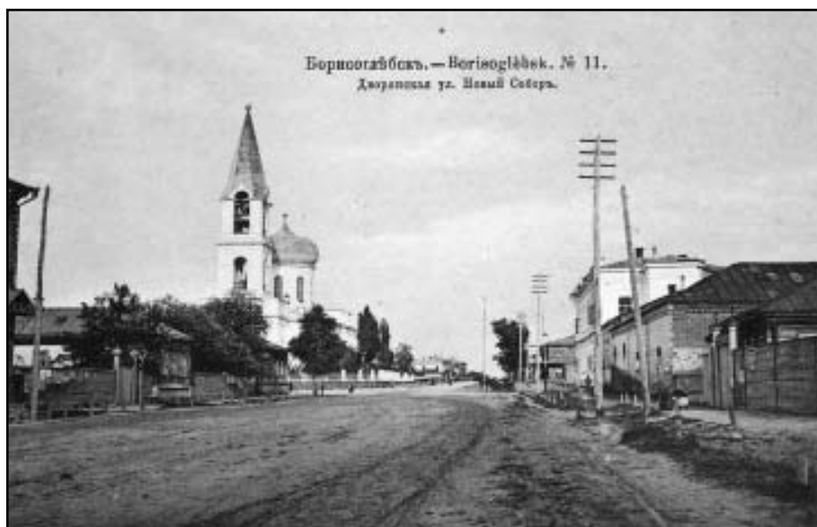
Дворянская улица, Новый Собор