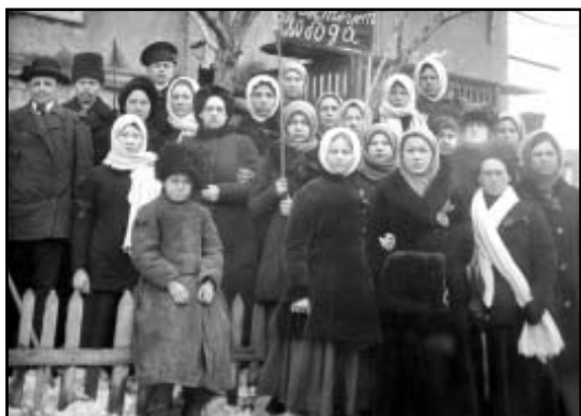
Фотография из фондов музея. 1920-е годы.