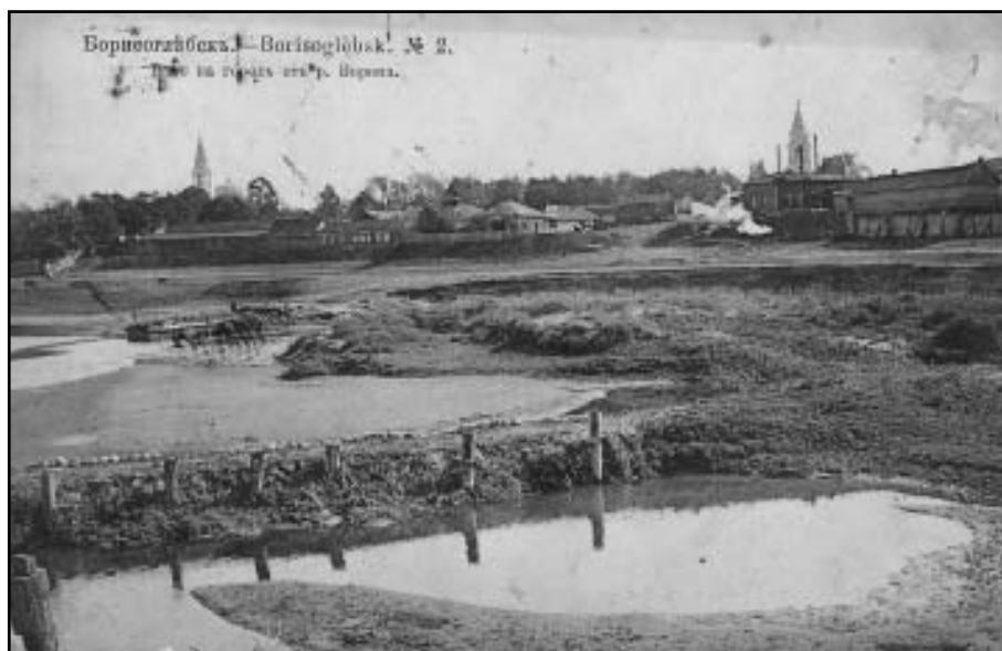
Вид на город от реки Ворона