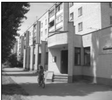
Центральная городская библиотека им. В. Кина