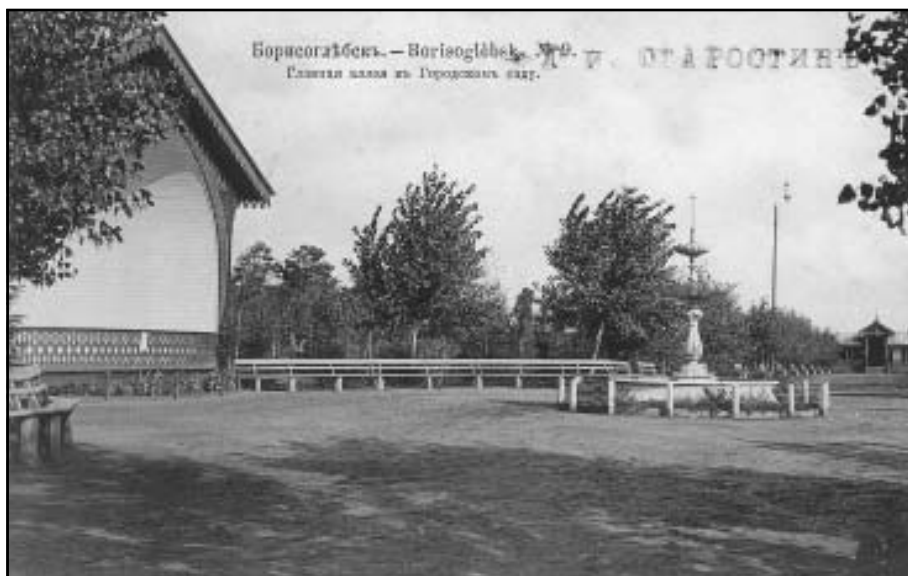
Главная аллея в Городском саду