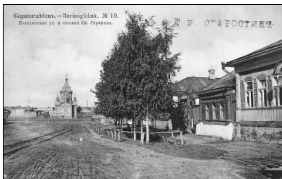
Поворинская улица и часовня Св. Серафима