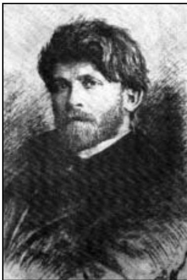
В.В. Матэ. Портрет А.П. Рябушкина

Живопись А.П. Рябушкина необыкновенно нарядна и имеет изысканное цветовое звучание, роднящее ее с русской иконой, фреской и народным искусством. И в этом цветовом звучании присутствует понимание христианской символики цвета. Многие исторические полотна художника воспринимаются как некое красочное видение, возникшее пе-