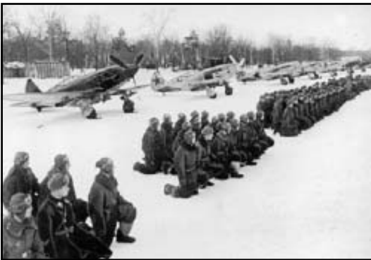
В годы Великой Отечественной войны