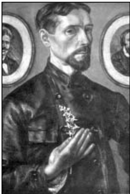
Николай Чернышев. Автопортрет. 1918 год

Не сразу он нашел тему, которая отвечала бы задачам времени, в которой его собственное дарование проявилось бы достаточно полно и оригинально. «Глубоким источником, кристально чистым родником», питавшим творчество Чернышева в течение жизни, стала поэзия юности. Художник был первым, кому открылась столь выразительно и глубоко эта удивительная красота, и кто сумел целомудренно воплотить ее в замечательных полотнах и рисунках. Через все творчество Н.М. Чернышева проходит образ девочки, хрупкой и нежной, полной строгости, чистоты и грации, еще не осознающей своей красоты.