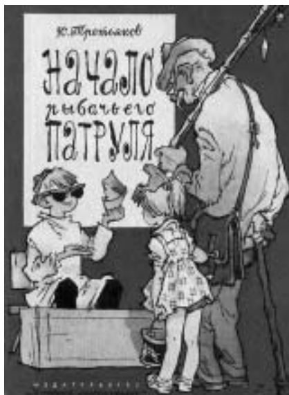
Книга Юрия Третьякова «Начало рыбацкого патруля»