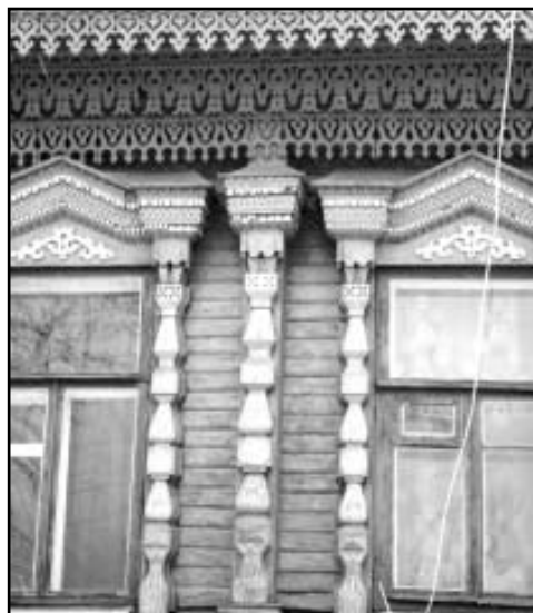
Дом по улице К. Маркса. Геометрические и растительные символы в орнаменте подзора, фриза и наличников

В декоре борисоглебского орнаментального чугунного литья (в козырьках над парадным входом в доме) часто встречаются круг в квадрате, в кругу — крест, то есть наблюдается совмещение