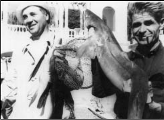
М.И. Неделин на отдыхе в Сочи. 1958 год

племянницу. Юноша, чтобы как-то помочь матери и уменьшить расходы семьи (стоимость обучения в Липецком реальном училище была высокой и доходила до 80—100 рублей в год), начиная с третьего класса, стал заниматься репетиторством.