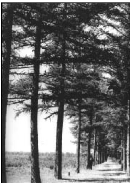
Знаменитая аллея Корнаковского. Фото 60-х годов XX века