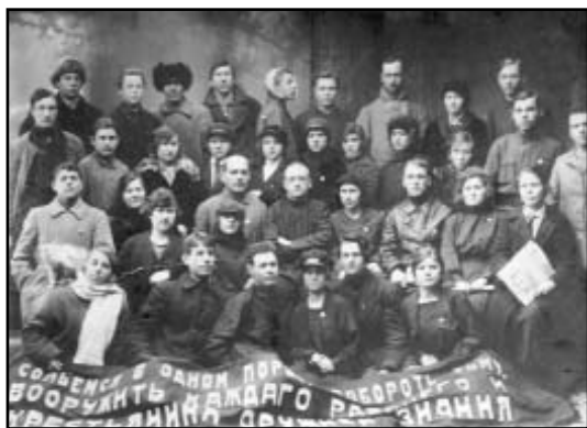
Групповая фотография в фотопавильоне. 1920-е годы.