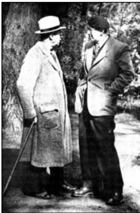
С.С. Прокофьев и Н.П. Аносов. Николина Гора. 1949 г.