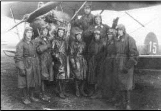
Учлеты 2-й ВШЛ. Борисоглебск. 1930 г.