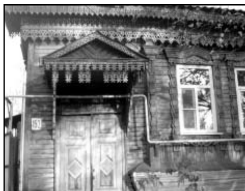
Косые кресты на наличниках, лопатках, фронтоне козырька; переплетения, скрещивания на подзорах карниза и фриза дома по улице Свободы

символов, объединение их, по словам В. Стасова, в одну фразу. Происходит превращение простого символа в сложный знак, определенным образом структурированный.