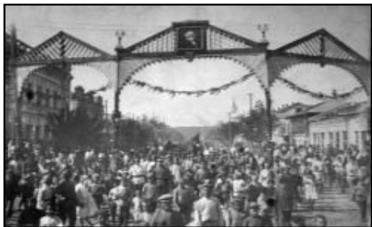
Манифестация 1921 года.