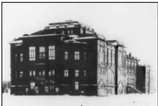
Какое-то время в Народном доме располагался кинотеатр «Вулкан»

Еще один сюрприз подарила уцелевшая среди документов ячейки ВКП(б) при уездном отделе народного образования (фонд № 1357) выписка из протокола № 4 заседания Президиума Уисполкома. 9 октября 1926 года на нем слушали вопрос об эксплуатации театров, находящихся в Борисоглебске. Обнаружив «наличие уголовно наказуемых деяний со стороны администраторов театров», президиум постановил передать дело помпрокурора для дальнейшего расследования. О каких театрах во множественном числе идет речь? Вот из