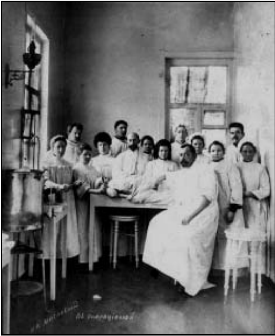
В операционной земской больницы г. Борисоглебска (1908-1910 гг.)