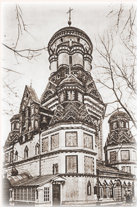
Церковь в селе Дьякове