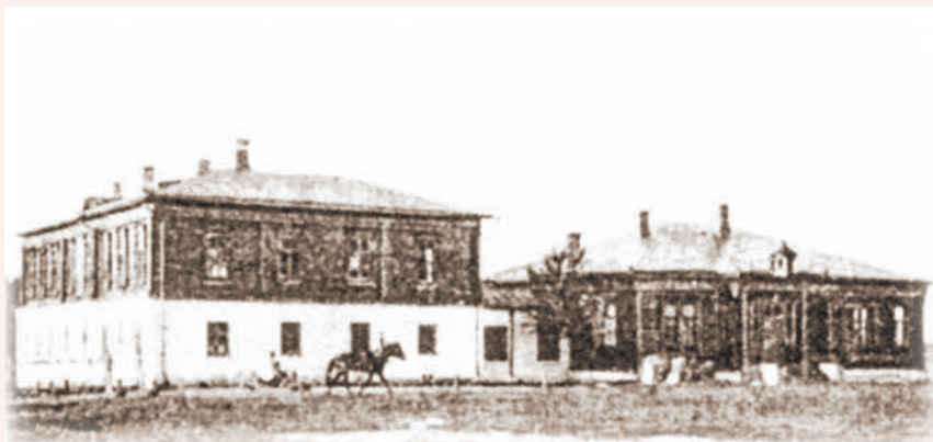
Второклассная церковно-приходская школа при Гуслицком Преображенском монастыре

или иначе проявленной ими склонности в духовные школы, должны и выходить из стен заведения чистыми и невинными юношами, не наученными в общежитии дурным привычкам и порокам: курению табаку, пьянству, сквернословию, кощунственным козлогласованиям, несоблюдению постов, лживости. На эти „мелочи“ не обращают воспитатели должного внимания, быть может, по убеждениям своим не придавая им серьезного значения, а между тем привитые еще на школьной скамье привычки эти почти всегда лишь с величайшим трудом искореняются, требуя от возымевших желание бороться с ними не для всех возможного напряжения силы воли, обуславливающего победу, при усиленной притом молитве о благодатной помощи свыше. Отрицательные же навыки эти несовместимы с благотворно-полезной деятельностью иерея Божия. <...>