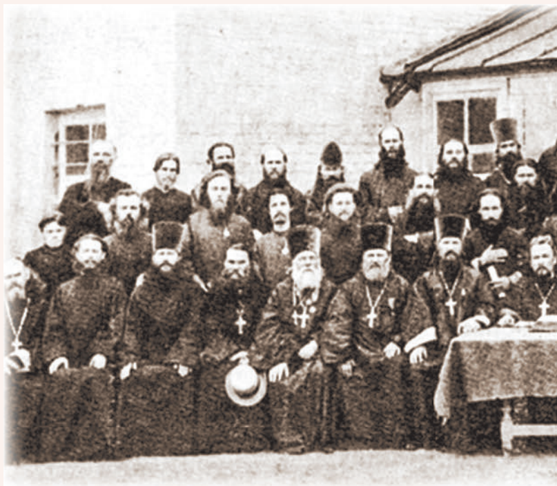
Первый всероссийский миссионерский съезд. Москва, 1887 год

И вот раскрылись на съезде наши собственные язвы, к которым надо было отнестись с должным вниманием. Тут-то и начал я хлопотать о назначении жалования беднейшему сельскому духовенству, особенно в зараженных