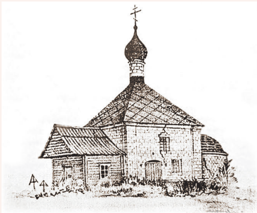
Троицкая церковь в селе Борисове, 1880-е годы