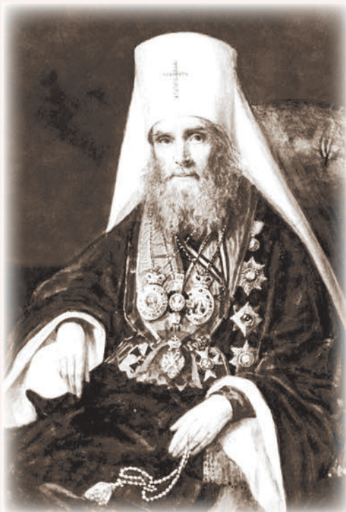
Митрополит Московский Филарет (Дроздов)

ларета (Дроздова) на сбор средств для постройки нового храма. Он поместил объявление о сборе пожертвований в газетах, и затем сам отправился в Москву собирать деньги на строительство. К 1868 году была собрана достаточная для начала строительства сумма, и отец Николай обратился к прихожанам, чтобы они выбрали место для храма, и те выбрали место у южной стороны существующего храма, недалеко от пруда. Однако, когда начались работы, прихожане стали возражать, говоря, что это место неудобно по причине близости воды. От предложения возводить храм на своей земле они категорически отказались, заявив, что если уж отец Николай затеялся со строительством церкви, то и строить должен на своей усадьбе, рядом со своим домом. Начавшееся строительство продвигалось