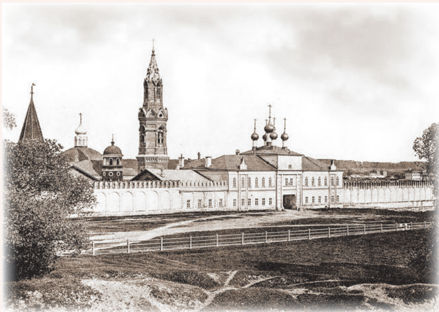
Никольский единоверческий мужской монастырь