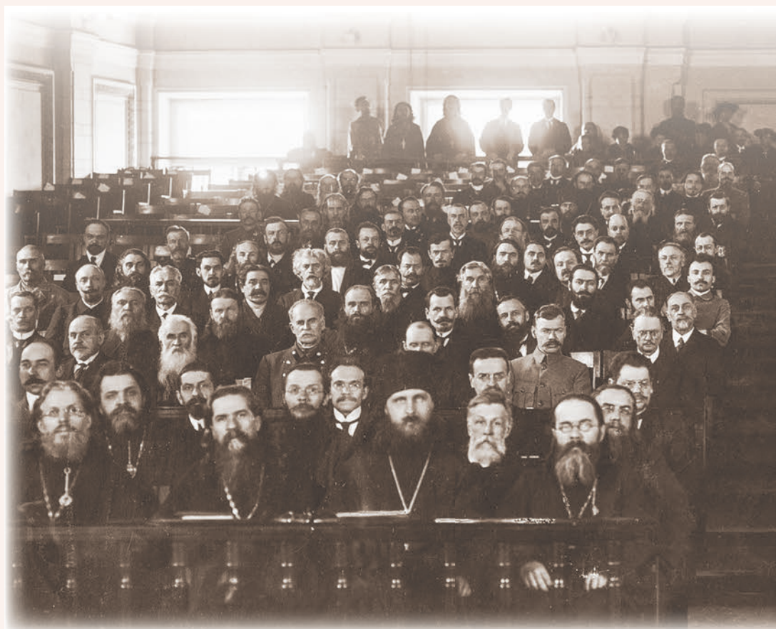
Члены Поместного Собора Российской Православной Церкви.

Большую полемику на Соборе вызвали проекты постановлений о церковном браке и в особенности предлагавшие основания для развода. И более всего то предложение, что основанием для развода могут стать «нанесения... другим супругом неоднократных тяжких оскорблений и вообще причинения ему расшатывающих самые основы семьи постоянных нравственных истязаний» 222 . Многие члены Собора сочли эту статью противоречащей христианскому вероучению, делающей возможным расторгать