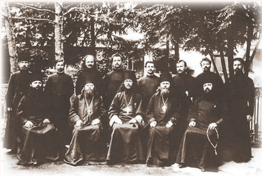
Братия Николо-Перервинского монастыря