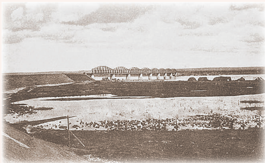
Мост через реку Каму