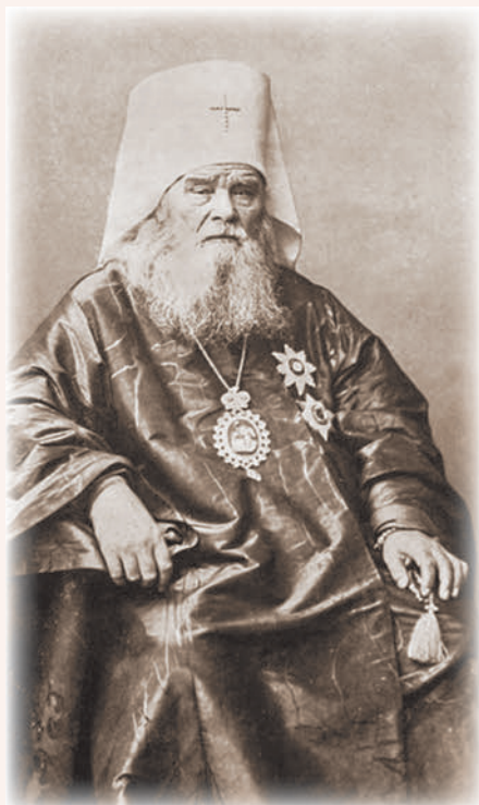
Митрополит Московский Иннокентий (Вениаминов)