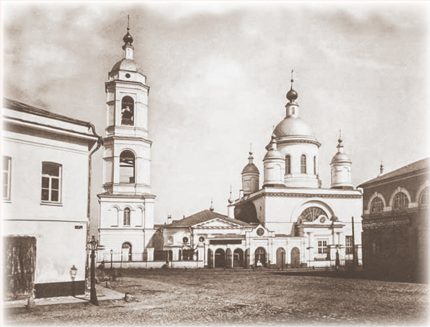
Церковь преподобного Сергия в Рогожской слободе

повалилась на постель, крича в исступлении: „Что ты, еретик, надо мной наделал?! Куда ты пошел! Еретик ты, щепотник!“ и т. д., и т. д. Отец Николай старался ее успокоить, но она стала ругать и его. Я в это время из избы вышел, а отец Николай остался и продолжал успокаивать пришедшую в какое-то исступление мою мать. Тут возвратился домой и отец, — слышу, и он стал батюшку бранить и кричать на него. Но мало-помалу батюшке все-таки удалось несколько успокоить их. Он вышел из нашего дома уже около одиннадцати часов вечера. Простившись с батюшкой и поблагодарив его за участие ко мне, я отправился ночевать к своему товарищу. И так дня четыре ночевал я кое-где у соседей, а питал меня в это время отец Николай, — дай Бог ему здоровья! Он меня успокаивал и ободрял, приводя из Священного Писания соответственные моему положению места. На пятый уже день, утром,