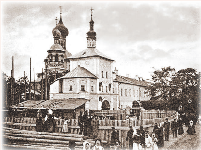
Общий вид Николо-Перервинского монастыря и место постройки нового храма