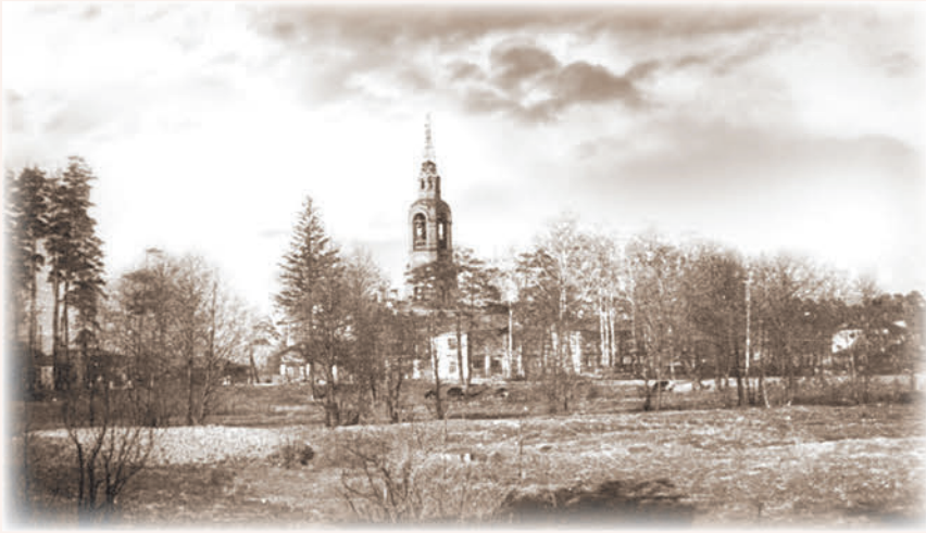
Гуслицкий Спасо-Преображенский монастырь

Витебской губернии*, в селах Владимирской губернии, расположенных вблизи Гуслицкого Спасо-Преображенского монастыря.