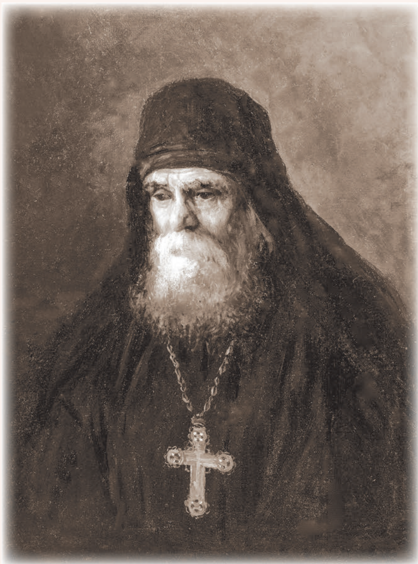
Архимандрит Павел (Леднев). Художник А. Корольков