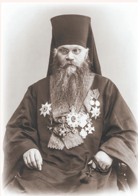
Епископ Тихон (Никаноров)

25 ноября 1901 года новый настоятель Троицкого храма, священник Василий Богоявленский, сознавая всю актуальность проблемы просвещения раскольников, направил прошение митрополиту Московскому и Коломенскому Владимиру (Богоявленскому), выразив в нем беспокойство тем, что множество людей находятся в состоянии отпадения от Церкви. «Возможно ли в ближайшее время решить