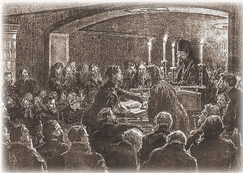
Беседа епископа Тихона (стоит на кафедре) и православного духовенства со старообрядцами в доме Касичкина. Рисунок К. А. Савицкого