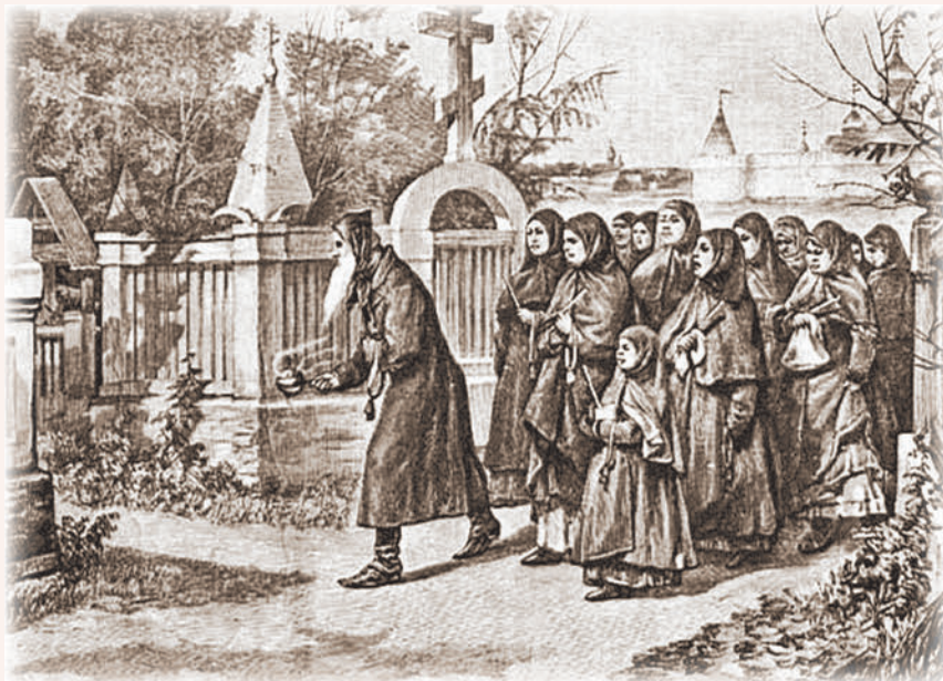
Читалки и уставщик федосеевского толка, служащие панихиду на Преображенском кладбище