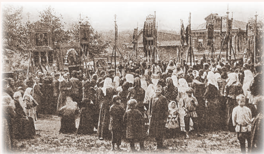
Молебен старообрядцев во время крестного хода в селе Борисове