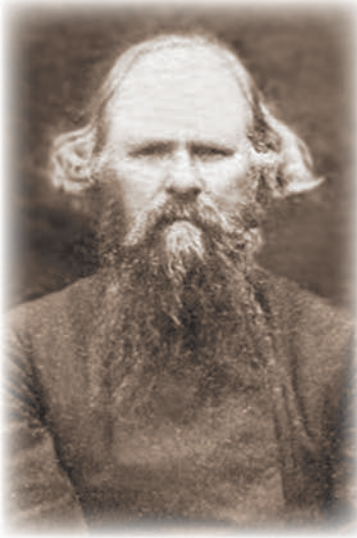
И. П. Ломакин

был рьяным защитником своего упования; из деревни в деревню возили его богачи раскольники для возражения миссионерам. После многих таких бесед с миссионерами Феодор наконец пришел к убеждению, что „беда раскольникам, что Церковь права!..“ „Особенно сильно поколебал мои убеждения, — говорит сам отец Феодор, — миссионер И. П. Ломакин 118 , после беседы с которым я решил бросить все, ехать в Москву и на