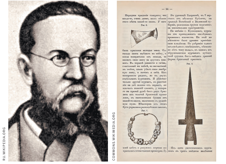
В 1890 году за авторством Сементовского вышла уникальная монография «Витебская губерния, историко-географический и статистический обзор, история, природа, население, просвещение».

Белорусский язык Сементовский в духе своего времени именует «наречием», но у читателя его труда складывается устойчивое впечатление, что это язык вполне са-