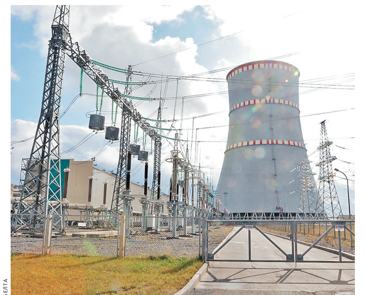
Первый энергоблок АЭС планируется запустить в первом квартале 2020 года.