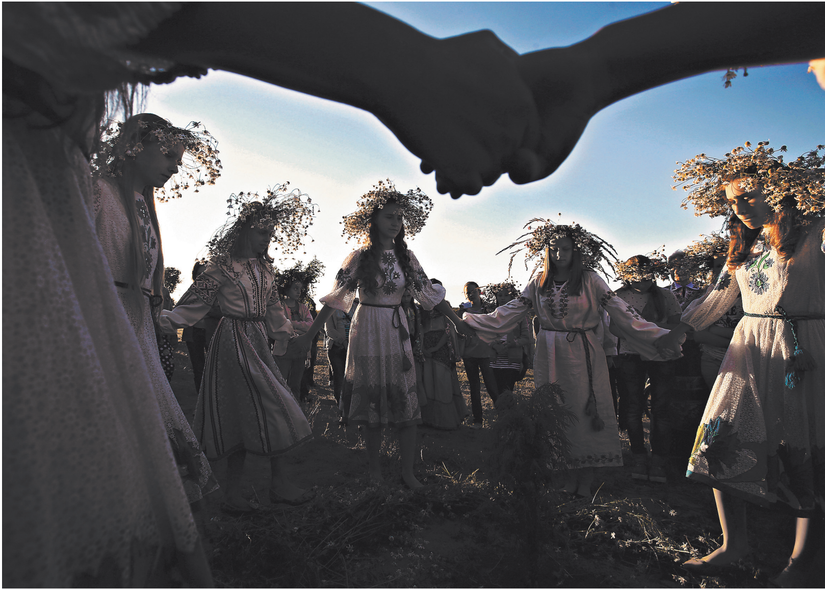
На Купалье в Беларуси и России собирают целебные травы и цветы, плетут венки, прыгают через костер, гадают о будущем...

1 Самые многонедельные праздники у россиян приходятся на первый квартал будущего года: это и новогодние каникулы, и День защитника Отечества 23 февраля, и Международный женский день 8 марта.