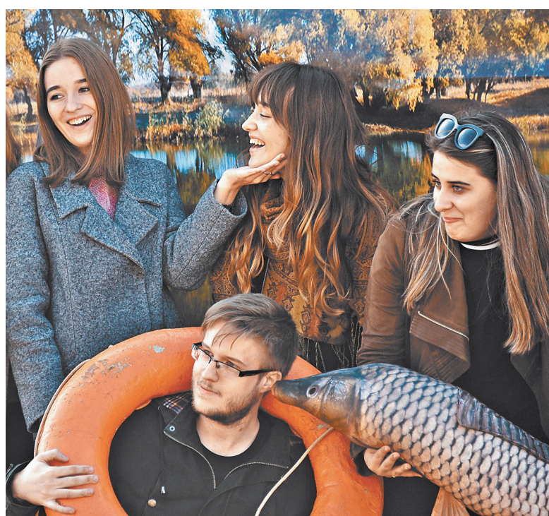
Туристов познакомит с традиционной культурой этого рыбацкого села и покажут, как вырастить осетра.