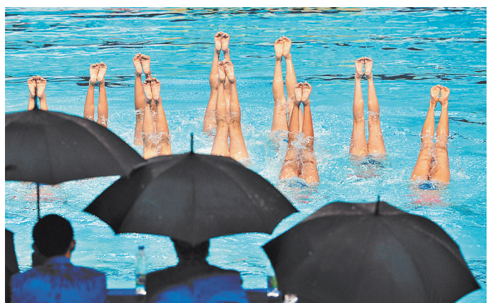
Отсутствие справки накладывает дополнительную ответственность на администрацию бассейна, тренера или инструктора.

—Было время, когда посещала бассейн. Но, посмотрев, что туда ходят и люди с грибковыми, кожными заболеваниями, отказалась от посещения. Мне сложно не думать об этом. А справка — это формальность. Сейчас много говорят про новые средства для очистки и обеззараживания воды в бассейнах. Но на деле чувствуется запах хлорки, это неприятно. Вот и получается: пойти хочется, но я себя останавливаю. Боюсь, что проблем может быть больше, чем пользы.