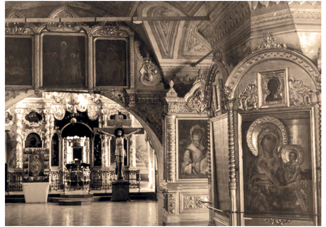
Палех. Интерьер Крестовоздвиженского кафедрального собора