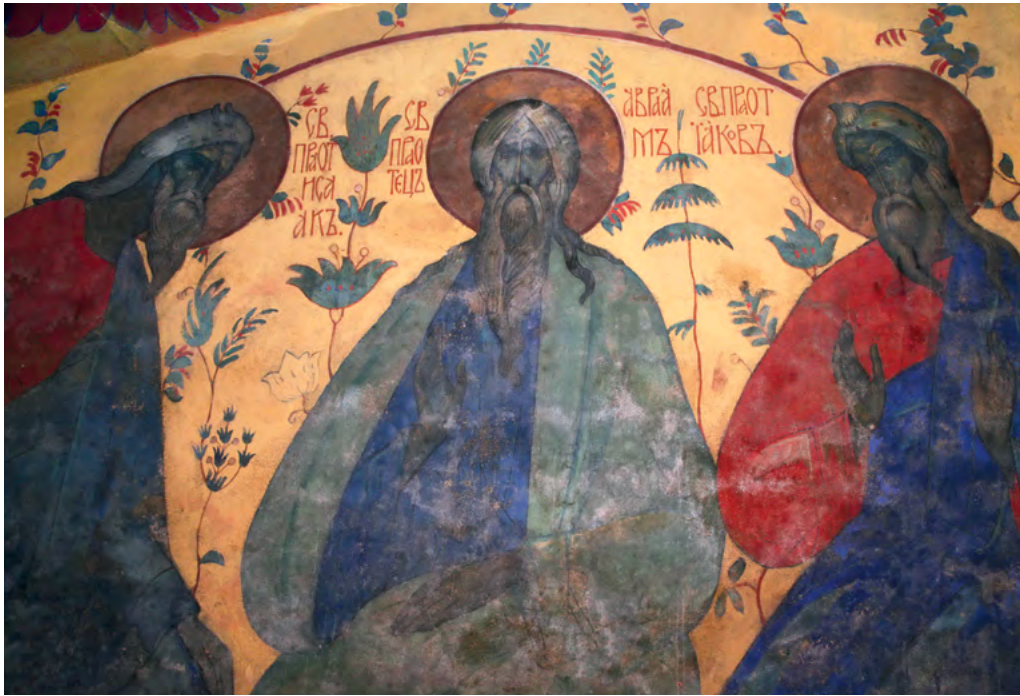
Фрагмент фрески усыпальницы Покровского собора в Марфо-Мариинской обители. Роспись П.Д. Корина

Я поздоровалась, ужасно стеснялась и не знала, что говорить, молчала. Он спросил, как меня зовут, сказал, что его зовут Павел Дмитриевич, что он будет меня учить иконописи. Покажет, как приготовить яйцо для писания, как “творить” краски на яйце. “Интересно творить краски”, — подумала я. Сперва показал манипуляции с яйцом: отделил желток от белка, желток слил в пустую скорлупу, разбавил чуть водой, добавил уксус, чтобы яйцо не портилось. Потом учитель взбалтывал содержимое скорлупы маленькой деревянной лопаточкой, затем перевернул лопаточку и черенком — раз — и проткнул скорлупу, жидкость тонкой струей лилась со дна в стаканчик. Я с таким любопытством глядела, как он ловко все это проделал. <...> “Ой как это интересно!” — сказала я, а он посмотрел на меня, улыбнулся. Так и начала заниматься с ним одна. Мне было почти шестнадцать лет, а ему двадцать четыре» 1 .