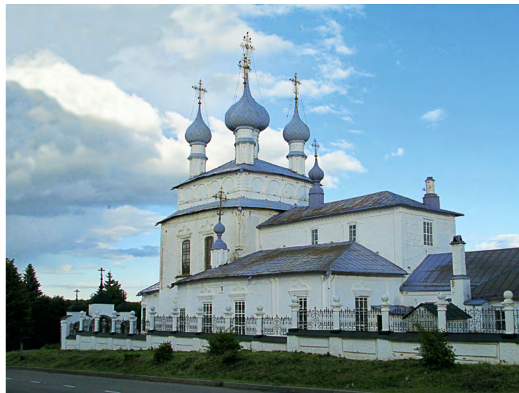
Палех. Крестовоздвиженский кафедральный собор