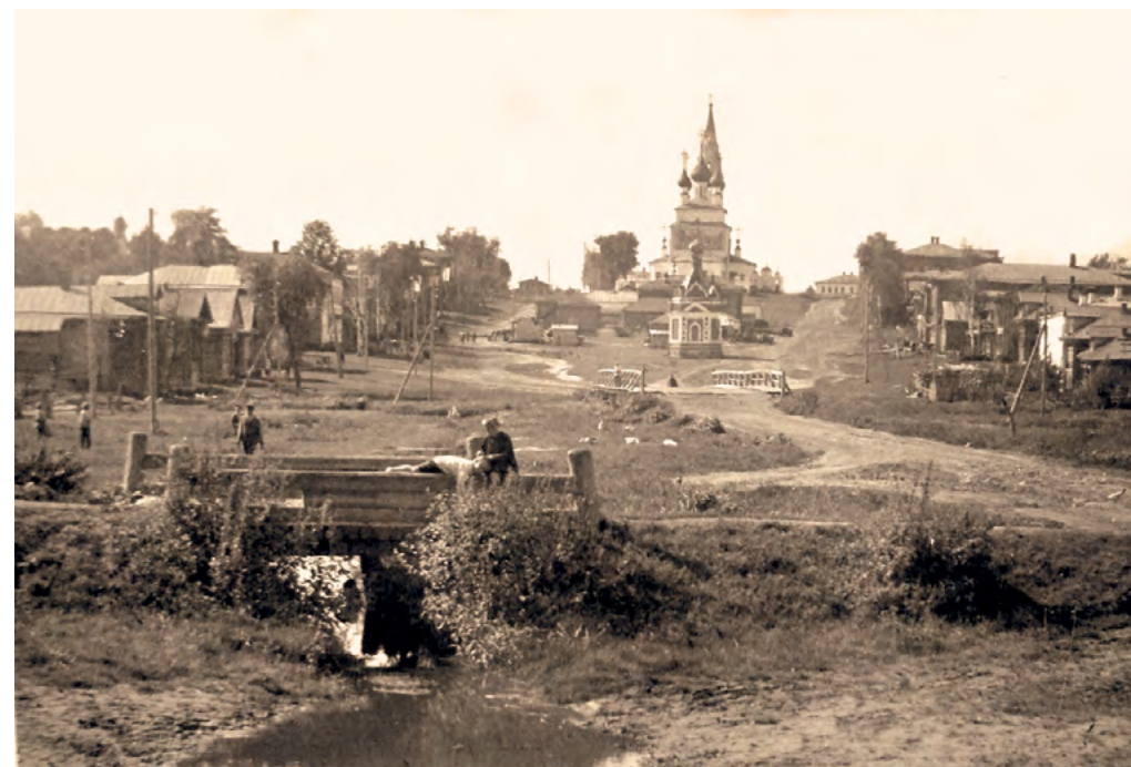
Палех. Вид на часовню во имя св. блгв. вел. князя Александра Невского

шим в ополчении Кузьмы Минина и князя Дмитрия Пожарского. До 1861 года село Палех принадлежало Бутурлиным.