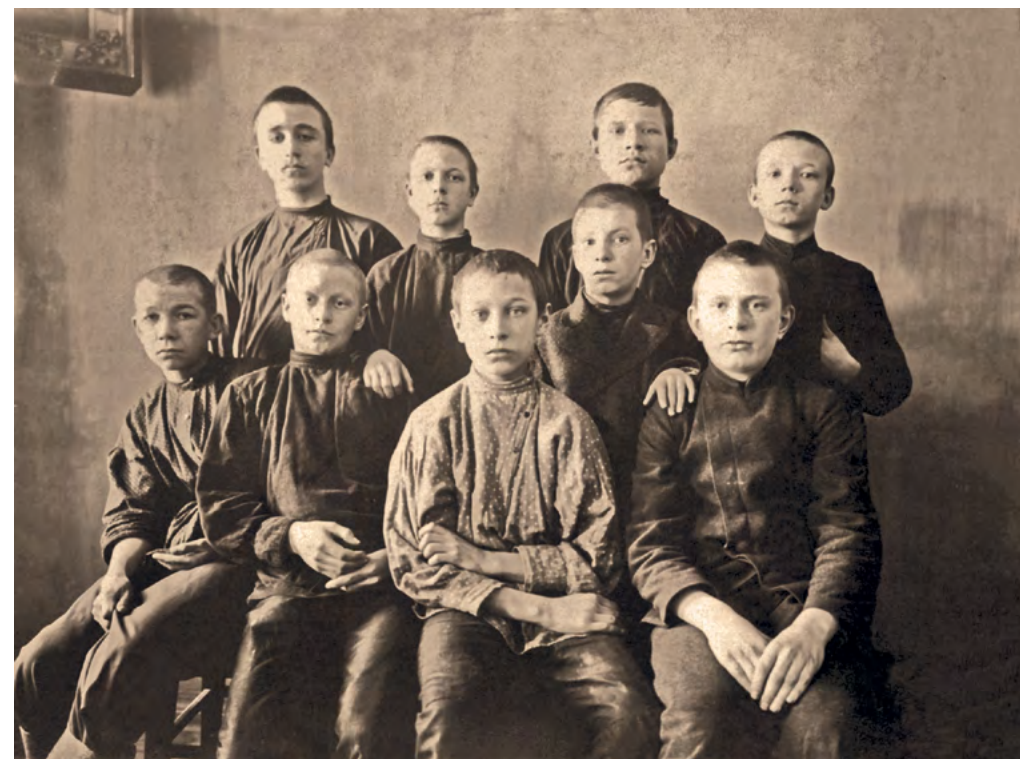
Ученики иконописной школы