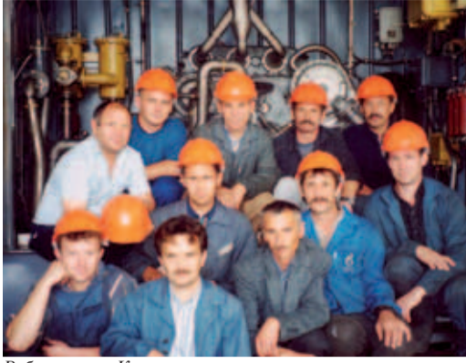
Рубеж веков. Коллектив участка по ремонту агрегатов ПТП «СГЭР» в Северном ЛПУМГ