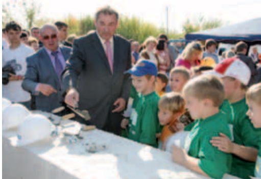
Владислав Третьяк на закладке ледового дворца «Кристалл»