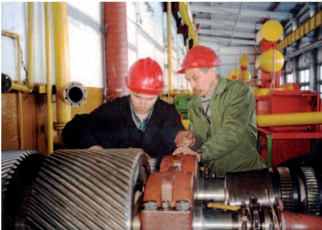
Рубеж веков. Ремонт агрегата ПТП СГЭР в Сергиевском ЛПУМГ