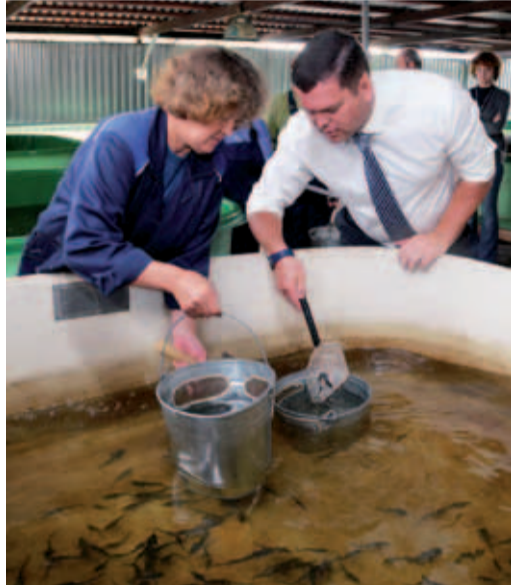
Выпуск молоди редких рыб