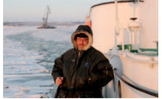
Кабель в любую погоду укладывают