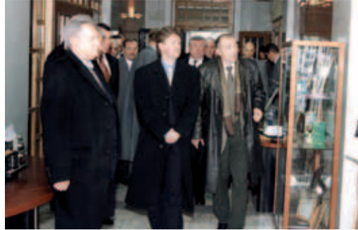
2001 год. Председатель Правления ПАО «Газпром» Алексей Миллер в «Самаратрансгазе»