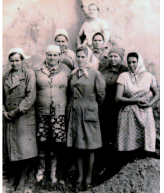
1940-е. Участницы строительства газопровода Бузу-руслан-Куйбышев