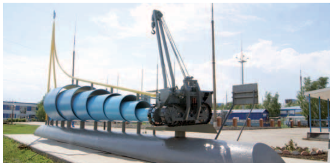
Юбилейная стела в Северном ЛПУМГ