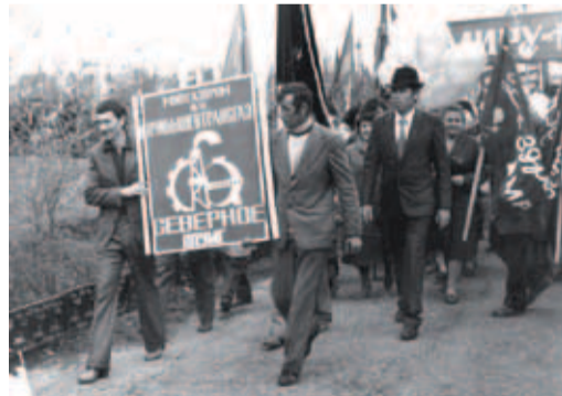
1980-е. Коллектив Северного ЛПУМГ