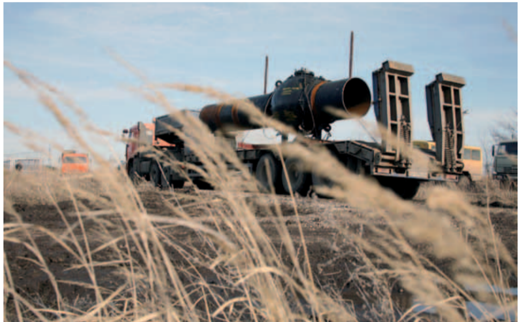
Газ и хлеб