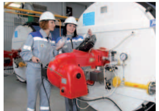
2000-е. Экологи за работой