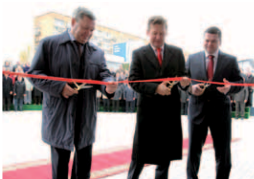
2012 год. Открытие АДК