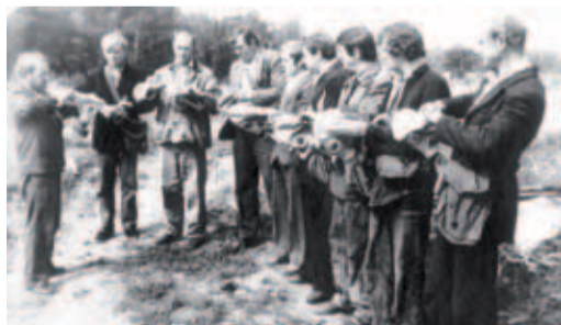
1970-е. Учения по гражданской обороне в Сызранском ЛПУМГ