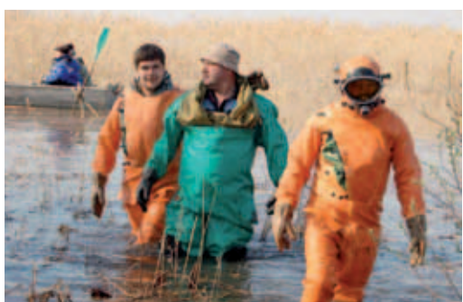
2010 год. Ремонт КЛС. Река Большой Черемшан. Димитровград