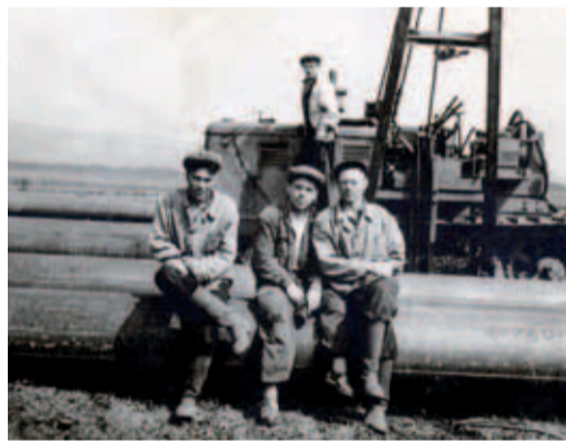
1950-е. Трубоукладчик на трассе Похвистнево-Куйбышев