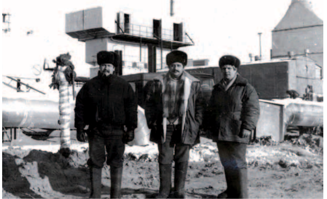
1994 год. Строительство ГПА-25 Тольяттинского ЛПУМГ