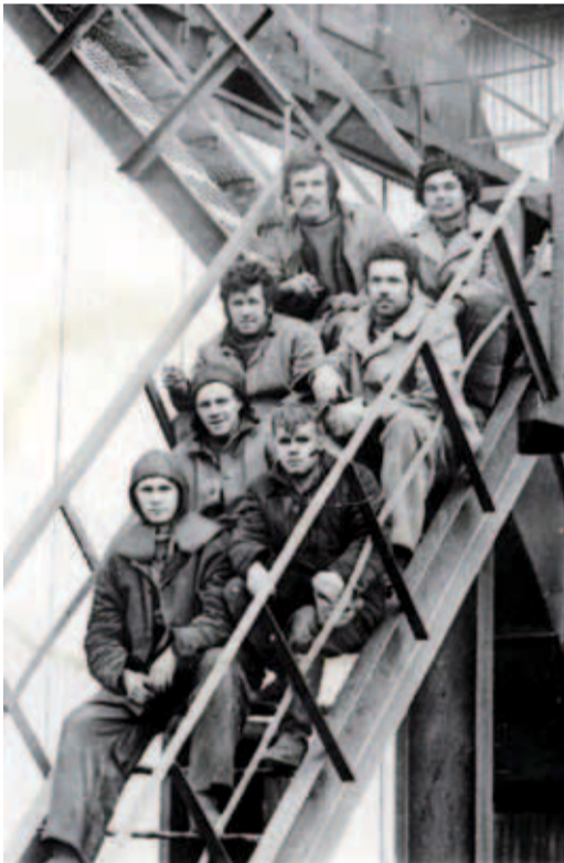
1980-е. Строители КС Сергиевского ЛПУМГ