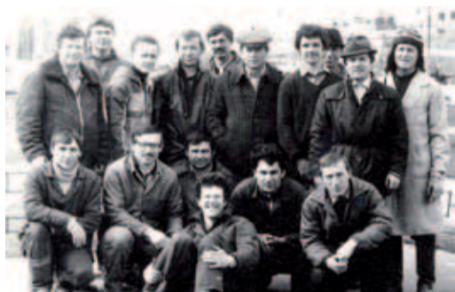
1983 год. ИТРовцы Тольяттинского ЛПУМГ