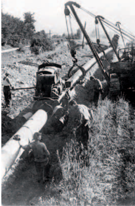
1973 год. Строительство МГ Оренбург-Куйбышев