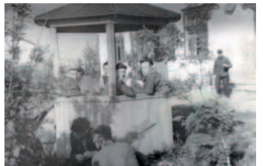
1960-е. В беседке у столовой ГКС п. Красные Пески