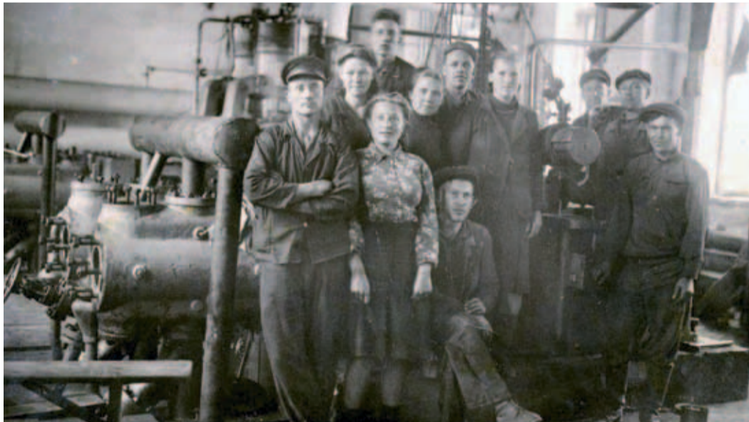
1940-е. Первая КС на ГП Бугуруслан-Куйбышев