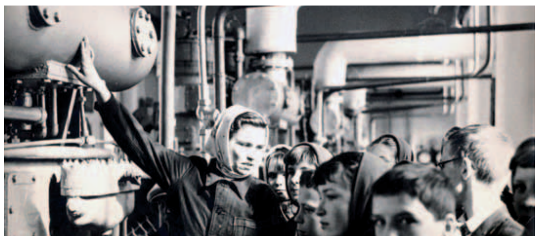
1968 год. Экскурсия на КС Похвистневского ЛПУМГ