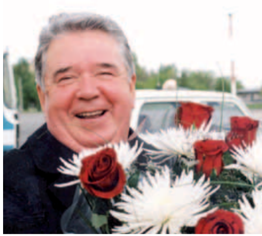
2002 год. Рэм Вяхирев в «Самаратрансгазе»