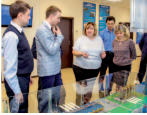
2015 год. В АДК открылся корпоративный музей