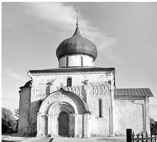
г. Юрьев-Польской. Георгиевский собор

собор восстановлен известным строителем Василием Дмитриевич Ермолиным, руководившим строительством Московского государства во второй половине XV века. Ермолин со значительными искажениями восстановил обрушившийся Георгиевский собор. Он сохранил, насколько возможно, стены старого храма и возвёл заново разрушенную часть сооружения. Для этой