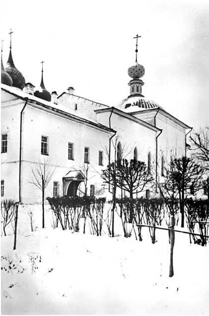
Крестовоздвиженская церковь. 1960-е годы