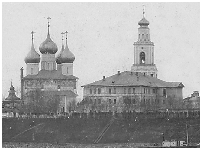
Митрополичьи палаты. Вид здания, перестроенного в 1830-е годы по проекту губернского архитектора П.Я. Панькова

В советские годы произошел отход от православия, других религий, в результате чего объекты культового зодчества не признавались памятниками архитектуры и нещадно разрушались. Однако и в эти годы продолжали работать архитекторы-реставраторы, сохранявшие памятники архитектуры, развивалась реставрационная школа. Вопреки государственной идеологии, часто ценой риска собственной жизни восстанавливались и реставрировались объекты культового зодчества. Новейшим достижением в реставрационном деле стало укрепление древней кирпичной кладки путем инъекции нового раствора в толщу кладки (профессор И.В. Рыльский). Академиком П.Д. Барановским (1892-1984 г.г.), на основе изучения древней строительной технологии, были выработаны методы определения выноса срубленных кирпичных деталей по оставшимся в кладке частям кирпича и установления ширины растёсанных проемов с помощью разверстки кирпича. Барановским также было предложено использовать каналы старых деревянных связей для за-