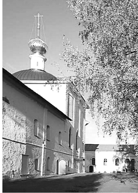
Крестовоздвиженская церковь. 2000-е годы

стены, возведённые в XIX веке, а также конструкции позднего разместив её в едином объеме без перепадов кровли по высоте.