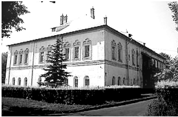
Митрополичьи палаты. Современный вид здания

Митрополичьи палаты были построены в 1670-е годы на средства Ростово-Ярославской митрополии по указу митро-