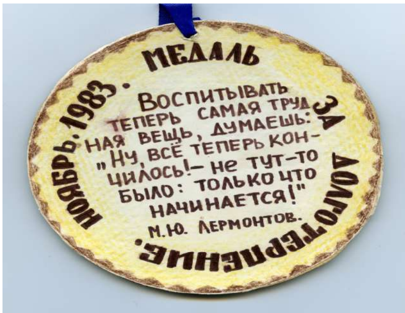
Рис. 75. Медаль от выпускников 1984 года, которую Валентина Яковлевна хранила вместе с государственными наградами

Выпускники 10 "Б" в день рождения Учителя (ей в 1983 году исполнилось 65 лет) наградили её медалью (рис. 75).