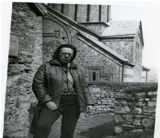
Рис. 66. Любимое фото, которое лежало под стеклом письменного стола. Грузия. Ананури, 1976 год