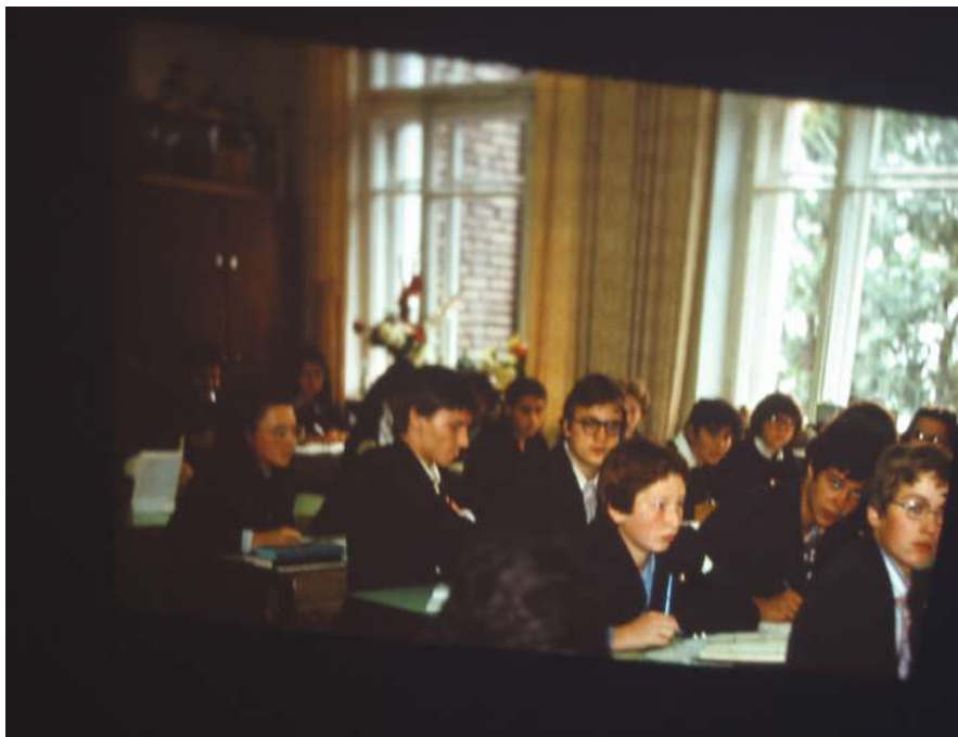
Урок математики в 8-9 классе у выпускников 84 г.