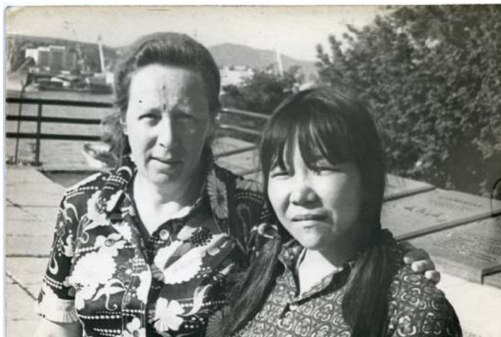
Рис. 65. Во Владивостоке с представительницей якутского народа, 1976 год