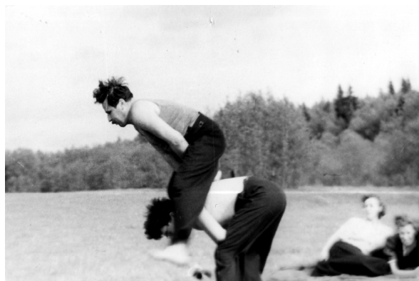
Рис. 49. "Корпоратив" учителей спецшколы № 1 в 50-е годы