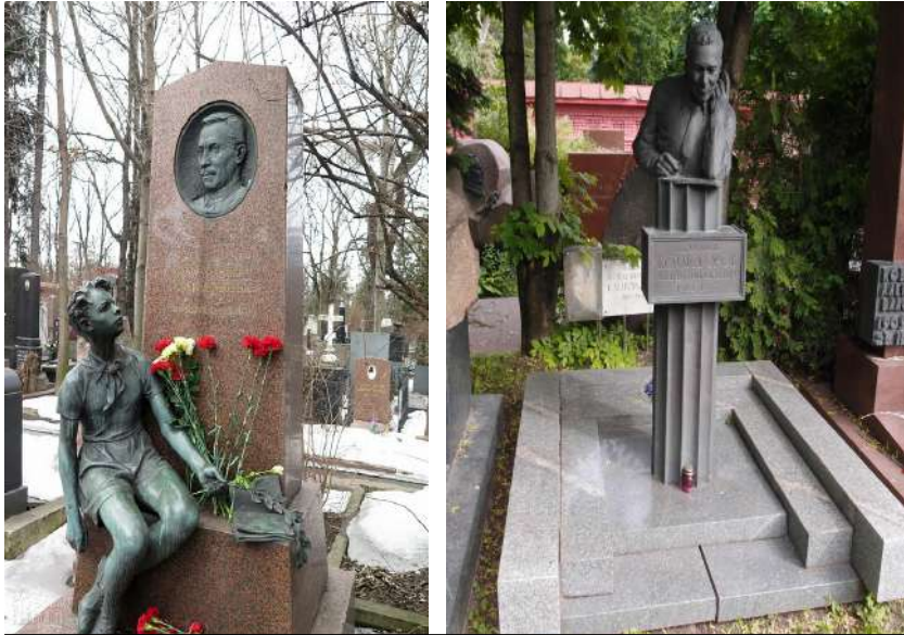
Рис. 88. Надгробия А. С. Макаренко и А. Н. Колмогорова в Новодевичьем некрополе

грязные надгробия (рис. 88) у двух своих кумиров в учительской профессии: Антона Семёновича Макаренко – великого советского педагога, который в отношениях с воспитанниками придерживался принципа «Как можно больше требований к человеку и как можно больше уважения к нему» , и Колмогорова Андрея Николаевича – академика, математика, педагога, по чьей инициативе был создан первый в стране специализированный учебно-научный центр «Школа-интернат при МГУ имени М. В. Ломоносова».