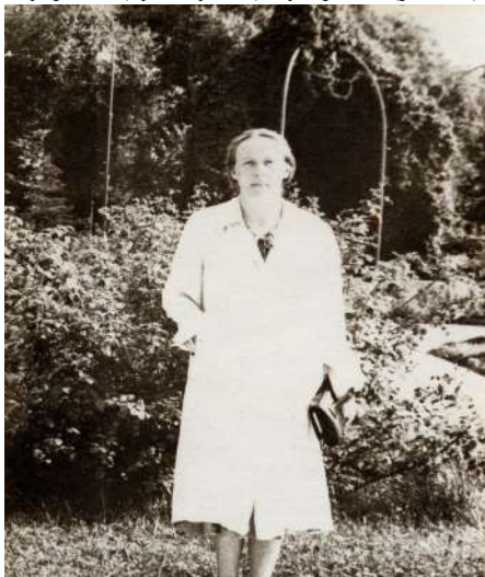
Рис. 33. Учитель математики и физики, 1956 год