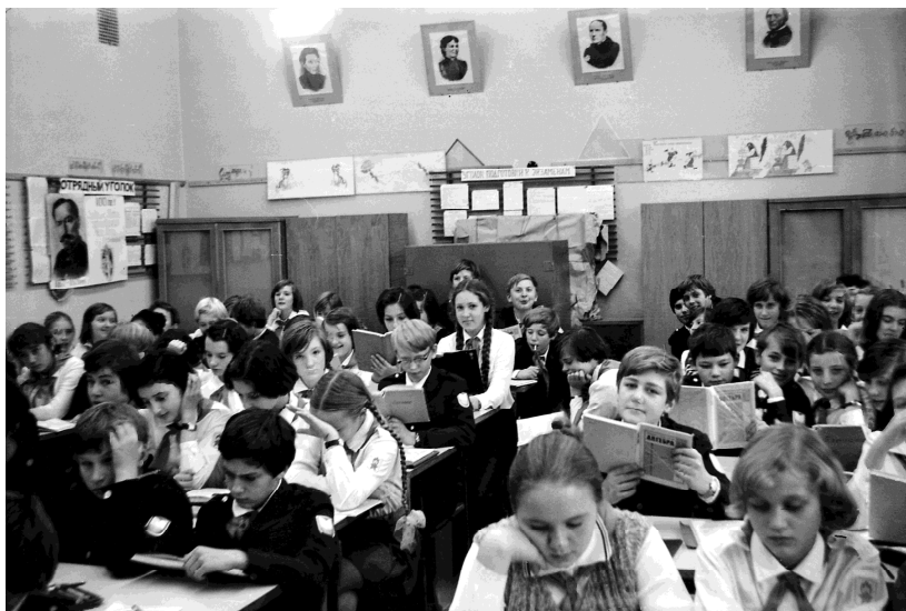
Урок математики в средних классах у будущих выпускников 1982 г.