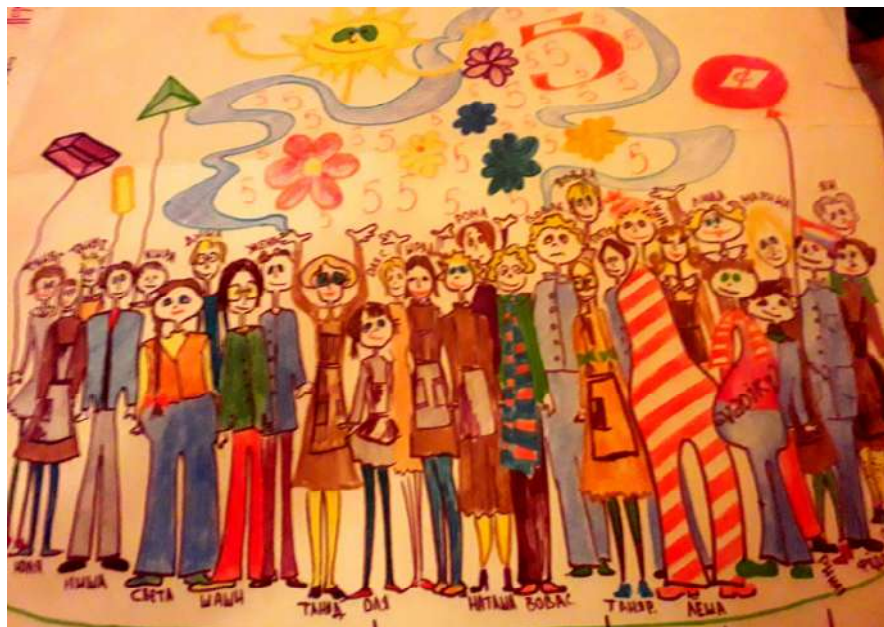
Рис. 77. Вот такой рисунок сделал ко дню рождения Учителя выпускной 10 "Б" в 1981 году

Вот как поздравили Учителя с юбилеем (50 лет) её ученики, по-видимому, 1979 года выпуска, поскольку дата на поздравлении стоит 25 ноября 1978 года: