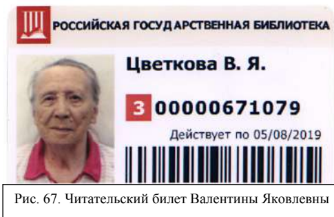
Рис. 67. Читательский билет Валентины Яковлевны