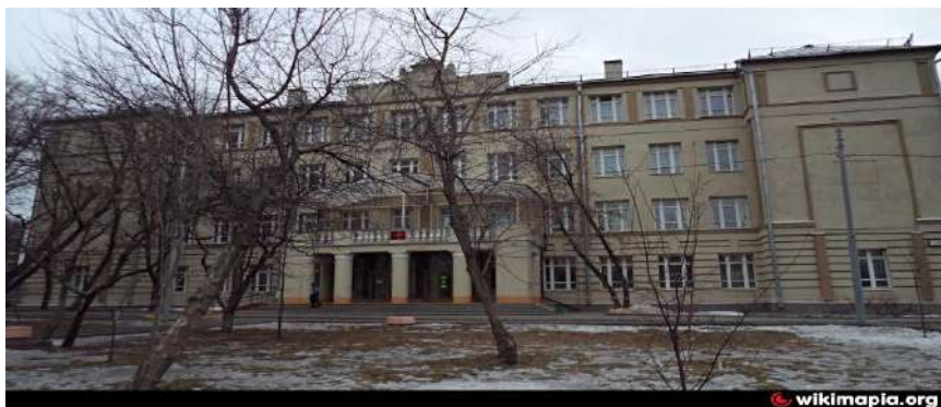
Рис. 24. Спецшкола № 1 с белым крыльцом в Сокольниках