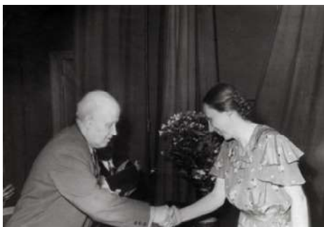
Рис. 22. Вручение диплома с отличием