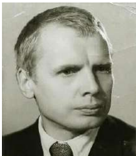
Рис. 71. Б. В. Гнеденко

мою "тепло-хладную", конформистскую позицию категорически отрицала. Наш Учитель говорила (привожу выдержку из того же выступления): "Мне проще было бы поставить три в году бездельникам и не тратить на них своё драгоценное время. Я же каждый день в июне занималась по два часа и более, ибо понимала, что несу ответственность перед государством, кого я выпускаю из стен школы" .