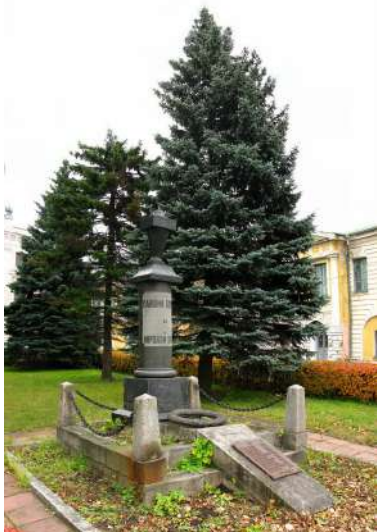
Рис. 4. Памятник борцам за мировой Октябрь