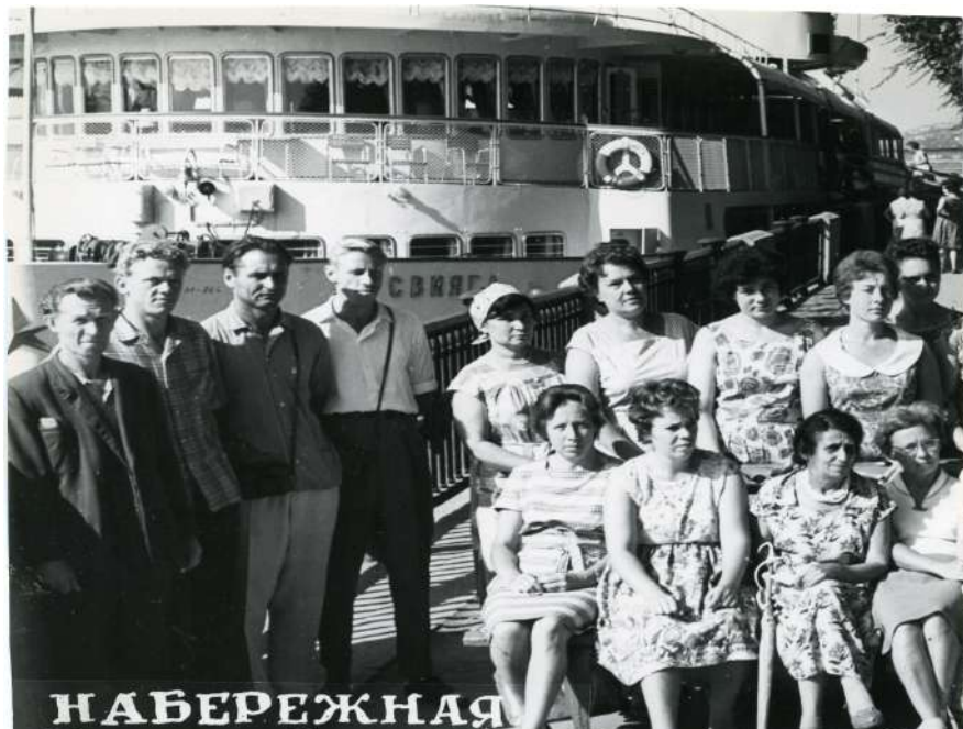
Рис. 61. Путешествие до Ростова-на-Дону, 1964 год

1964 год МОСКВА – РОСТОВ-НА-ДОНУ НА ТЕПЛОХОДЕ: МОСКВА – УГЛИЧ –