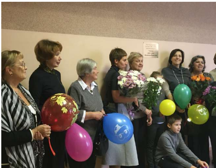
Рис. 104. Разные моменты торжественного открытия памятного знака