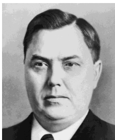
Рис. 19. Маленков Г.М.