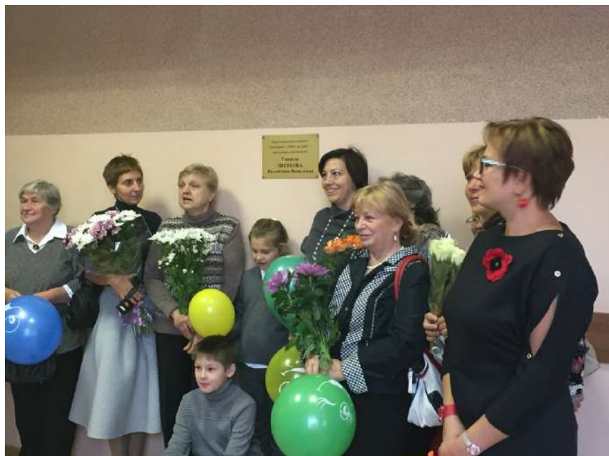
Рис. 103. Разные моменты торжественного открытия памятного знака

сделала для сохранения истории школы, сколько, пожалуй, не сделал ни один учитель. Она замолчала, и больше эту тему мы не обсуждали.