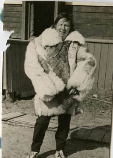
Рис. 62. Шуба-то - из оленьего меха! 1972 г.

1972 год ЯКУТСК – ТИКСИ НА ТЕПЛОХОДЕ "МЕХАНИК КУЛИБИН": ОСЕТРОВО, ЯКУТСК, ЖИГАНСК, ОЛЕКМИНСК, ЛЕНСК, МИРНЫЙ, ЧЕРНЫШЕВСКИЙ, ВИЛЮЙСКАЯ ГЭС, КИРЕНСК, ОСЕТРОВО. АБАКАН – КЫЗЫЛ – ШУШЕНСКОЕ – МИНУСИНСК – САЯНО- ШУШЕНСКАЯ ГЭС – КРАСНОЯРСК.