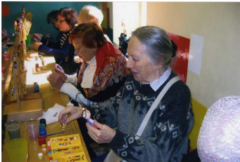
Рис. 96. А здесь нужны handmade технологии. В кружке по изготовлению игрушек