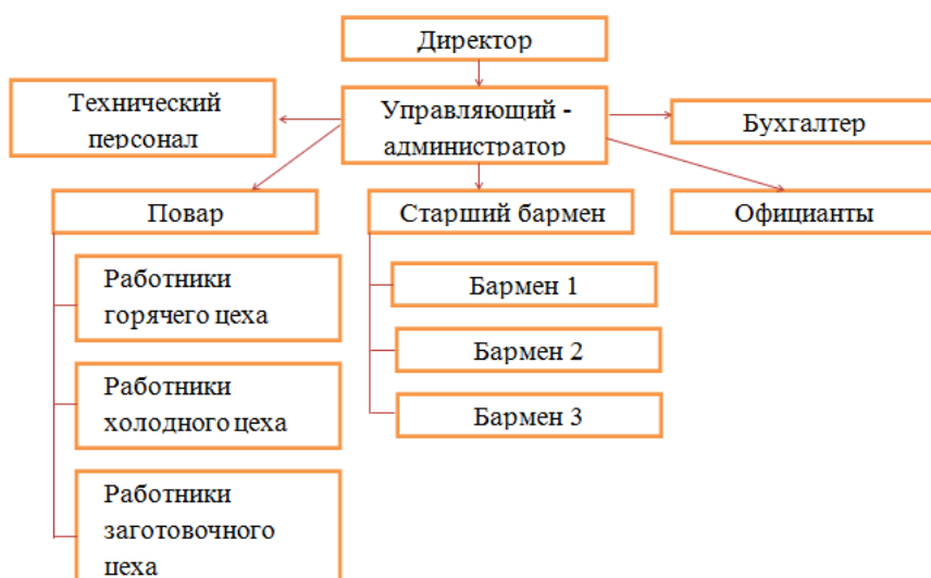
Рис. 1. Организационная структура ООО «Каховка»

Фактическая численность работников данного предприятия составляет 18 человек. Организационная структура представлена линейным управлением (Рисунок 1).