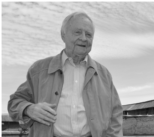
На вечерней площади Пскова, 24 августа 2016 г.

В 2003 г. при раскопках под руководством автора статьи были обнаружены подземные части построек подворья Снетогорского монастыря, подвалы Евфимиевской