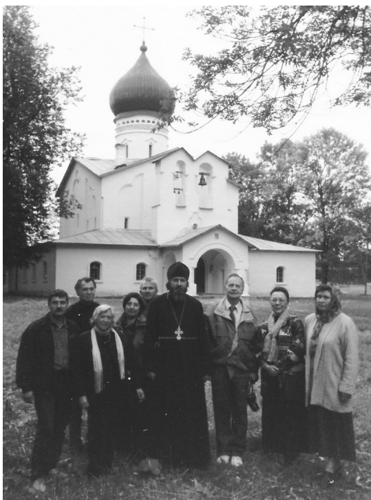
На фоне возрожденного собора Державной иконы Божией матери в Гдовской крепости.