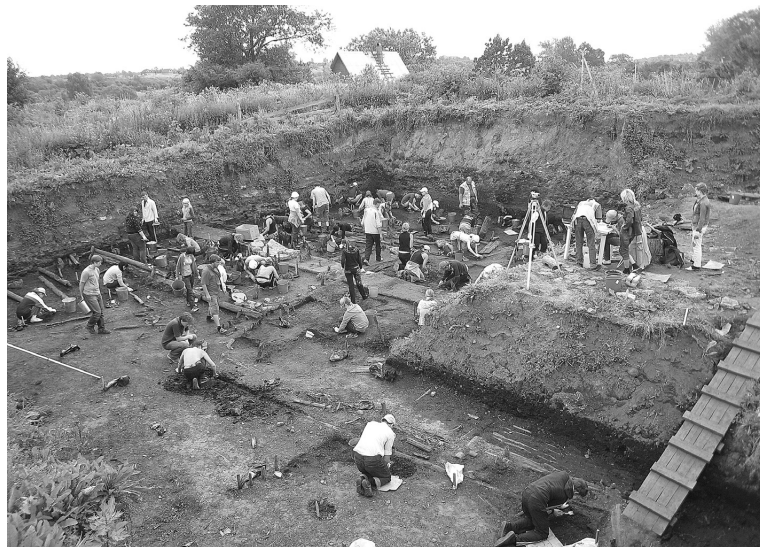
Раскопки в Старой Ладоге, 2009 г.