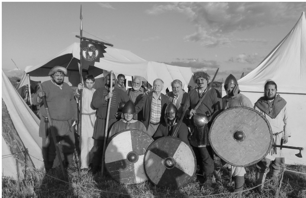
Исторический фестиваль реконструкторов «Старая Ладога — первая столица Руси», Старая Ладога.