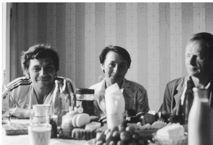
В Староладожской экспедиции.

Особенно успешно развивались всесторонние и планомерные исследования в области изучения истории культуры Древней Руси, а также славяно-финно-угорского и скандинавского взаимодействия на территории Руси и Северной Европы. Успеху в немалой степени способствовало налаживание постоянного научного сотрудничества с археологами прибалтийских республик, особенно — долгосрочное сотрудничество с археологами соседней Финляндии, оставившее заметный след в науке в виде 14 томов «Трудов» регулярных советско/российско-финляндских симпозиумов и двухтомника «Финны в Европе VI–XV вв.» 5 , да и просто человеческих контактов ученых, разрабатывавших близкие темы. Этот проект, запущенный еще в 1969 г. в Москве и возглавляемый Б. А. Рыбаковым, начал получать реальное воплощение только в 1976 г. (I симпозиум) и поддерживался долгие годы благодаря неистощимому энтузиазму и организаторским качествам А. Н. Кирпичникова и, конечно, его общительному характеру. Симпозиум открывал также пути взаимодействия сотрудников сектора и с исследователями других скандинавских стран, особенно Швеции. А. Н. Кирпичников был мощным мотором этого движения, заражая энергией коллектив, заставляя откликаться на свои