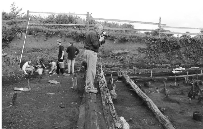
Раскопки на Земляном Городище. Фотофиксация «большого дома» эпохи викингов. 2010 г.

Работы первоначально велись в течение одного летнего месяца, при участии верных практикантов — историков первого курса Областного педагогического института имени А. С. Пушкина. Уже потом, после празднования юбилея «Старая Ладога — древняя столица Руси» в 2003 г.