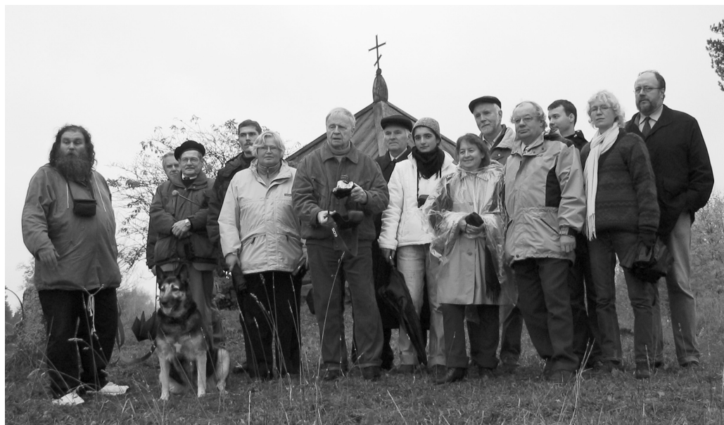
Участники Российско-Финляндского симпозиума в Пушкинских Горах на Савкиной Горке, 2003 г.