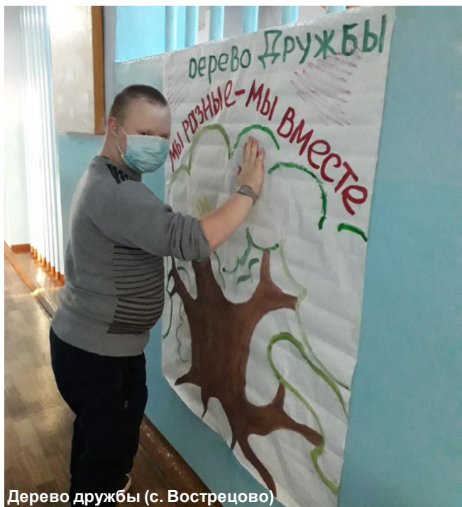
Дерево дружбы (с. Вострецово)

был посвящен определенной теме и заданиям, которые школьники с удовольствием выполняли. А началось все с добрых дел: ребята делали гирлянды,