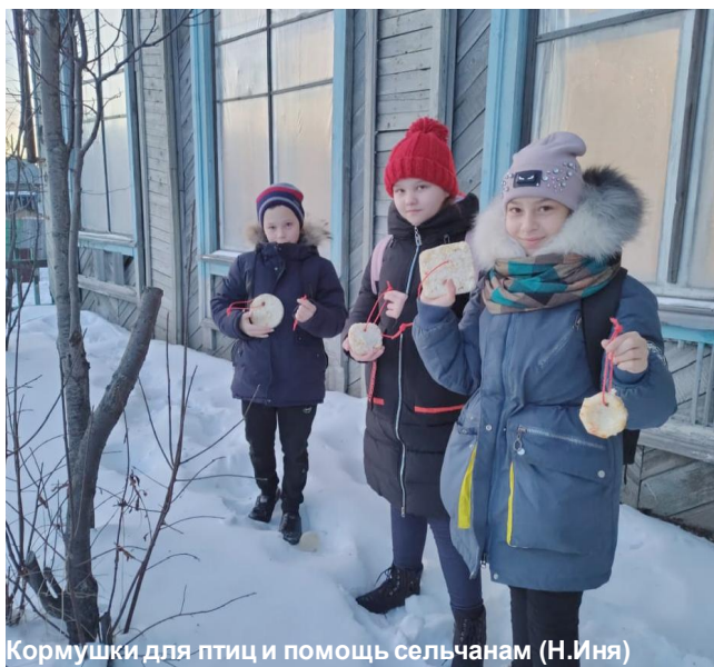
Кормушки для птиц и помощь сельчанам (Н.Иня)

О том, как проходила Неделя психологии в одном из самых отдаленных поселе-